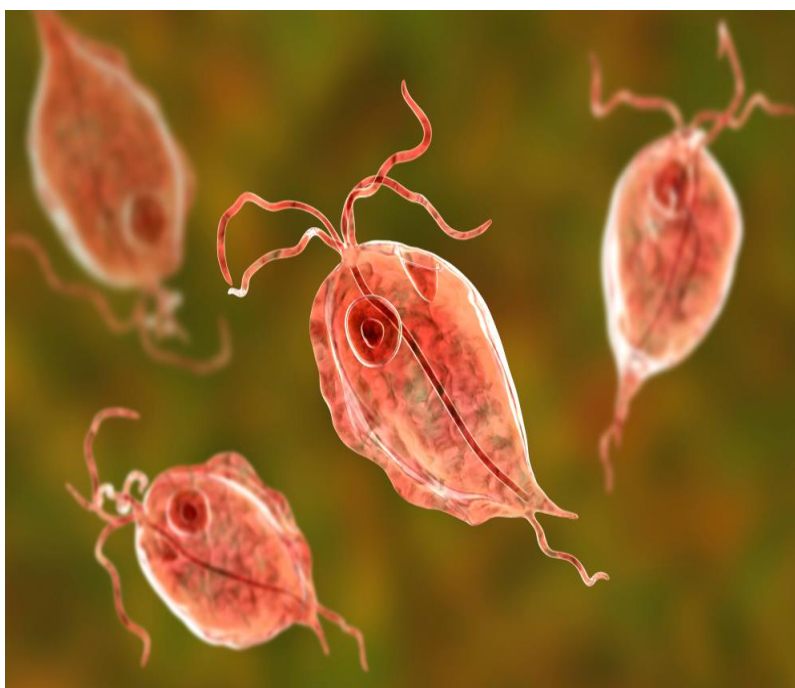
Slika 3.1.1 Trichomonas vaginalis

Trichomonas vaginalis (TV) je jednostanični anaerobni protozoarni parazit koji izaziva infekciju spolnog sustava. Kod žena nalazimo ga u rodnici, dok je kod muškaraca prisutan u donjem mokraćnom sustavu. Kruškolikog je ili ovalnog oblika, te na prednjem dijelu ima četiri manja biča i jedan veći bič na stražnjem dijelu, dok se sa strane nalazi undulirajuća membrana. Za kretanje se služi bičevima, membranom istvaranjem lažnih nožica (pseudopodijem)[5].