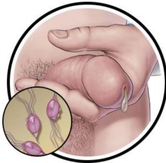
Slika 3.3.2 Simptomi trihomonijaze na muškom spolnom organu