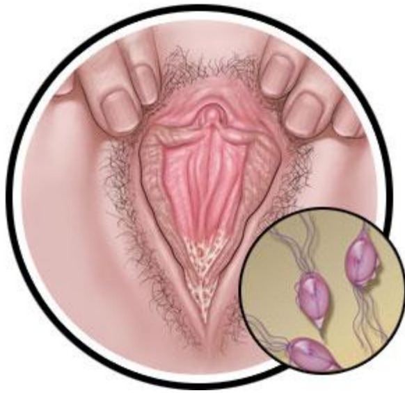
Slika 3.3.1 Simptomi trihomonijaze na ženskom spolnom organu

madidacija vanjskog ušća uretre. Epididimitis ili prostatitis javljaju se u rijetkim slučajevima [12].