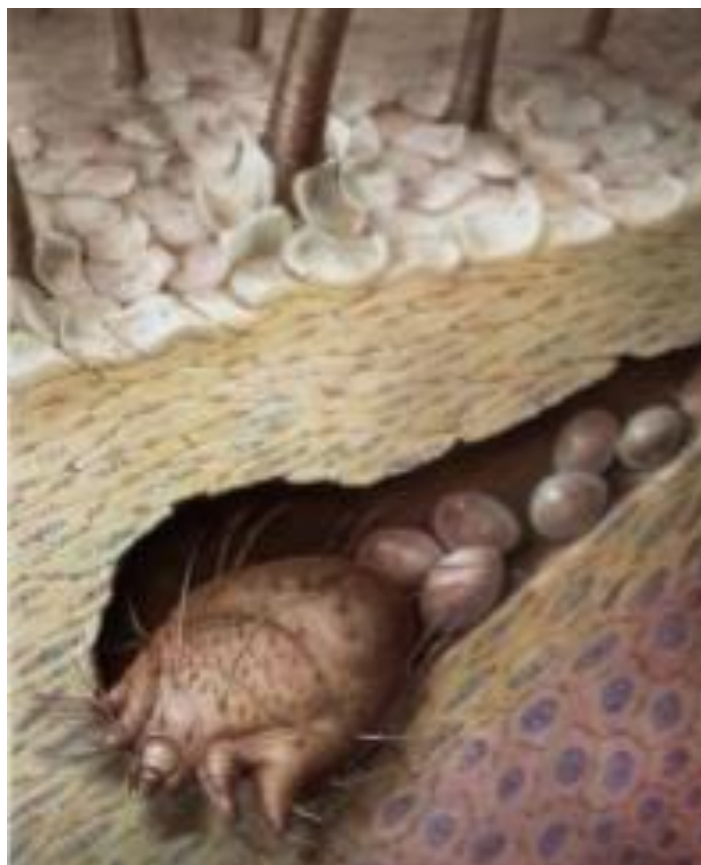
Slika 3.8.3 Ženka grinje polaže jaja