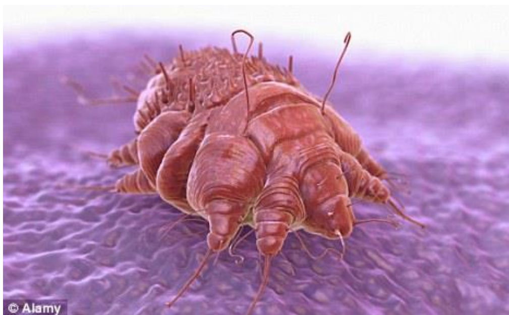
Slika 3.8.1 Mangan grinja uzročnik svraba

Kršćica manga je člankonožac s osam nogu, jedva vidljiv golim okom ( slika 3.8.1. ) Veličina grinja odrasle žene kreće se između 0,3 i 0,5 mm. Ženka grinja ima ovalno tijelo koje je ravno na podlozi i ispupčeno na gornjoj površini. Ima dva para prednjih i stražnjih nogu. Prednje noge završavaju u dugim nepovezanim člancima nazvanim "usisnici", dok zadnje noge završavaju u dugim čekinjama. Jaja se polažu kroz tokostome, prorez na sredini ventralne površine ženke. Muške grinje manje su veličine i predstavljaju vanjski genitalni aparat [19].