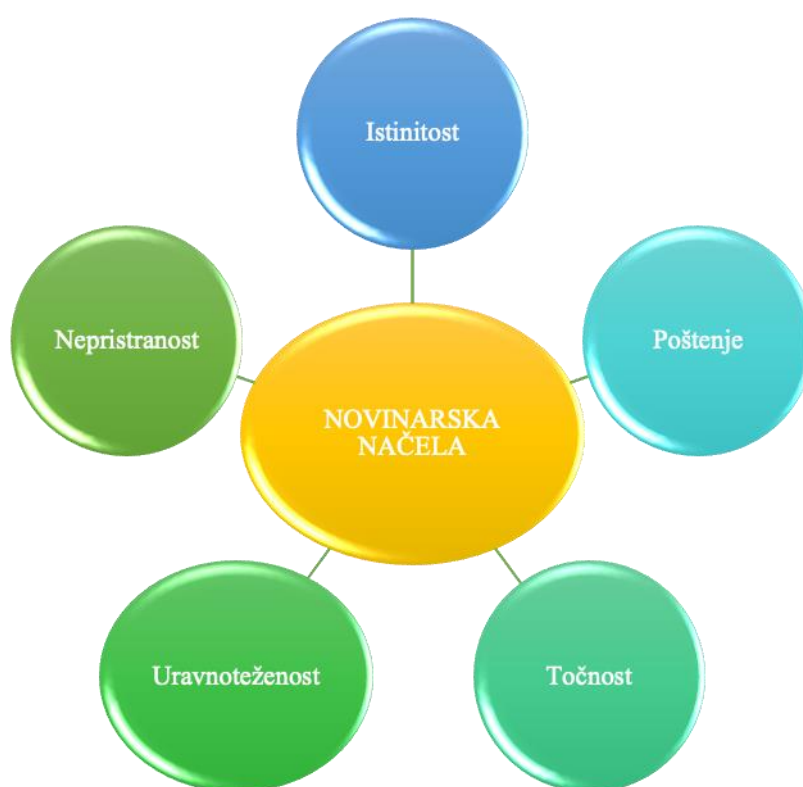
Slika 3.1. Novinarska načela 2

Svaka pojedina informacija koja će biti plasirana mora prije svega biti istinita. Ukoliko se informacija pokaže neistinitom, tada se ista ne može smatrati nikakvom viješću. Malović tumači kako se novinarstvo prije svega temelji na informiranju o različitim činjenicama koje su se dogodile. Ukoliko te iste činjenice nisu istinite, tada ne postoji pravo novinarstvo (Malović 2005:19).