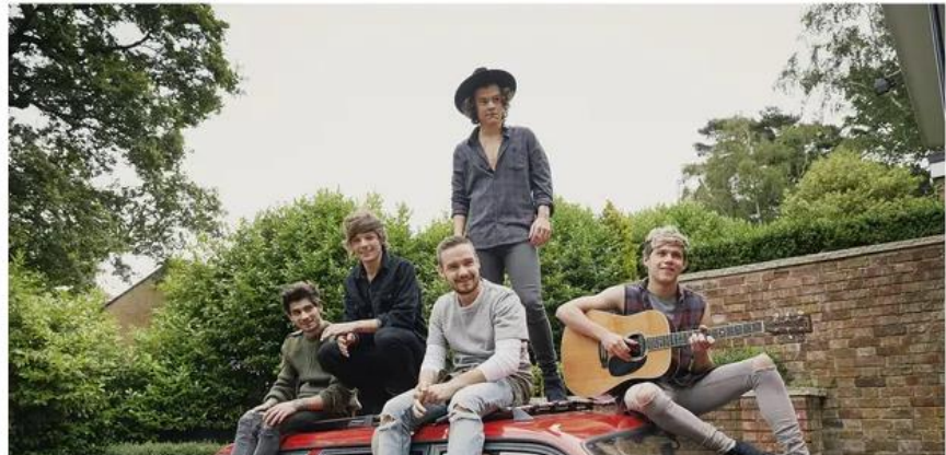
Slika 5.2. One Direction 25

Novinar se pritom vješto koristio i otvorenim pitanjima, gdje se članovima benda dopuštalo objasniti neke situacije. Kako je već rečeno, otvorena pitanja su prikladnija mlađim osobama, premda su članovi One Direction, što se vidi i iz opisa novinara, itekako već naviknuti na davanje izjava i intervju. Isprepliće se to i sa zatvorenim pitanjima, konkretno vezano pitanje je li potpisan svojevrsni „pakt“, pretpostavljamo kako je riječ o ugovoru, ukoliko neki član benda poželi napustiti bend. U intervju se otkrivaju i dijelovi iz njihovog privatnog života, kao primjerice afera jednog od članova sa 16 godina starijom voditeljicom, ili kako je jedan od članova prolazio kroz fazu depresije nakon što su članovi ispali iz showa X factor. No, potpuno su izbjegnuta pitanja vezana za spomenute sporne fotografije i video članova benda. Ostali dijelovi iz njihovog privatnog života se ne otkrivaju, čak ni mjesto gdje je vođen intervju. Navedeno je samo kako je riječ o planinskim dijelovima SAD-a.