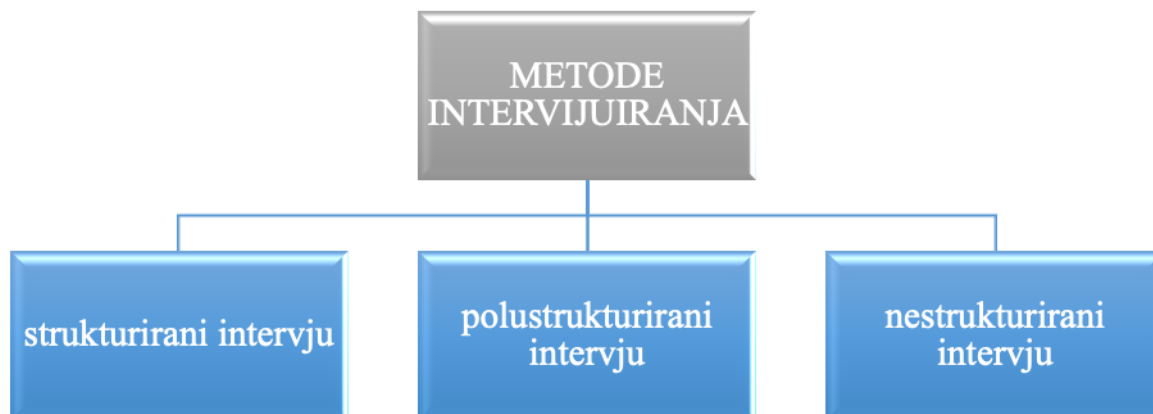
Slika 2.1. Metode intervjuiranja 1