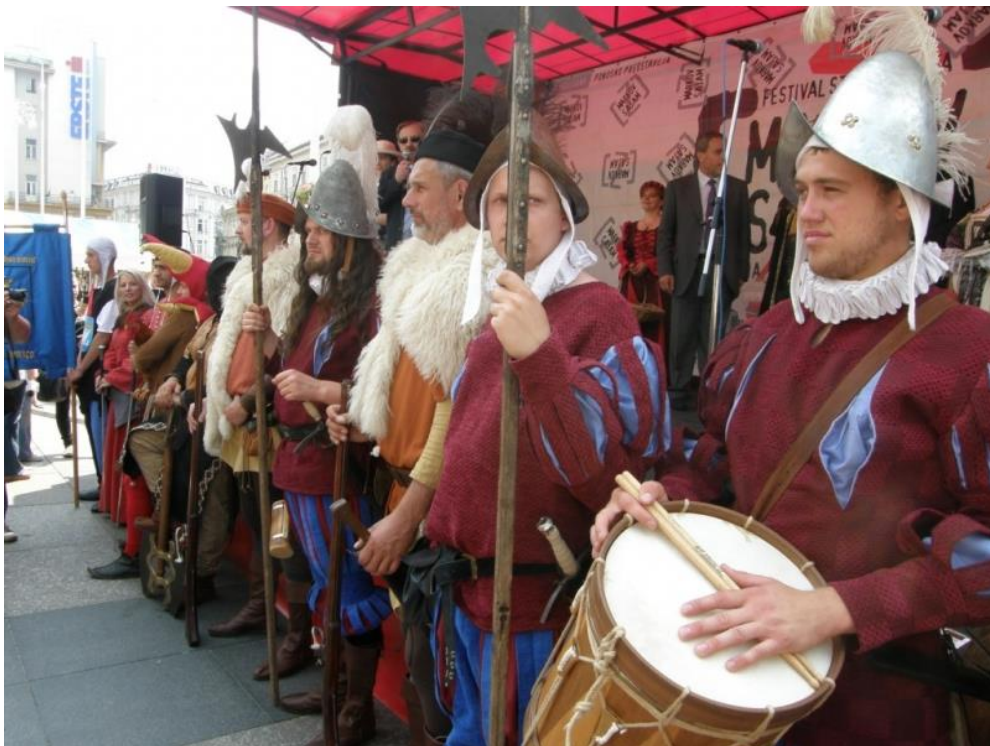
Slika 3.1.2. Mušketiri i haramije