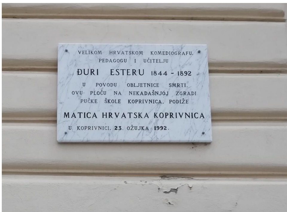
Slika 4.3. Ploča posvećena Đuri Esteru

Na Franjevačkoj crkvi nalazimo spomen-ploču podignutoj Fortunatu Pintariću. Ovom spomen-pločom željela se obilježiti 700. obljetnica dolaska franjevacu u Koprivnicu, a ploča je podignuta 30. travnja 1992. godine te ju je dao podignuti Ogranak Matice hrvatske Koprivnica.