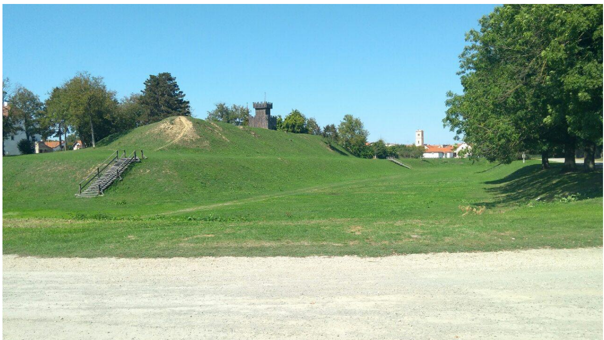
Slika 3.1.1. Prikaz bedema

Za povijesnu tradiciju Koprivnice važno je ono što je danas ostalo od utvrde. Naime, do danas je sačuvana oružana i dio opkopa oko tvrđave. Iako se sa sigurnošću ne zna kojeg je oblika tvrđava bila, ona je pa sve do kraja njenog postojanja, od trenutka gradnje često bila modernizirana. Nastala je za vrijeme renesanse te je to postalo temelje poznatog koprivničkog festivala, o kojem će se pisati nešto kasnije u radu. Oružana je zadržala oblik kakav je i imala. Riječ je o jednokatnici pravokutnog tlocrta s visokim krovštem, a prigraden joj je aneks vanjskog stubišta koji povezuje prizemlje i prvi kat ( https://www.min-kulture.hr/default.aspx?id=6212&kdId=365787560 ). Sama oružana izgrađena je početkom 16. stoljeća, te se nalazi na važnoj poziciji. Naime, oružana je izgrađena u blizini srednjovjekovnih starih vrata, koja su vodila u istočni dio Podravine i Slavonije, ali su bila zatvorena jer se s te strane očekivao prodor Turaka (Feletar, Fischer, Karaman i dr 1986: 86).