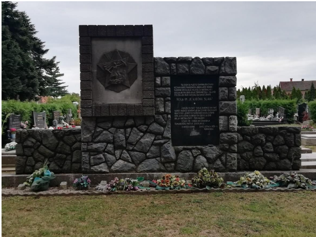
Slika 4.1. Spomenik na groblju Pri sv. Duhu

Što se spomenika vezanih uz Drugi svjetski rat tiče, krenut ćemo od onih postavljenih na gradskom groblju Pri sv. Duhu i jednog postavljenog na pravoslavnom groblju. Naime, tamo se nalaze spomenici posvećeni „znanim i neznanim junacima narodnooslobodilačke borbe“. Možemo reći kako su, onaj postavljen na pravoslavnom groblju i na gradskom groblju gotovo istovjetni. Oba su postavljena 4. srpnja 1959. godine, a postavio ih je Savez borca NOR-a Koprivnice u čast 40. godišnjici osnivanja Komunističke partije Jugoslavije. Generalno su identični te se s lijeve strane nalazi zvijezda, a s desne strane jednaki tekst. Izvedba je različita utoliko što su na glavnom gradskom groblju postavljeno i 70 stupića, koji simboliziraju broj ondje pokopanih partizana. Svaki stupić na sebi ima svoj broj.