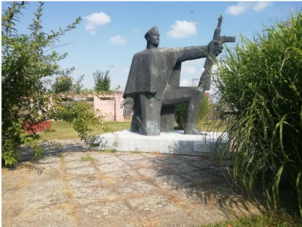
Slika 4.2. Spomenik „Izvidnica“

Na spomen-području „Danica“ smješten je i spomenik „Izvidnica“, autora Ivana Sabolića. Taj se spomenik prvotno nalazio na glavnom gradskom trgu, a 1995. godine premješten je na spomen-područje na kojem se i danas nalazi. Spomenik predstavlja partizanskog borca u izvidnici kojemu se u jednoj ruci nalazi oružje, a jednim je koljenom sagnut prema tlu. Postavlja se pitanje koliko su stanovnici Koprivnice upoznati s postojanjem tog spomenika, što se naročito odnosi na mlađe generacije koje ga nisu imale prilike vidjeti ni na trgu.