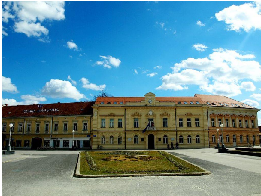
Slika 3.2. Gradska vijećnica

Najznačajniji prostor u središtu Koprivnice nalazi se kada prolazimo od Svilarske prema Zrinskom trgom, s lijeve strane, gdje se ravno ispred nas nalazi nova zgrada gradske vijećnice. Prvotno je ta zgrada služila kao škola, dok je danas vijećnica. Upravo je za ovu zgradu 17. travnja 1856. godine kamen temeljac položio ban Jelačić što dodatno povećava važnost ove zgrade (Jalšić 1995: 97). Što se tiče same građevine, ona ima obilježja neorenesanse. Tijekom godina je nadograđivana, a potpuno je adaptirana krajem 80-ih godina 20. stoljeća.