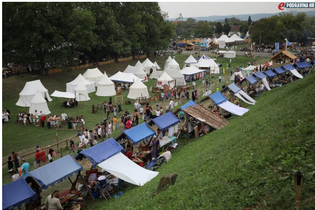
Slika 3.1.3. Prikaz Renesansnog festivala

Na primjeru ovogodišnjeg Renesansnog festivala, ukratko će se objasniti kako sve to izgleda. Dakle, festival traje četiri dana, odnosno od 22. do 25. kolovoza ove godine. Prvog dana festivala, u otvaranju manifestacije sudjelovale su samo koprivničke viteške skupine i obrtnici. Spomenuto je da festival svake godine ima određenu temu, a ove godine je tema bila tortura, odnosno prikaz korištenja sprava za mučenje. Prvog dana festivala nudile su se viteške interaktivne igre, renesansna modna revija, prikaz sprava za mučenje. Drugog i trećeg dana zatim je održan srednjovjekovni sajam te su se nudila srednjovjekovna jela, viteške igre, kao i prikaz sportova koji u sebi sadrže notu povijesti, odnosno prikaz kako je to nekad izgledalo. Posljednjeg dana festivala na rasporedu su bili uglavnom kulturno-umjetnički programi: predstave i glazbeni nastupi. Valja napomenuti da je ovaj prikaz veoma sažet te je program bogat i svakog dana nudi nove sadržaje vezane uz povijest. Dakle, kroz svaki se aspekt festivala nastoji dočarati kako je svakidašnji život izgledao u srednjem vijeku.