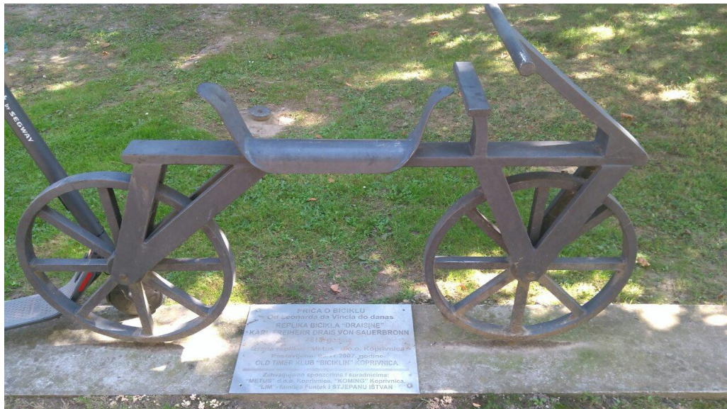
Slika 4.4. Spomenik biciklu u Ulici Antuna Nemčića

ploče se nalazi podatak o tome kada su postavljeni te o tome tko ih je dao postaviti. Spomenici biciklima su, dakle, relativno neutralni spomenici kojima se nadopunjuje zanimljivost koprivničkih ulica.