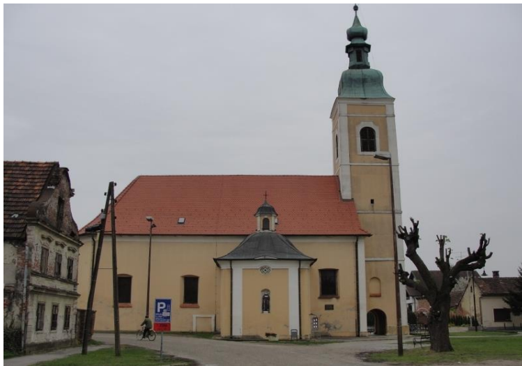
Slika 3.1. Crkva sv. Antuna Padovanskog

Značajna sakralna arhitektura izgrađena je tijekom 17. stoljeća, no brojne su građevine do danas i srušene. Iz tog razdoblja ostala je franjevačka crkva sv. Antuna Padovanskog koja je dovršena 1685. godine. Nešto ranije, između 1675. i 1680. godine, podignut je i novi zidani samostan dok je do tad postojao samo drveni. Simbolično, ali i vjerojatno zbog položaja, franjevačka crkva sv. Antuna Padovanskog nalazi se u Franjevačkoj ulici. Crkva je pravokutnog tlocrta s trostranim završenim svetištem (Feletar, Fischer, Karaman i dr. 1986: 93). Valja napomenuti da su franjevci, iako su u jednom povijesnom razdoblju iz Koprivnice nestali, na kraju povratili svoje posjede te su se u grad ponovno vratili.