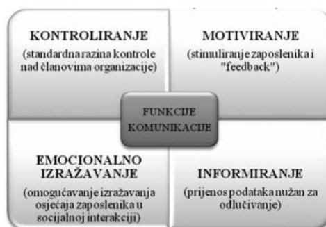
Slika 1. Temeljne funkcije poslovne komunikacije

Komunikacija u organizaciji može biti formalna i neformalna. Formalna komunikacija je komunikacija koja ima unaprijed isplaniran i sustavan način prijenosa informacija koji vrijedi u cijeloj organizaciji. Bez formalne komunikacije ne mogu se adekvatno obavljati organizacijski zadaci pa zbog toga menadžment konstantno nastoji poticati formalnu komunikaciju. Neformalna komunikacija je komunikacija koja nema plan i koja se temelji na osobnim vezama. Ponekad je problematična zato što ju je nemoguće kontrolirati (Jurković, 2012: 392-393). Komunikacija u organizaciji ima četiri temeljne uloge; kontroliranje, motiviranje, emocionalno izražavanje i informiranje što je prikazano na slici.