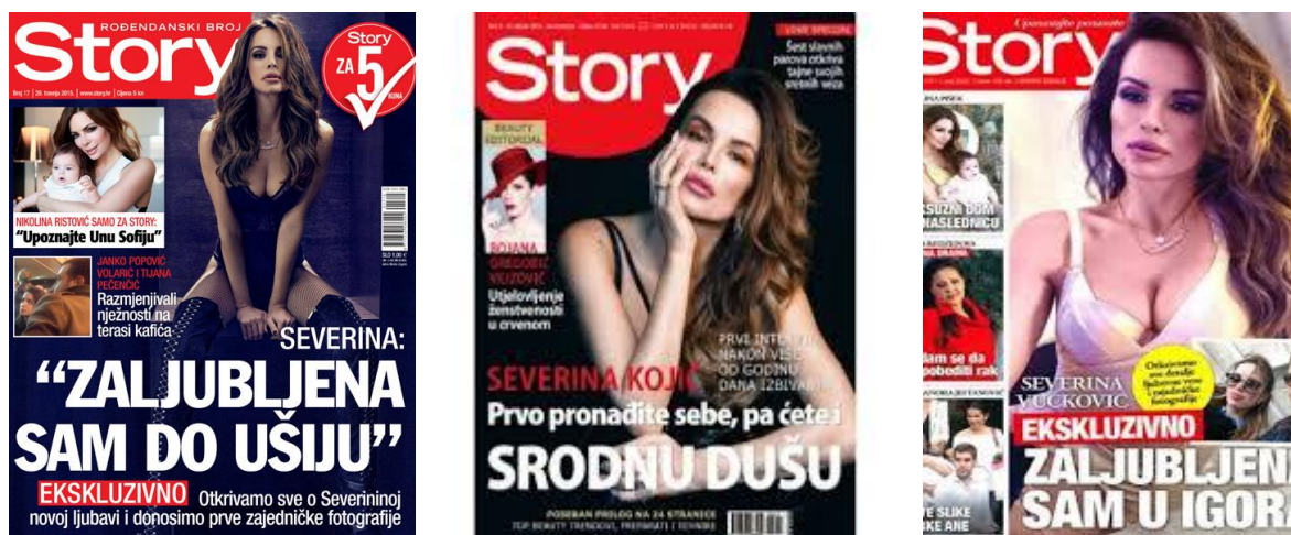
Slika 4.5. Severina na naslovnicama časopisa Story.hr

Severina je pjevačica koja je poznata po tome da voli pokazivati svoje tijelo u javnosti, neovisno o kojem mediju se radi, a često i sama objavljuje takve fotografije na svojim privatnim profilima na društvenim mrežama. Story.hr na nekoliko je naslovnica objavio Severinu, a na svakoj od njih ona je bila provokativno odjevena.