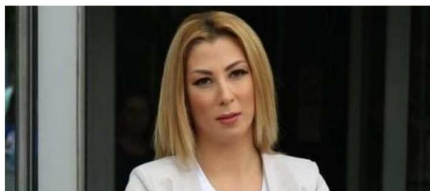
Slika 7.2. Članak na Story.hr : „Pretukao ju otac djeteta, a sada je se odrekao vlastiti otac“

Sljedeća analiza odnosi se na dva gotovo identična članka. Objavljeni su istog dana u razmaku od jedan sat. „Odbrusila golom fotkom: 'Kad se žena skine krene seksizam“ 19 naslov je novinarkine Astrid Čada na portalu 24sata.hr dok Story.hr objavljuje naslov novinara/novinarke G.G. „Žanamari: 'Kada žena objavi sliku s plaže, krene seksizam“. 20