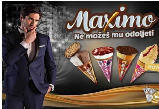
Slika 4.3. Muškarac na Ledo reklamama

Sljedeća Slika 4.4. prikazuju hrvatsku pjevačicu Severinu koja reklamira isti proizvod kao i muškarac na prethodnoj slici. Vidljivo je kako reklama ide u seksističkom smjeru prikazujući Severinu gotovo razodjevenu, s napućenim usnama prema sladoledu i dvosmislenim tekstom „Pažljivo skidajte!“ koji nije usmjeren samo na proizvod koji pjevačica reklamira, nego otvara prostor i za drugačije shvaćanje poruke.