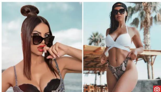
Slika 7.3. Članak na 24sata.hr: „Odbrusila golom fotkom: 'Kad se žena skine krene seksizam'“

Piše Astrid Čada, četvrtak, 22.8.2019 u 21:00