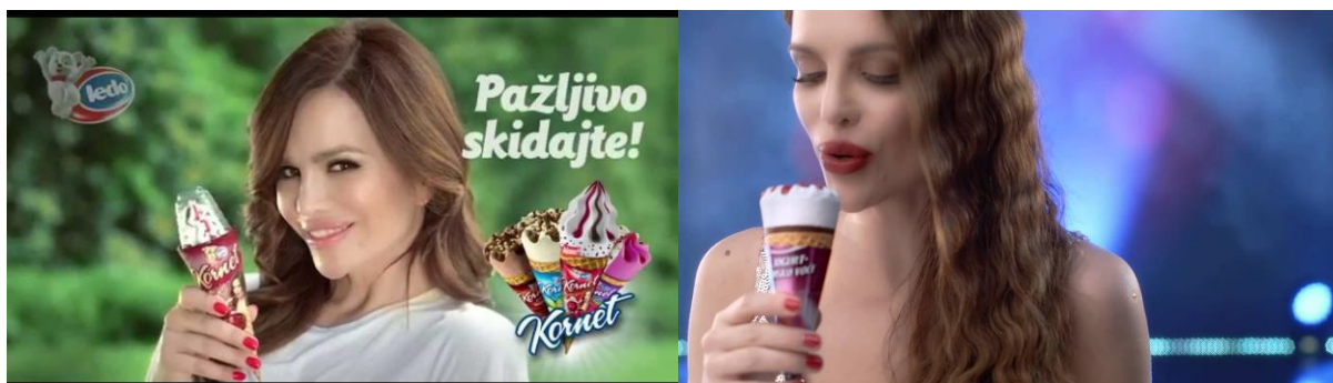
Slika 4.4. Severina na Ledo reklamama

Sljedeća Slika 4.4. prikazuju hrvatsku pjevačicu Severinu koja reklamira isti proizvod kao i muškarac na prethodnoj slici. Vidljivo je kako reklama ide u seksističkom smjeru prikazujući Severinu gotovo razodjevenu, s napućenim usnama prema sladoledu i dvosmislenim tekstom „Pažljivo skidajte!“ koji nije usmjeren samo na proizvod koji pjevačica reklamira, nego otvara prostor i za drugačije shvaćanje poruke.