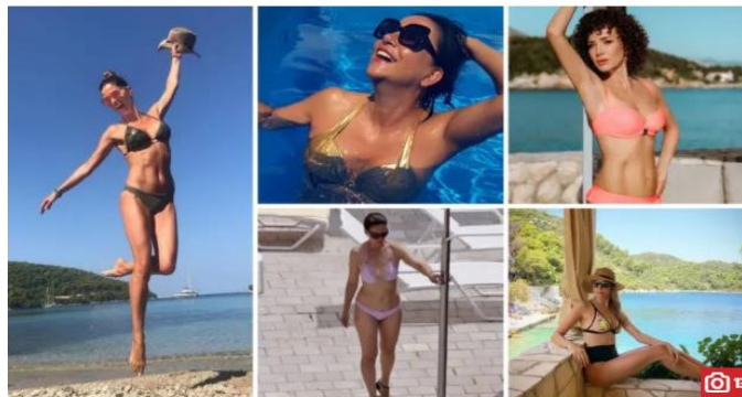
Slika 6.4. Članak na 24sata.hr : „Hrvatske ljepotice dočekale su razgoliti se u tajnim uvalama“

Piše Paula Osojnik, srijeda, 31.7.2019 u 6:47