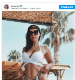
Slika 7.4. Članak na Story.hr: „Žanamari: 'Kada žena objavi sliku s plaže, krene seksizam'“

Domaća pjevačica Žanamari Lalić na društvenim mrežama s obožavateljima često dijeli svoja razmišljanja o aktualnim događanjima. Ovog puta, počela se na seksizam s kojim se, kako kaže, brojne žene susreću kada podijele fotografiju u kupaćem kostimu. S druge strane, kada ju objavi muškarac, to je već druga priča.