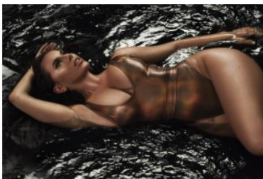
Slika 8.2. Članak na Story.hr: „Nives Celzijus: 'Udvarače odbijam na dnevnoj bazi'“

Taman kad čovjek pomisli da ovo ljeto ne može biti toplije, nastane još veći pakao kad Nives ubode novi hit. Atraktivna pjevačica naše Celzijuse podigla je do rekordnih usijanja objavom provokativnog video spota za novu pjesmu 'Odjebando'. Njezine bujne obline prite na sve strane, a mnogi obožavatelji umjesto osvježenja mogu doživjeti tek srčani udar. Ali, takva je Nives Celzijus: umjesto olakšanja, donese još veći pritisak. Nekome po tlakomjeru, a nekome u životu. Ona ništa ne prepušta slučaju. Gore zato danas društvene mreže zbog naše estradne ikone seksipila. Jer, ovako 'vruć' spot, slažu se mnogi, vatrena Nives dosad nije objavila. Na vrlo simboličan način prvi je put prihvatila i neki novi glazbeni izričaji.