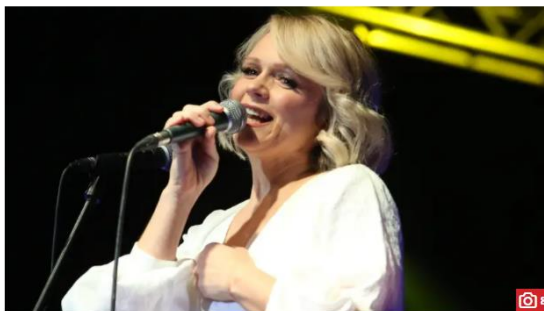
Slika 7.1. Članak na 24sata.hr : „Imala sam iskustva koja su bila vezana uz seksualno nasilje...”

Piše Astrid Čada, utorak, 17.9.2019 u 20:45