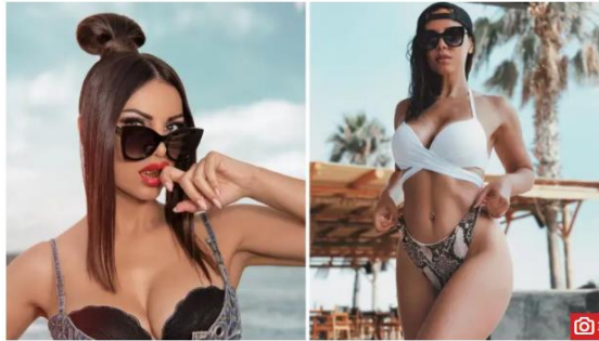
Slika 7.3. Članak na 24sata.hr: „Odbrusila golom fotkom: 'Kad se žena skine krene seksizam'“

Piše Astrid Čada, četvrtak, 22.8.2019 u 21:00