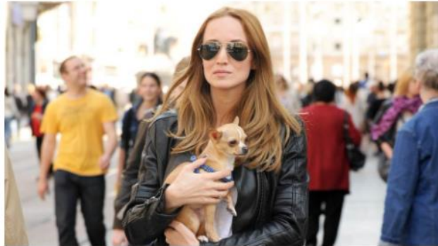
Slika 8.4. Članak na Story.hr: „Bivša Feminemka: 'Hvala ti na oduzetom'”