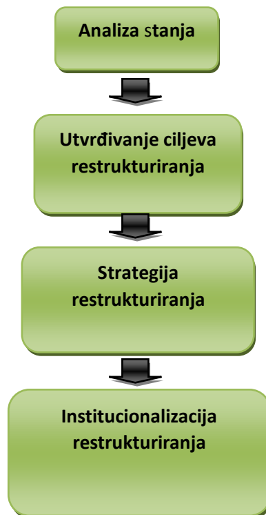
Slika 1. Proces restrukturiranja