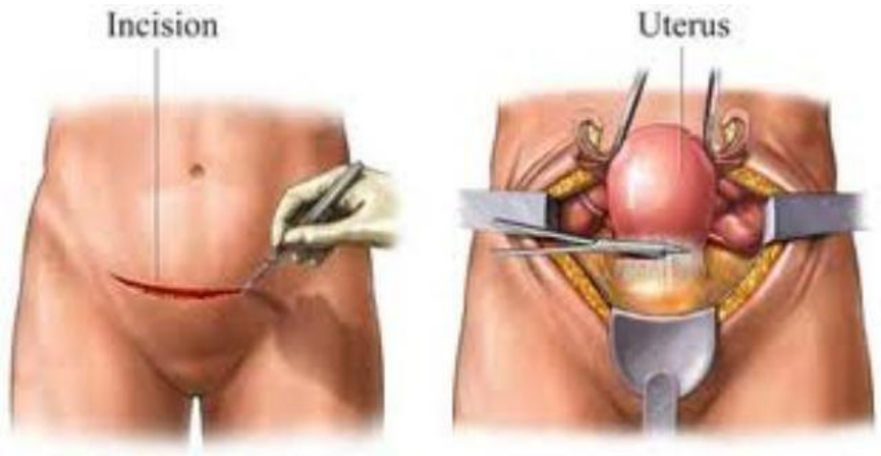
Slika 2. Prikaz laparotomije