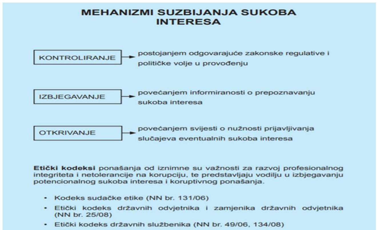
Slika 10. Mehanizmi suzbijanja sukoba interesa

Do usvajanja novog Zakona o sprječavanju sukoba interesa, metoda kojim bi se organizacije trebale koristiti kako bi se spriječili potencijalni sukobi interesa isključivo su edukacija i promicanje svijesti o štetnosti sukoba interesa na društvo.