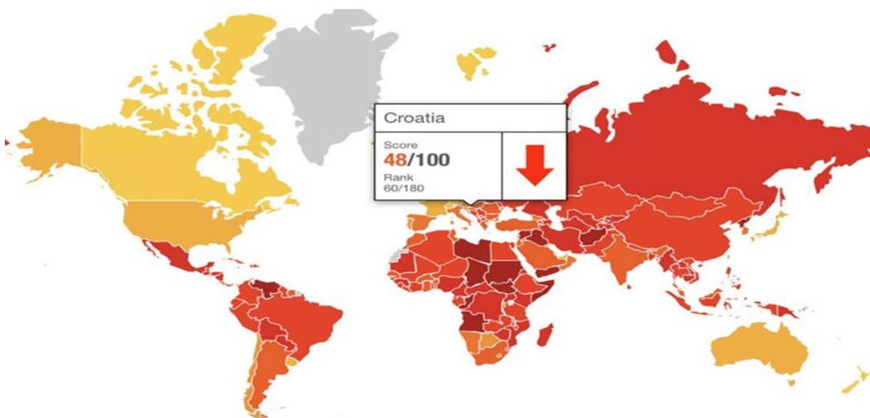
Slika 2. Infografika: indeks korumpiranosti za 2018. – Hrvatska