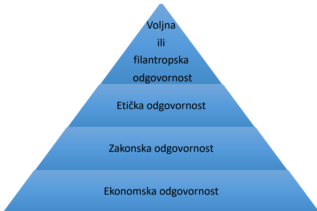
Slika 4. Carrollova piramida društvene odgovornosti

I zato je društvena odgovornost obaveza svih koji posluju da uz cilj povećavanja profita povećavaju i pozitivan utjecaj svog poslovanja na društvo.