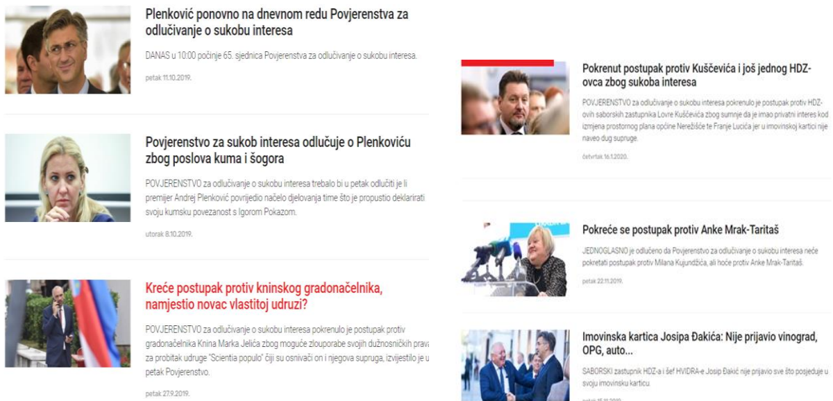
Slika 6. Naslovi na vodećem portalu Indeks.hr