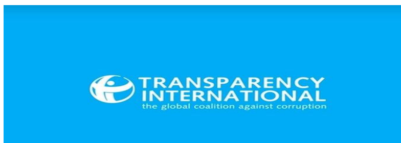
Slika 1. Logo Transparency International

Na slici 1. prikazan je logo Transparency International nevladine organizacije koja se bori za povećavanje transparentnosti rada institucija i za sprječavanje zlouporaba javnih ovlasti u privatne svrhe, a posvećena povećavanju odgovornosti i suzbijanju nacionalne korupcije.