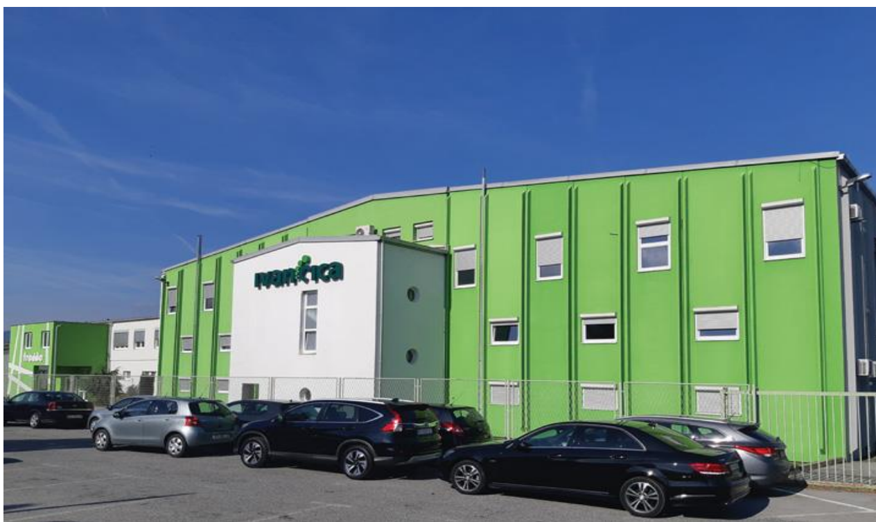
Slika 1. Tvornica Ivančica

Nagli razvoj počinje 1977. godine. Ivančica se seli na novu lokaciju, proširuju se kapaciteti, povećava se broj zaposlenih, provode se razne tadašnje samoupravne transformacije, prikazano na slici 1.