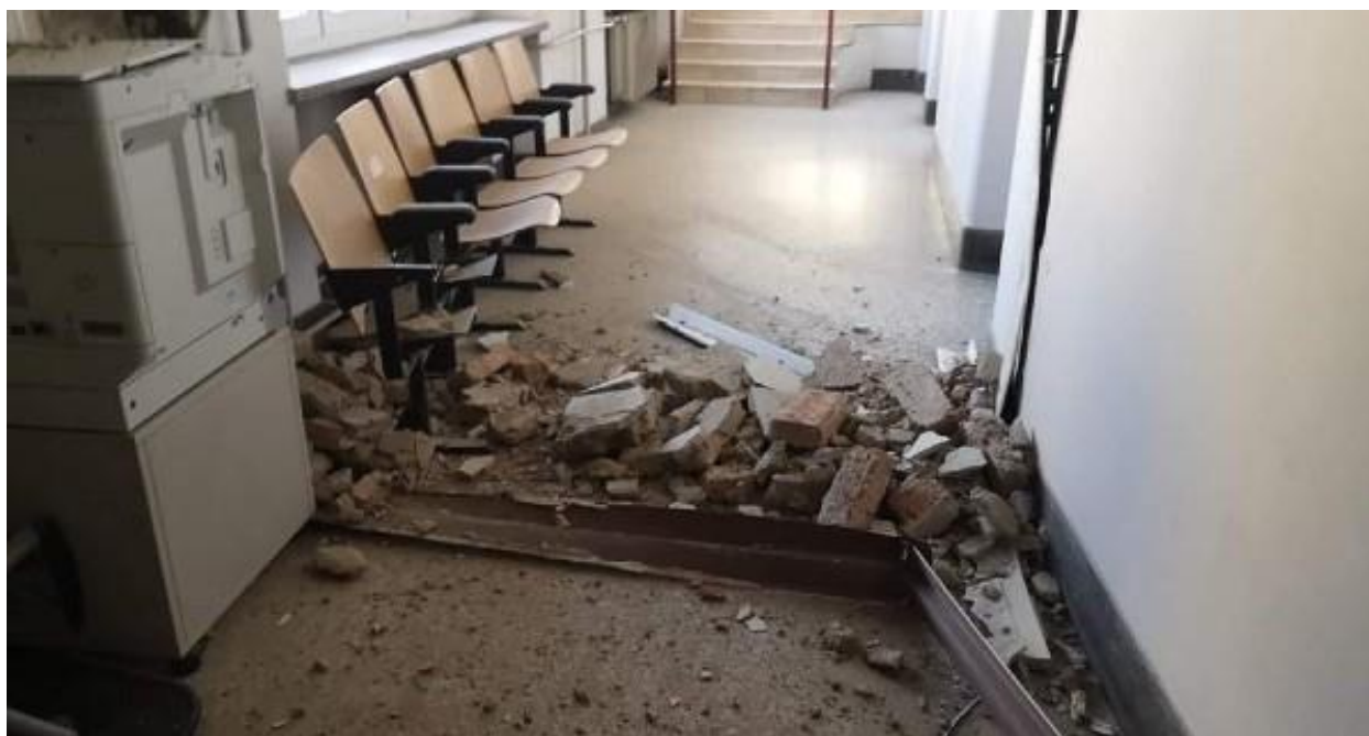
Slika 1: Ekonomski fakultet