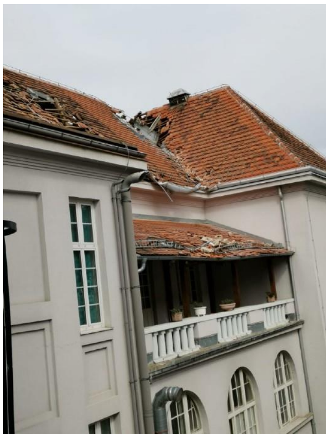
Slika 2: Medicinski fakultet