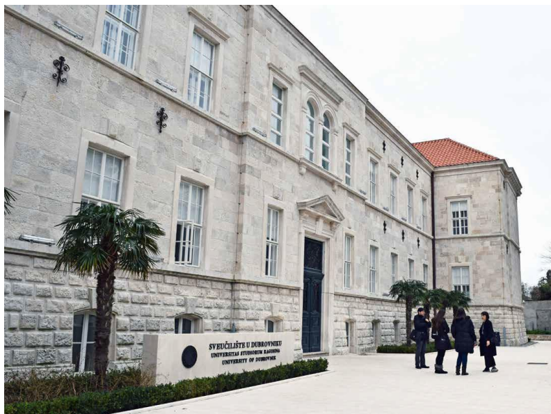
Slika 1: Zgrada Sveučilišta u Dubrovniku (sada)