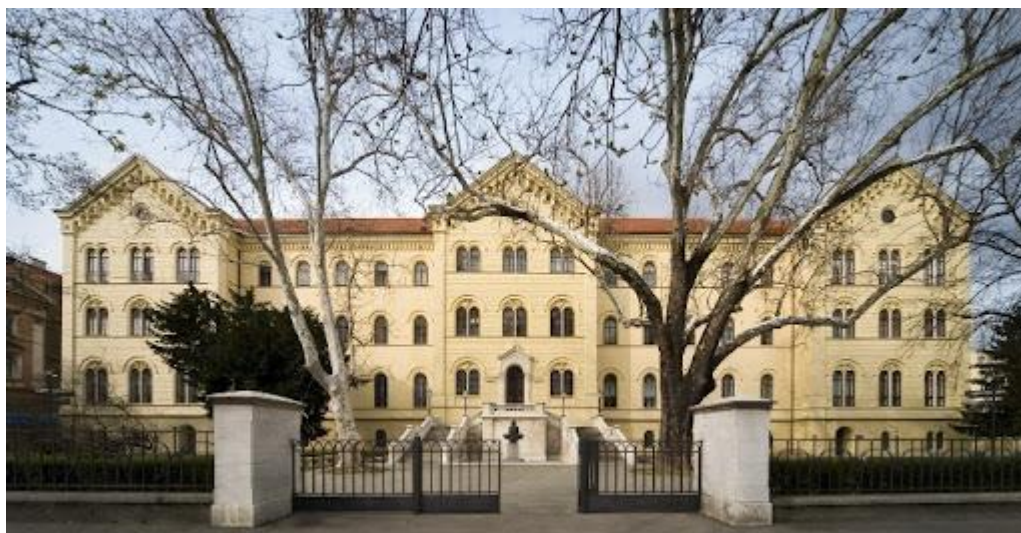
Slika 3: Zgrada Sveučilišta u Zagrebu