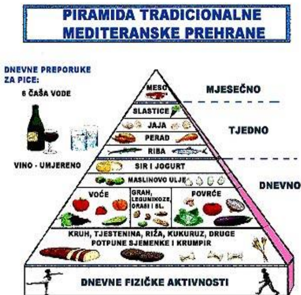
Slika 5.1.1 Piramida pravilne prehrane

smanjenjem rizika od nastanka depresije, moždanog udara i mentalnog propadanja koji je povezan sa starenjem“ [21]. Mlijeko i mliječni proizvodi su namirnice koje se preporučuju svakodnevno jer su dobar izvor bjelančevina te važni za očuvanje zdravlja kostiju i dobrobiti organizma poput vitamina D, vitamina A i B2, kalcija i fosfora. Bezmasni mliječni proizvodi su također u četvrtoj razini. Unos šećera nalazi se na uskom vrhu piramide, što znači da hrana i piće koji su bogati šećerom izvor su „praznih kalorija“ i obuhvaćaju malo hranjivih i esencijalnih tvari [21]. Njihov unos treba što više smanjiti i ograničiti (Slika 5.1.1).