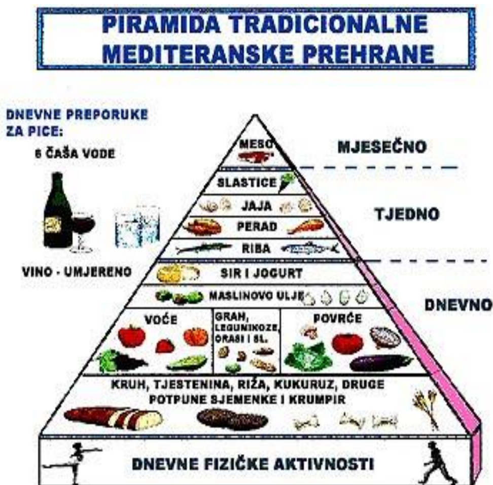
Slika 5.1.1 Piramida pravilne prehrane

smanjenjem rizika od nastanka depresije, moždanog udara i mentalnog propadanja koji je povezan sa starenjem“ [21]. Mlijeko i mliječni proizvodi su namirnice koje se preporučuju svakodnevno jer su dobar izvor bjelančevina te važni za očuvanje zdravlja kostiju i dobrobiti organizma poput vitamina D, vitamina A i B2, kalcija i fosfora. Bezmasni mliječni proizvodi su također u četvrtoj razini. Unos šećera nalazi se na uskom vrhu piramide, što znači da hrana i piće koji su bogati šećerom izvor su „praznih kalorija“ i obuhvaćaju malo hranjivih i esencijalnih tvari [21]. Njihov unos treba što više smanjiti i ograničiti (Slika 5.1.1).