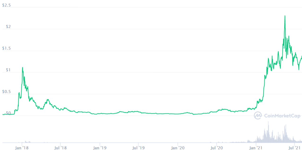
Slika 7. Kretanje cijena ADA, listopad 2017. - kolovoz 2021.

Razvoj Cardana zamišljen je kroz pet faza od kojih svaka dodaje novu značajku i unaprjeđuje sam projekt. Prva faza odnosi se na kreiranje arhitekture mreže i njezinih osnovnih funkcionalnosti, dok je druga faza bila posvećena ostvarivanju višeg stupnja decentralizacije. Trenutno se projekt nalazi u trećoj fazi koja je obilježena stvaranjem decentraliziranih aplikacija na Cardano mreži i razvojem vlastitog programskog jezika za razvoj pametnih ugovora. Četvrta faza biti će usmjerena na dodavanje rješenja kojima će se unaprijediti performanse i stabilnost mreže dok je za završnu fazu zamišljeno formiranje Cardana kao potpuno autonomne i decentralizirane mreže za koju neće biti odgovoran ni jedan centralizirani subjekt već će njezin daljnji razvoj i održavanje u potpunosti biti prepušteno zajednici ( www.coinmarketcap.com )