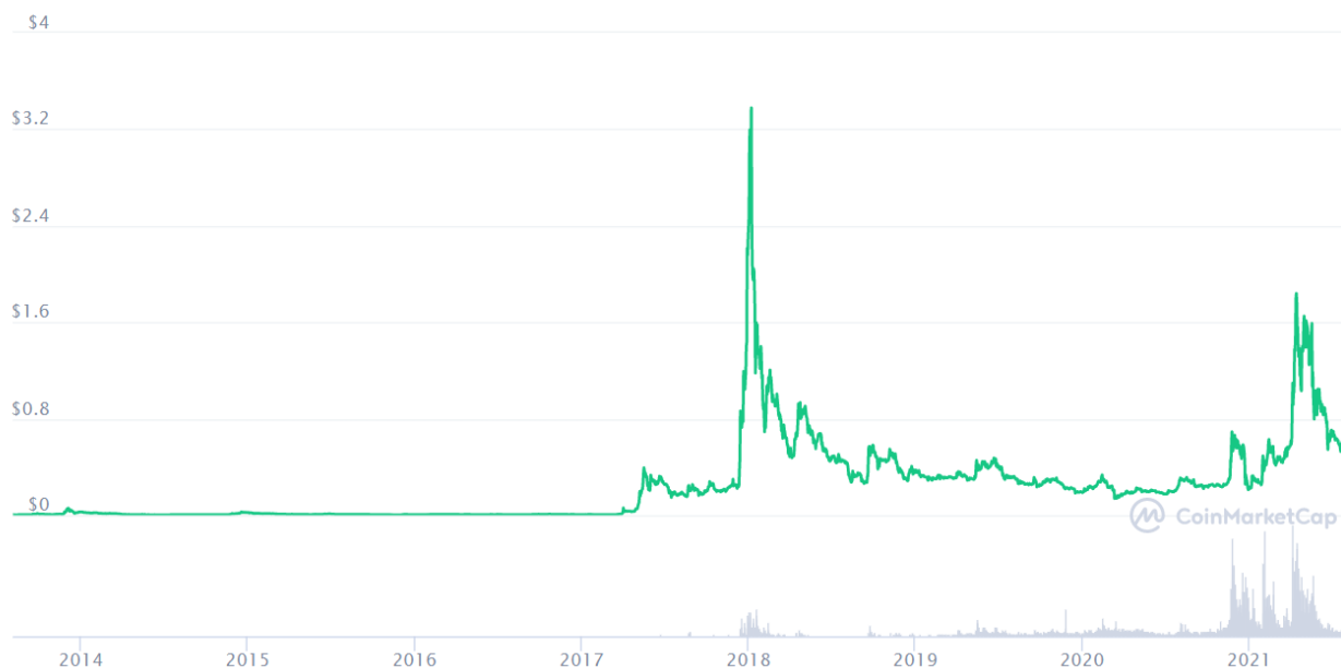
Slika 8. Kretanje cijene XRP, kolovoz 2013. - kolovoz 2021.