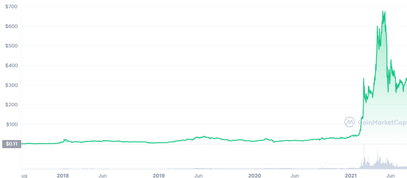
Slika 6. Kretanje cijena BNB, srpanj 2017. – kolovoz 2021.