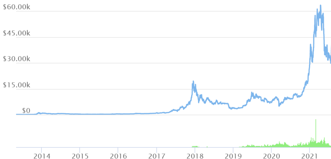
Slika 4. Kretanje cijena BTC, travanj 2013. - kolovoz 2021.