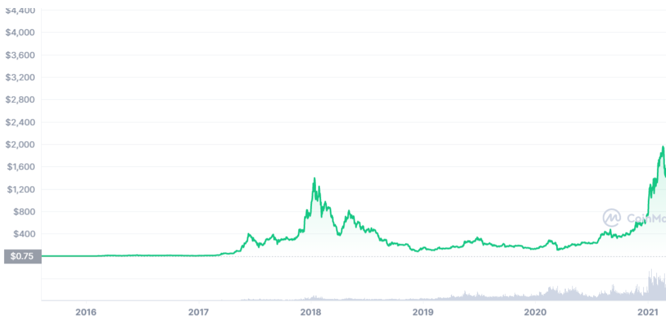
Slika 5. Kretanje cijena ETH, kolovoz 2015. – kolovoz 2021.

Ethereum, kao i Bitcoin, koristi PoW konsenzus algoritam za osiguravanje mreže, međutim tranzicijom na novi unaprijeđeni sustav, Ethereum 2.0, planira se i prelazak na ekonomičniji mehanizam Proof-of-Stake (PoS) ( www.coinmarketcap.com ).