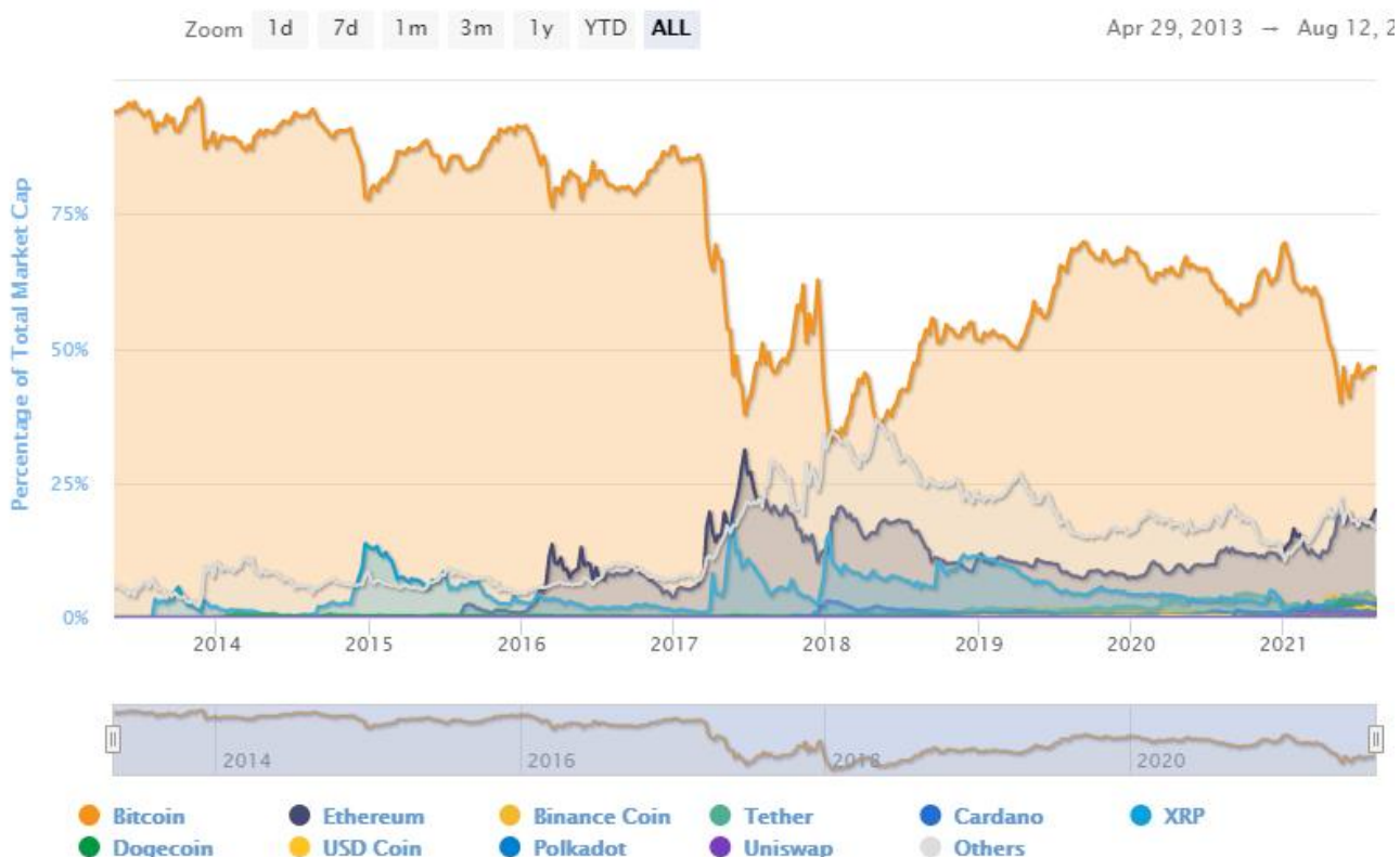
Slika 3. Postotak tržišne kapitalizacije pojedinih kriptovaluta

Bitcoin cijelo vrijeme uvjerljivo drži najveći dio ukupne vrijednosti kriptovaluta, trenutno njegova tržišna kapitalizacija iznosi 46.5 %. Povijesno gledajući značajniju kapitalizaciju osim Bitcoina ima Ethereum, a u posljednje vrijeme ukupna vrijednost Bitcoina u odnosu na druge kriptovalute se smanjuje te sve veći dio tržišta uz Ethereum preuzimaju XRP, Cardano, Binance Coin i Tether (Slika 3.) ( www.coinmarketcap.com ).