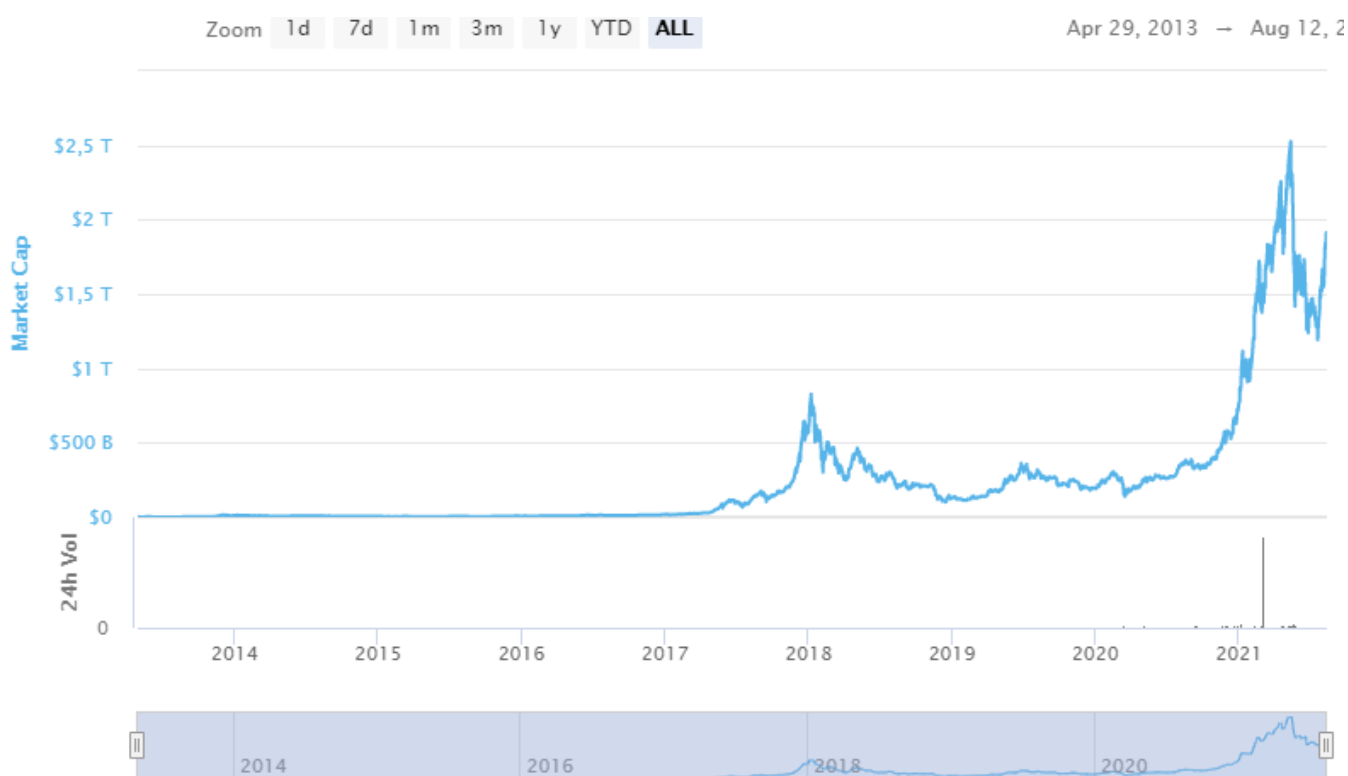
Slika 2. Ukupna tržišna kapitalizacija kriptovaluta

Trenutno se na kripto tržištu nalazi 11,225 kriptovaluta ukupne tržišne kapitalizacije više od 1.89 bilijuna USD, što je nešto niže od najvišeg iznosa ikad zabilježenog. Na Slici 2. vidljivo je kako je ukupna vrijednost svih kriptovaluta u razdoblju od 2013. do 2020. bila relativno stabilna, uz jedan značajniji rast vrijednosti 2018. godine dok je krajem 2020. tržišna kapitalizacija počela pokazivati intenzivnu stopu rasta. ( www.coinmarketcap.com ).