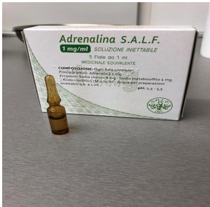
Slika 2.6.1. Ampula adrenalina (1 mg/ 1 ml)

3. Amiodaron – pripada III. Skupini antiaritmika, ali je kompleksnog mehanizma djelovanja te blokira kalijске, brze natrijske te kalcijске kanale, blokira alfa i beta adrenergičke receptore. Dovodi do produljenja akcijskog potencijala i refraktornog perioda, u određenoj mjeri usporava automatizam SA i AV- čvora, djeluje na glatku muskulaturu, smanjuje potrošnju kisika i srčanu frekvenciju. Blago smanjuje krvni tlak. Dolazi u obliku ampule od 150 mg/ 3ml. [5]