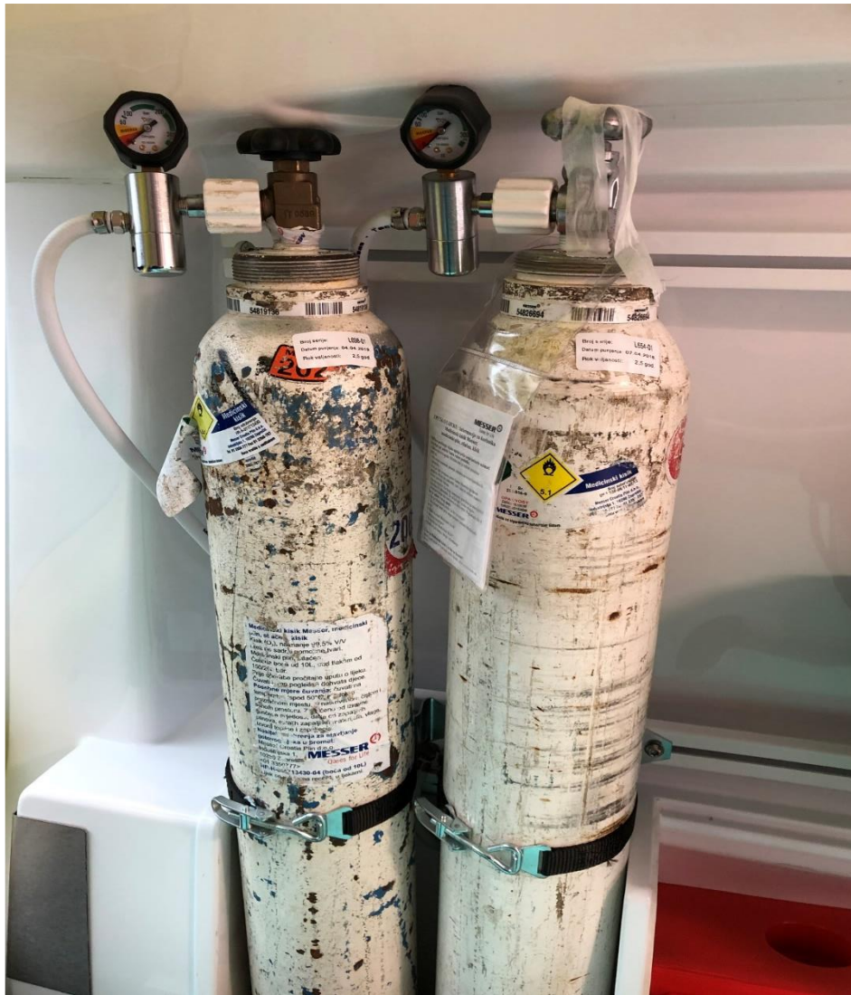
Slika 2.4.4. Fiksne boce za medicinski kisik u vozilu IHMS