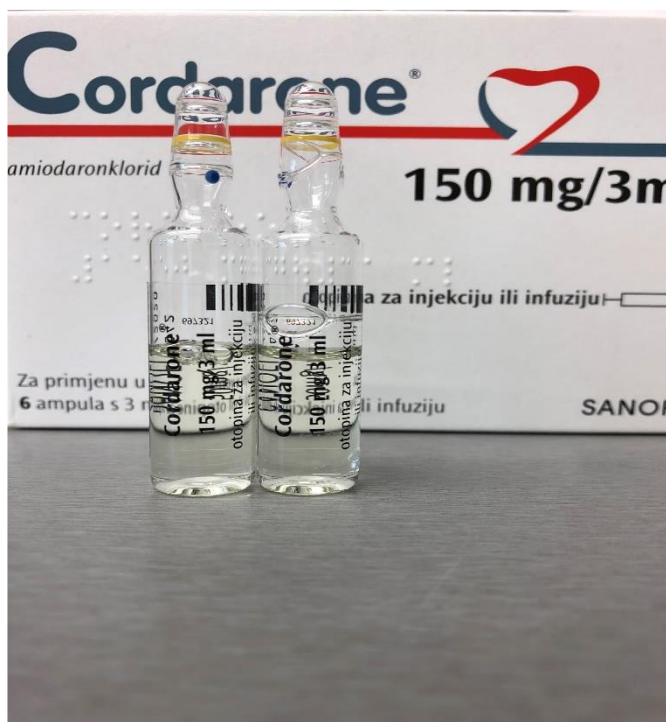
Slika 2.6.2. Dvije ampule amiodarona (150 mg/ 3 ml)

Glavne nuspojave – bradikardija, hipotenzija, alergija, pogoršanje aritmije i srčanog zatajivanja, upala periferne vene, bronhospazam. [5]