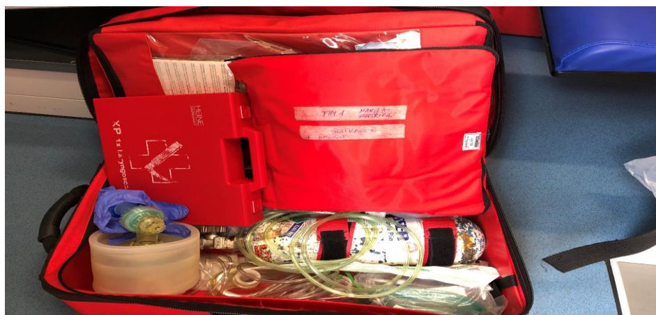
Slika 2.2.1. Torba za kardiopulmonalnu reanimaciju i ALS

Ukoliko tijekom prvog pregleda uočimo da se pacijent nalazi u stanju životne opasnosti, prioritet je samo brzo ABC zbrinjavanje, za takvog pacijenta vrijeme je presudno. [4]