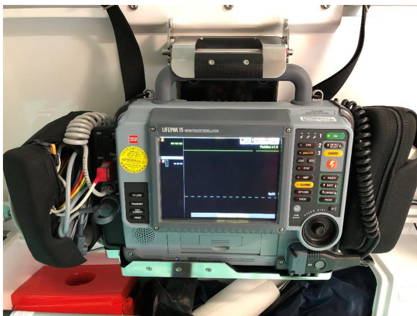
Slika 2.6.3. Defibrilator u vozilu IHMS

Asistolija – nastavljamo KPR i prelazimo na algoritam srčanih ritmova koje ne defibriliramo. P – val asistolija može odgovoriti na transkutanu vanjsku elektrostimulaciju. [4]