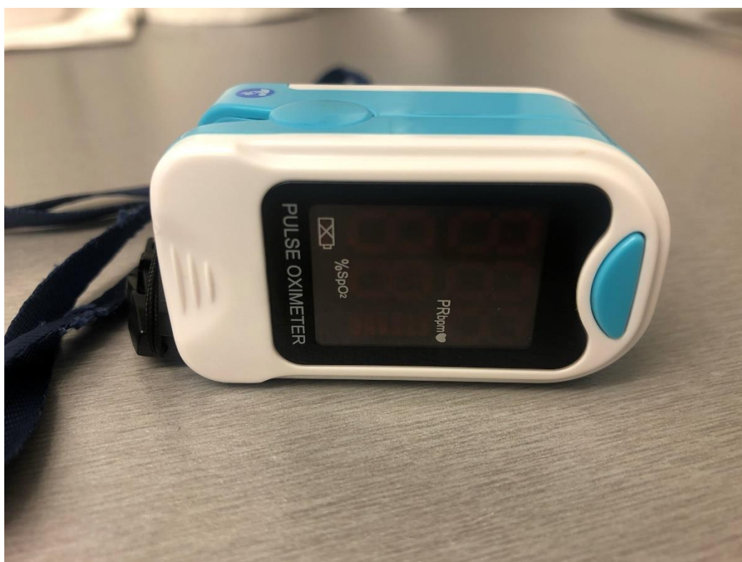
Slika 2.4.2. Pulsni oksimetar

monitorom te oni zajedno čine jedan uređaj. Senzor pulsno oksimetra stavimo na vršak jednog prsta na ruci, ali može i na nozi. Tada se uređaj uključuje i šalje u tkivo svjetlost različitih boja i prema količini vraćene svjetlosti izmjeri kolika je zasićenost krvi kisikom. Točnije uređaj je izmjerio koliki je postotak hemoglobina na koji se vezao kisik. Takvo mjerenje označujemo oznakom SpO 2 . Sp označuje perifernu saturaciju, a O 2 kisik. Neke druge molekule koje su se vezale za hemoglobin kao npr. ugljični monoksid mogu utjecati na mjerenje te uređaj u tome slučaju ne može dati pouzdane vrijednosti. O tome treba voditi računa. Kao normalna vrijednost zasićenosti krvi kisikom tretira se da SpO 2 mora biti minimalno 94% pa naviše. [6]