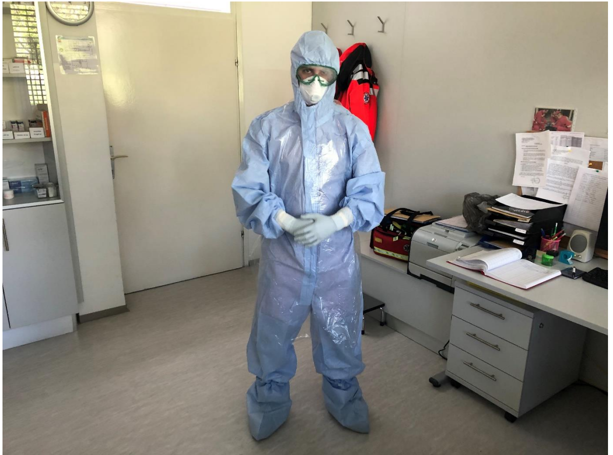
Slika 6.1. Medicinski djelatnik IHMS obučen u antivirusno odijelo