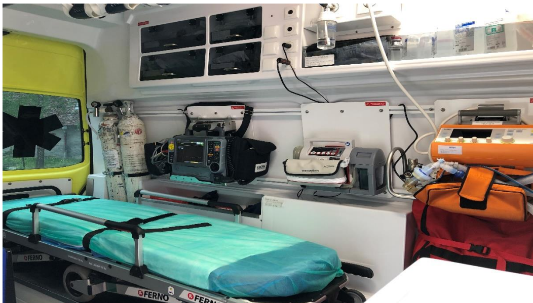
Slika 3.10.1. Unutrašnjost vozila IHMS