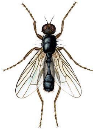
Slika 7.1. Štetnik sirna muha

Najčešći štetnici koji napadaju pršut su muhe. Muhe poliježu jaja na područjima reza i područjima sa zaostalom krvi (oko glave bedrene kosti, reza u skočnom zglobu). Iz jaja se ubrzo izlegnu ličinke koje prodiru u unutrašnjost pršuta, i gotovo ih je nemoguće vidjeti izvana već se one vide prilikom rezanja samog pršuta. Redovitim čišćenjem te postavljenjem mreža na prozore i otvore sprječava se ulazak muha u proizvodni pogon, a time ujedno i kvarenje pršuta [1].