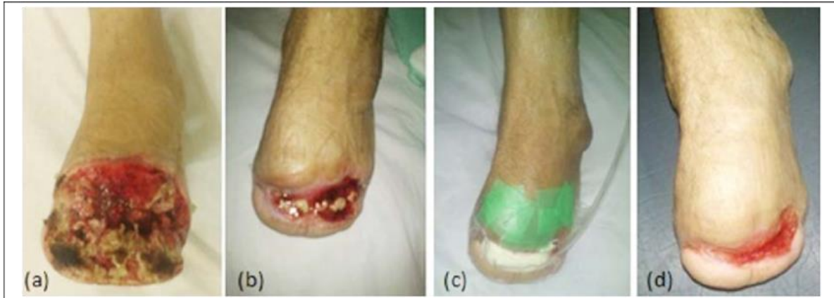
Slika 3.1.1. Primjer ponovne amputacije nakon poslijeoperacijske infekcije.

Infekcija bataljka poslije amputacije česta je pojava i može zahtijevati ponovnu amputaciju, što pacijenta dovodi u daljnje ozbiljne komplikacije (Slika 3.1.1.) [20].