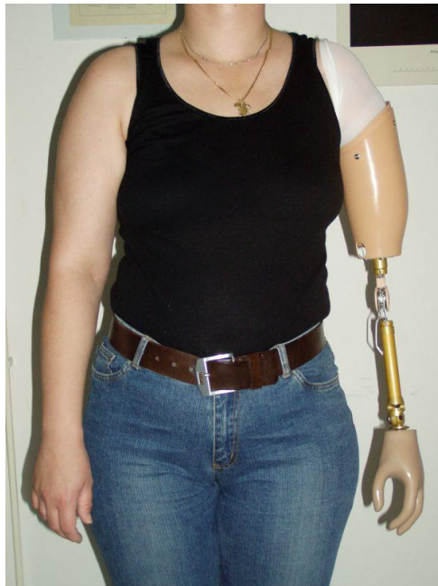
Slika 6.3.2.1. Primjer proteze za nadlakticu.

Pasivne proteze koriste se za kozmetičko poboljšanje, ali se mogu koristiti i za zadatke guranja ili povlačenja, stabiliziranje predmeta poput papira tijekom pisanja ili nošenje predmeta zakačenih za savijene prste. Proteze na tjelesni pogon koriste kabele, remenice i kuke. Sustav ovjesa modificiran je pojasom kako bi ga amputirani aktivirao preostalim pokretima zaostalog ili kontralateralnog uda. Proteze po mjeri rješavaju posebne ciljeve pojedinca u pogledu hobija, povratka obrazovanju, poslu i vožnji. To može uključivati posebno prilagođene terminalne uređaje za držanje alata, upravljača bicikla ili drugih uređaja (Slika 6.3.2.1.) [45].