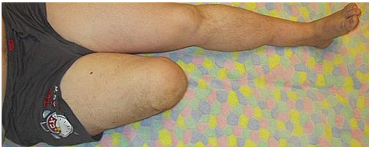
Slika 2.3.1. Primjer amputacije donjeg ekstremiteta kod dijabetesa.

Međutim, amputacije se provode i za niz drugih razloga, uključujući prirodni nedostatak udova, vaskularnu insuficijenciju, rak i traumatske ozljede. Iako se osobe s amputiranim udovima suočavaju s velikim tjelesnim, socijalnim i emocionalnim prilagodbama, prilagodba se među pojedincima jako razlikuje [17].