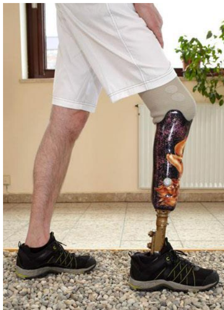
Slika 6.3.1.1. Potkoljena proteza.

Ručno upravljane brave za koljena razmotrit će se za vrlo krhke pacijente, koji će ponekad morati ručno zaključati koljeno (za oblačenje) ili pomoći u stabilnosti za određene aktivnosti gdje je potrebna maksimalna stabilnost. Poluautomatsko zaključavanje koljena koristi se u bolesnika sa slabom stabilnošću ili slabošću mišića na amputiranoj strani. Ovdje koljeno ostaje zaključano u produžetku tijekom hodanja, ali se može saviti kako bi pacijent mogao sjediti. Obje vrste koljena su lagane, što pomaže amputiranima s ograničenim mogućnostima hodanja (Slika 6.3.1.1.) [44].