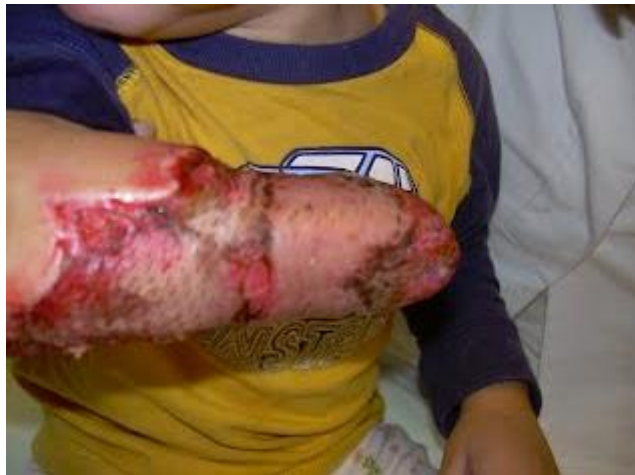
Slika 2.3.2. Primjer amputacije šake i dijela nadlaktice uz presađivanje kože.

Tipovi amputacija gornjih ekstremiteta prema razini dijele se na: transkapularnu amputaciju, odnosno uklanjanje cijele ruke; dezartikulaciju ramena; nadlaktičnu amputaciju ili transhumeralnu, odnosno uklanjanje ruke iznad lakta; dezartikulaciju lakta, odnosno uklanjanje cijele podlaktice do lakta; podlaktičnu amputaciju, odnosno transradijalnu; zatim radiokarpalnu dezartikulaciju, odnosno uklanjanje šake u ručnom zglobu; transkarplanu amputaciju; transfalangealnu amputaciju i amputacije pristiju [1].