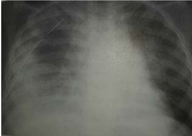
Slika 10.1.3 Pleuralni izljev [ Laura S.Inselman: Pediatric pulmonary pearls ]

Empijem je nalaz gnojnoga upalnoga eksudata u pleuralnome prostoru, uglavnom nastaje sekundarno u tijeku upalnih plućnih procesa, ali može nastati i iz drugih upalnih žarišta.