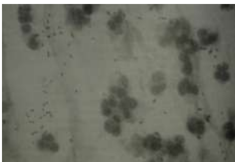
Slika 11.3.4 Gram-pozitivni pneumokoki u iskašljaju [Ilija Kuzman: Pneumonije , Zagreb, 1999.]

Sve uzorke treba pribaviti prije nego se započne liječenje antibioticima, ukoliko ima djelovanja antibiotika nalazi mikrobiološke pretrage su neadekvatni. Hemokulturu se preporučuje uzeti u sve febrilne djece jer imaju veliko dijagnostičko značenje ako su pozitivne.[1,2]