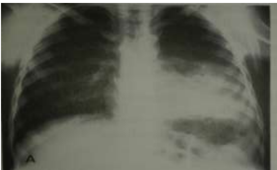
Slika 5.1 Bakterijska, pneumokokna pneumonia[Ilija Kuzman: Pneumonije, Zagreb, 1999.]

Bakterijske pneumonije, posebice, pneumokoknu karakterizira nagli nastup simptoma. Temperatura je umjereno povišena ili vrlo visoka, a u polovice bolesnika praćena tresavicom, redovito se pojavljuje i kašalj sa iskašljajem. Iskašljaj je gnojan, a nerijetko sadržava i primjese krvi. Relativno često je prisutna bol u prsima, pleuralni izljev i zaduha, a u teškim slučajevima i cijanoza. Probadanje i bol u prsima pojavljuje se u 50% bolesnika, a vrlo važni su simptomi za dijagnozu pneumonije i njezinu lokalizaciju. U nekih bolesnika nalaze se i simptomi gornjih dijelova dišnog sustava zahvaćenih upalom (hunjavica, promuklost, grlobolja...). U tim se upalama pluća, posebno u pneumokoknoj često pojavljuje i herpes na usnicama, prisutni su i opći simptomi infekcije. U težim pneumonijama, zbog pleuralne boli, zahvaćena strana zaostaje pri disanju. Bakterijska pneumonija se već u nastupu i tijekom bolesti puno češće kompliciraju od atipičnih, a najčešća komplikacija je pleuralni izljev.[2,3]