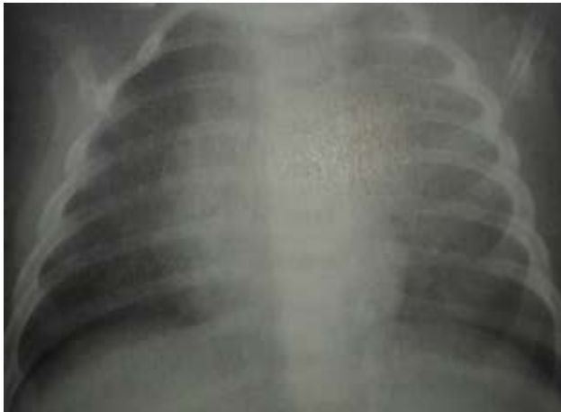
Slika 10.1.2. Pleuritis [Laura S.Inselman: Pediatric pulmonary pearls ]

Česta posljedica različitih upalnih i neupalnih intratorakalnih upalnih bolesti je pleuralni izljev, nakupljanje tekućine u pleuralnom prostoru. Pleuritis su samo izljevi koji su nastali kao posljedica upalnih procesa.[2]