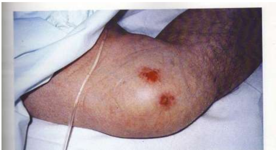
Slika 2.1. Stadij 1. Dekubitalnoga vrijeda na koljenu