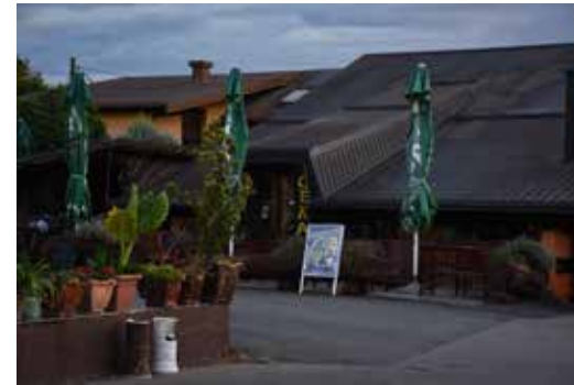
Caffe Bar Tennis ULICA FERDE LIVADIĆA 16