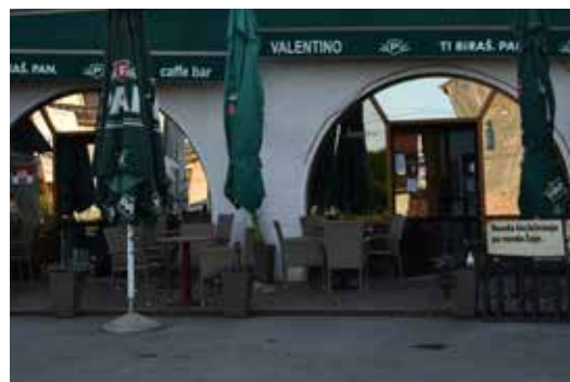
Caffe Bar Rachela OSJEČKA ULICA 41