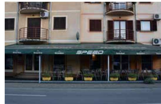
Retro Caffe JOSIPA JURJA STROSSMAYERA 4