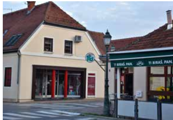
Caffe bar Asturias ULICA IVANA GUNDULIĆA 2