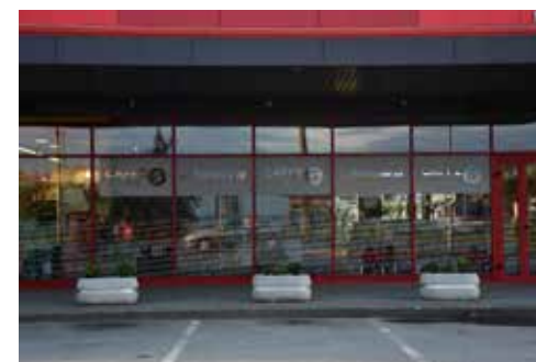
Caffe Bar Samo Fin ULICA ANDRIJE HEBRANGA 2B