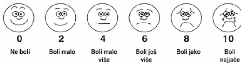
Slika 2.1.3. : Prikaz skale s licima [7]