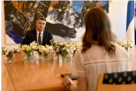
Slika 4.: sastanak na Pantovčaku