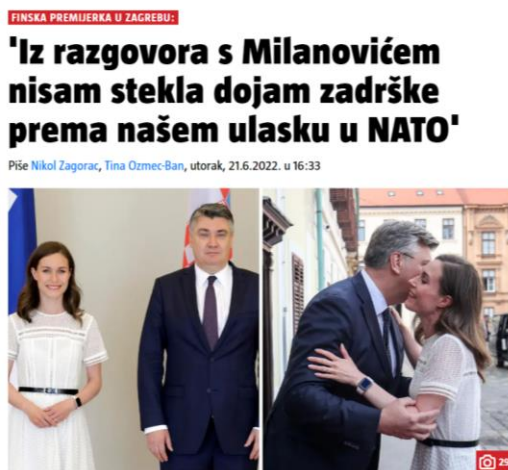
Slika 3.: Medijski natpisi

U priopćenju je također navedeno kako je prijem “odrađen prema jasnom, dugogodišnjem državnom protokolu kakav se uvijek primjenjivao i primjenjuje prilikom takvih posjeta”. Kako je prenio Jutarnji list, a iz Ureda PRH su pojasnili da su “jedina odstupanja od protokola bili: prvo, kašnjenje predsjednice finske Vlade koja je u Ured predsjednika Republike stigla gotovo pola sata kasnije nego što je bilo dogovoreno (a što je doista rijedak slučaj, ali se događa); i drugo, jedini put do sada dogodilo se da gost (finska premijerka danas) Predsjednika Republike nije pričekao na za to predviđenoj poziciji, ispred zastava, kao što su to učinili baš svi dosadašnji gosti u Uredu predsjednika Republike” ( https://www.jutarnji.hr/vijesti/hrvatska/nije-istina-da-je-milanovic-kasnio-zakasnila-je-finska-premierka-i-to-cak-pola-sata-i-nije-ga-cekala-na-predvidenom-mjestu-15213267 ). Osim navedenih propusta u protokolu, službeni doček i predstavljanje izaslanstava, fotografiranje kao i sastanak bili su odrađeni prema uobičajenoj praksi.