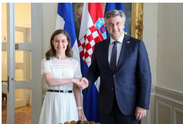
Slika: finska premijerka i hrvatski premijer

Sjeverne Makedonije tijekom svoje "Balkanske turneje". Hrvatski premijer Plenković izrazio je zadovoljstvo da je s finskom premijerkom raspravio bilateralne odnose, da su razgovarali o pripremama za predstojeće Europsko vijeće te da su razgovarali o njenim dojmovima nakon posjeta nekoliko država jugoistoka Europe. Plenković je također naglasio da je bilo lijepo čuti snažnu potporu Finske u europodručju i schengenskom prostoru. Jedna od glavnih tema bio je i rat u Ukrajini, što se odražava na cijenu energenata, ali i moguću nestašicu žitarica što bi posljedično dovelo do rasta cijena hrane. Premijer Plenković je jasno naglasio da je Hrvatska čula "želju Finske da žele, napuštajući politiku neutralnosti, postati članica NATO-a jer u ovakvim okolnostima NATO je sigurnosni kišobran" (vlada.hr), nadalje je istaknuo da to Hrvatska jako dobro razumije i pozicija hrvatske Vlade je da podržava te ambicije. Ako je to izbor zemlje koja je nama partner, onda je na nama to podržati" ( https://direktno.hr/direkt/video-plenkovic-s-marin-bilo-lijepo-cuti-snaznu-potporu-finske-hrvatskoj-277144/ ).