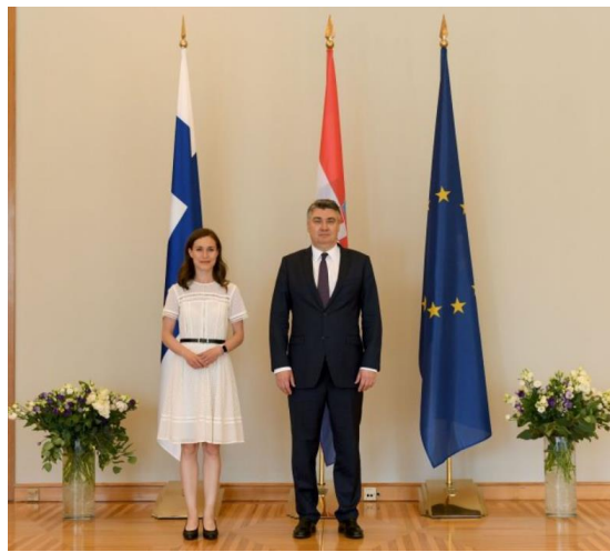
Slika 1: finska premijerka i predsjednik RH

Hrvata u toj državi posebno važni za Hrvatsku te je rekao kako od partnera iz EU, uključujući Finsku, očekuje više razumijevanja i podrške za interese Hrvatske jer je međusobna podrška smisao savezništva kako u EU, tako i u NATO-u. Hrvatski predsjednik je naglasio kako već neko vrijeme inzistira da se pokaže zeleno svjetlo Finskoj i Švedskoj, koje su aplicirale za NATO kao odgovor na rusku invaziju Ukrajine koja je počela 24. veljače 2022. godine.