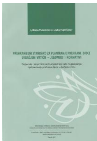
Slika 2. Prehrambeni standard za planiranje prehrane djece u dječjem vrtiću - jelovnici i normativi

specifične bolesti poput celijakije ili dijabetesa). U suradnji s glavnim kuharom planira nabavu namirnica, odgovara za kvalitetu i kvantitetu prehrane, mikrobiološku ispravnost hrane te prati i valorizira kako djeca prihvaćaju određene obroke. Mnoga su djeca upravo u predškolskim ustanovama u društvu druge djece i odgojitelja kušala mnoga jela i namirnice koja kod kuće nisu imala prilike ili želje kušati. Na formiranje zdravih navika i odnosa prema vlastitom tijelu i drugim ljudskim bićima utječe okruženje u kojem djeca svakodnevno žive. Stoga posebnu odgovornost odraslih i mnoge mogućnosti za pravilan i cjelovit rast i razvoj djece rane dobi vidim upravo u kvalitetno osmišljenim programima i okruženju u predškolskim ustanovama.