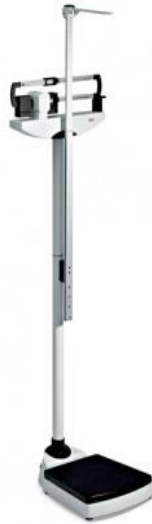
Slika 3. Mehanička vaga s visinomjerom

Prema tim podacima izračunava se indeks relativne mase. Indeks tjelesne mase tijela je posebno koristan u ocjeni prehrambenog statusa. Zdravstvenom voditelju može biti pokazatelj mogućih stanja: smanjena relativna masa uz normalnu visinu pokazuje sadašnju pothranjenost, relativna masa u granicama normale, a smanjena visina pokazuje na pothranjenost koja je utjecala na rast djeteta prije, smanjena masa uz smanjenu visinu govori o kroničnoj pothranjenosti [39].