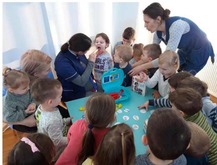
Slika 2. Zdravstveni voditelj u ustanovi ranog i predškolskog obrazovanja

U prvom planu bavljenjem fizičkim aktivnostima i objedovanjem dolazi se u stanje jedne inačice prisnog odnosa s drugim osobama, razvijaju se prijateljstva, uče se i razvijaju socijalne vještine. Zdravstveni voditelj u ustanovi ranog i predškolskog obrazovanja poduzima niz aktivnosti i kontrola različitih segmenata rada ostalih djelatnika kako bi se učinilo što je više moguće u ostvarivanju ranije spomenutog blagostanja kod svakog pojedinog djeteta.