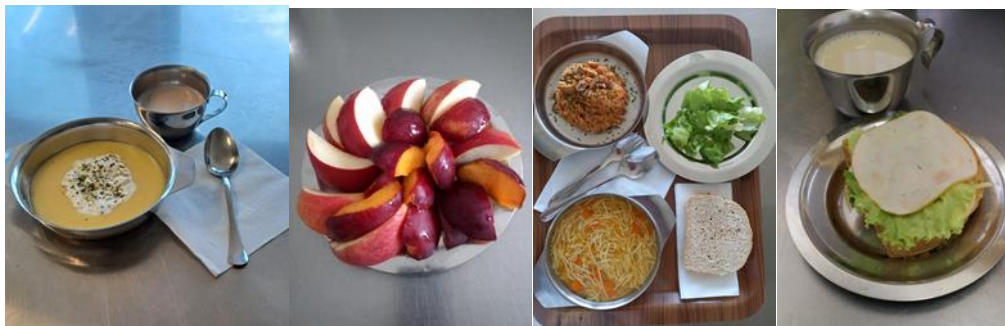
Slika 1. Prikaz doručka, jutarnje užine, ručka i popodnevne užine u „Dječjem vrtiću Varaždin“

Hipoteza 3 koja glasi „Odgajitelji i roditelji smatraju da kultura prezentiranja hrane utječe na prehrambene navike djece“ je dokazana obzirom da 78,3% odgajatelja i 67,3% roditelja smatra da je način serviranja hrane u vrtiću važan u samom prihvaćanju hrane (način na koji odgojitelj servira hranu prilikom obroka), te 80,4% odgajatelja i 64,1% roditelja smatra da je izgled hrane djeci u vrtiću presudan u konzumiranju hrane.