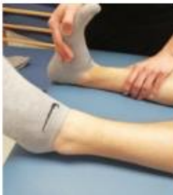
Slika 13. Prikaz dorzalne fleksije uz pomoć terapeuta

Vježba 3. Pacijent leži na leđima, terapeut jednom rukom pritišće potkoljenicu na podlogu, a drugom rukom obuhvaća stopalo s unutarnje strane te stopalo savija prema gore (Slika 13.).