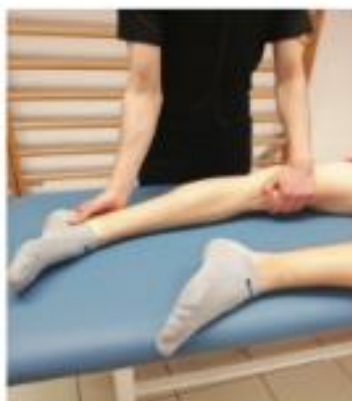
Slika 18. Prika ekstenzije koljena

Vježba 5. Položaj je isti, izvodi pokret ekstenzije, terapeut jednom rukom pridržiava nogu u području pete a drugom pridržiava koljeno (Slika 18.).