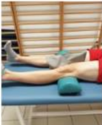
Slika 9. Prikaz statičke vježbe za natkoljenicu