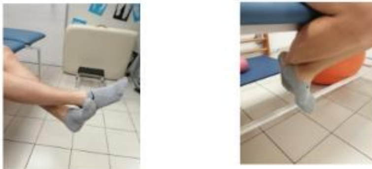
Slika 19. Prikaz ekstenzije i fleksije koljena uz samostalnu pomoć pacijenta

Vježba 6. Pacijent je u sjedećem položaju s flektiranim koljenima koje vise s terapeuskog stola. Pacijent si potpomaže zdravom nogom pri pokretu fleksije i ekstenzije. Kad ide u ekstenziju, zdravom nogom si potpomogne tako da ju gura prema gore, a prilikom fleksije, zdrava noga je na drugoj nozi i pokušava što više savinuti nogu u koljenu (Slika 19.).