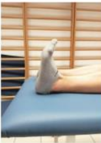
Slika 1. Prikazuje dorzalnu fleksiju

Vježba 1. Pacijent leži na leđima, ruke su uz tijelo, te stopala povlači prema sebi i od sebe (Slika 1.). (Dorzalna fleksija)