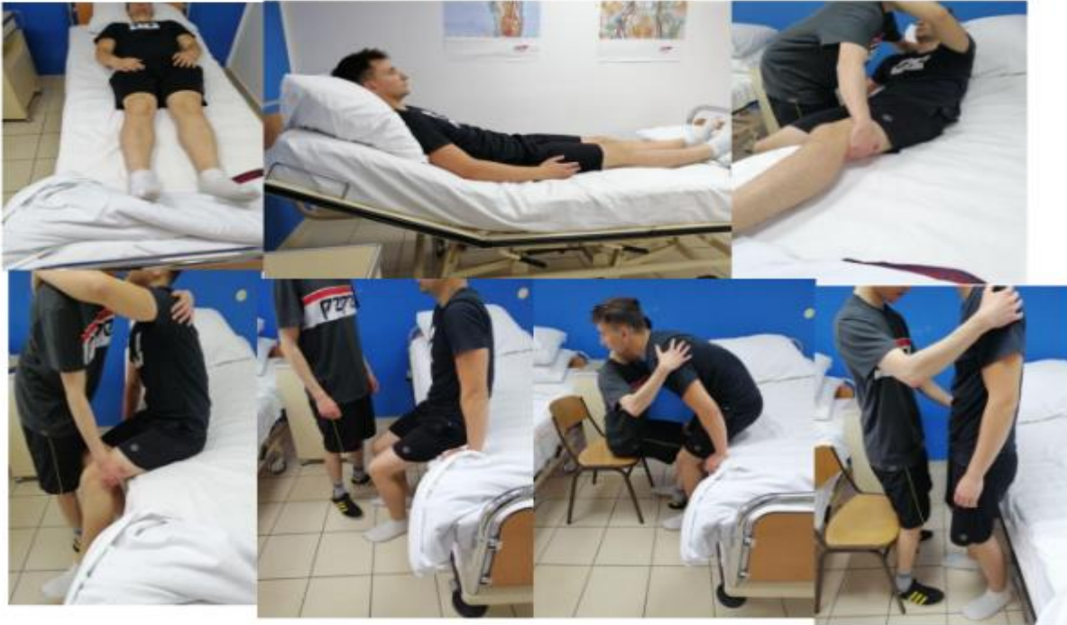
Slika 23. Prikaz vertikalizacije pacijenta