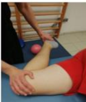
Slika 17. Prikaz fleksije koljena

Vježba 4. Pacijent leži na bolesnom kuku, a radimo zdravi kuk i izvodi pokret fleksije, terapeut jednom rukom pridržiava nogu na stopalu, a drugom rukom pridržiava koljeno. (Slika 17.)