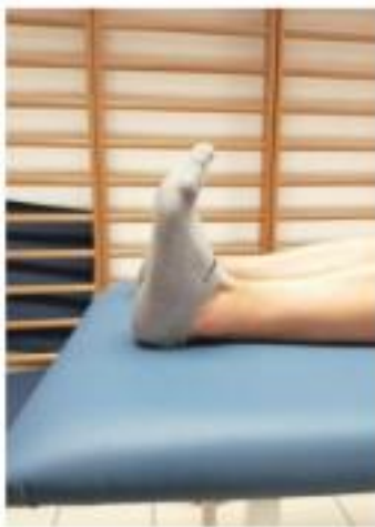
Slika 1. Prikazuje dorzalnu fleksiju

Vježba 1. Pacijent leži na leđima, ruke su uz tijelo, te stopala povlači prema sebi i od sebe (Slika 1.). (Dorzalna fleksija)