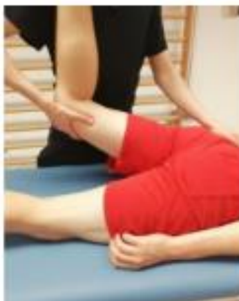
Slika 11. Prikaz ekstenzije u kuku uz flektirano koljeno

Vježba 1. Pacijent leži na leđima, terapeut jednom rukom pritisne stražnjicu na onoj strani na kojoj će istežati fleksore, a drugu ruku postavi na koljeno. Podiže se natkoljenica prema stropu. Vježba se izvodi bez sudjelovanja pacijenta (Slika 11.).