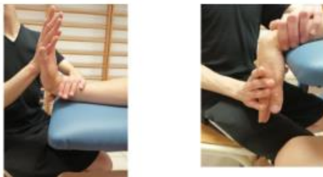
Slika 7. Prikaz palmarne i dorzalne fleksije