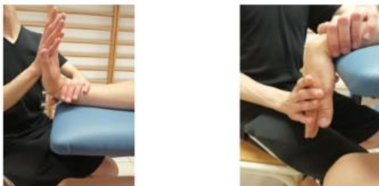
Slika 20. Prikaz palmarne i dorzalne fleksije

Vježba 7. Pacijent sjedi uz terapeuski stol i šaka mu visi za stola tako da ima više mjesta za izvođenje pokreta. Pacijent izvodi pokret dorzalne fleksije i palmarne fleksije, terapeut jednom rukom stabilizira distalni dio podlaktice (iznad ručnog zgloba), a drugom potpomaže pokretu. Pacijent gura šaku prema dolje i prema gore (Slika 20.).