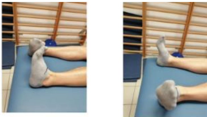
Slika 3. Prikazuje pokret inverzije i everzije

Vježba 3. Pacijent leži na leđima, ruke su uz tijelo, okreće stopala prema nutra i prema van ( Inverzija i everzija) ( Slika 3.).