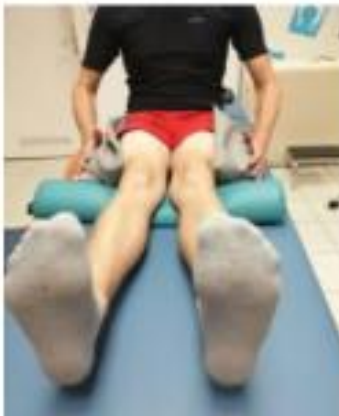
Slika 10. Prikaz statičke vježbe uz dodatan otpor

Vježba 3. Položaj je isti, podložak se stavlja ispod koljena i s vanjske, odnosno lateralne strane natkoljenice bolesne noge. Stopala zategnuti prema sebi, koljena gurati o podlogu, napeti natkoljene mišiće te mišiće trbuha. Natkoljenicu usmjeriti prema podlošku koji predstavlja otpor (Slika 10.).