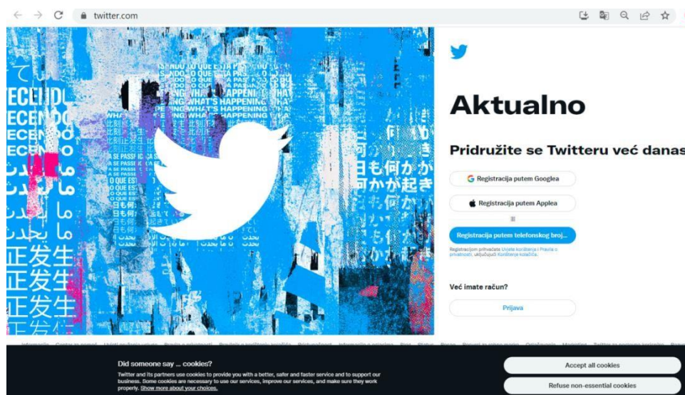
Slika 2. Twitter registracija ili prijava

Twitter je popularna usluga mikroblogiranja koja korisnicima omogućuje slanje poruka do 140 znakova, koje se nazivaju tweetovi , grupama slušatelja, nazvanih sljedbenici. Na sljedećoj slici prikazan je izgled mrežne stranice za registraciju ili prijavu na Twitter .