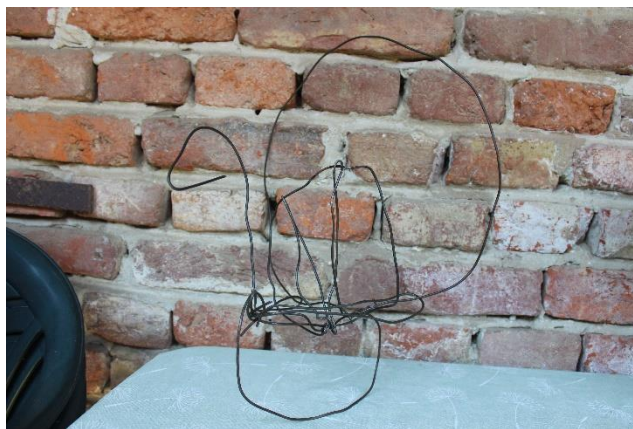
Slika 15 Prvi okvir pauna

Materijal koji sam odabrala kod korištenja za izradu skulpture je bio skoro 80 % reciklirani materijal. Koristila sam žicu koju sam pronašla doma koju nitko nije koristio za prvi dio kostura kod skulpture, te sam zatim kupila pletivu žicu koju sam koristila kao plašt kod prvog dijela postave za podlogu na kojoj će se lakše držati staklo. Izvijala sam žicu u željeni oblik te sam zatim počela rezati komade pletene žice i omatati prvi dio da dobijem čvršću strukturu na kojoj će se držati bolje silikon i staklo.