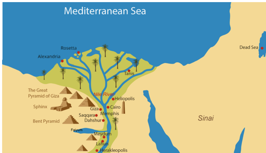
Slika 3 Karta Egipta

Skupina staklenih posuda koja se je jako isticala zbog svog posebnog stila ukrašavanja je bila ona u Židovskoj tradiciji. Koristili su zlatne listića koje su oblikovali u židovske simbole koje su uvukli između dva sloja staklenih medaljona. Taj se proces često brkao sa pozlatom ali Zlato je pokriveno te to nije pozlata. Takvih medaljona ima još 10 u svijetu možda, prvi je pronađen 1882. Godine u katakombi Svetog Petra, sad se nalazi u Vatikanskom muzeju.