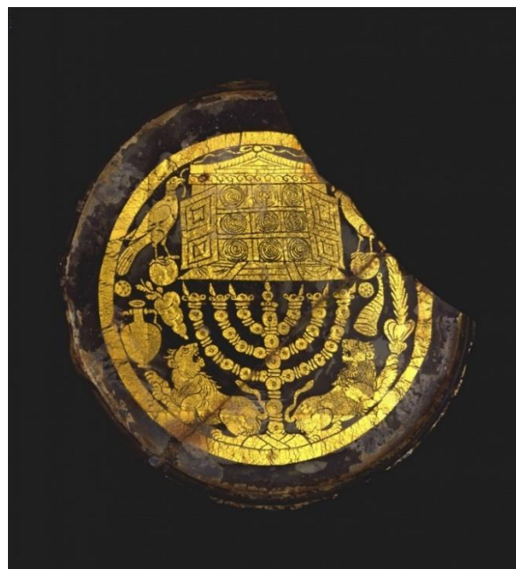
Slika 4 Židovski medaljon

Skupina staklenih posuda koja se je jako isticala zbog svog posebnog stila ukrašavanja je bila ona u Židovskoj tradiciji. Koristili su zlatne listića koje su oblikovali u židovske simbole koje su uvukli između dva sloja staklenih medaljona. Taj se proces često brkao sa pozlatom ali Zlato je pokriveno te to nije pozlata. Takvih medaljona ima još 10 u svijetu možda, prvi je pronađen 1882. Godine u katakombi Svetog Petra, sad se nalazi u Vatikanskom muzeju.