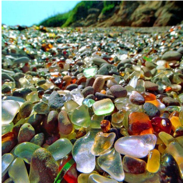
Slika 21 Staklena plaža