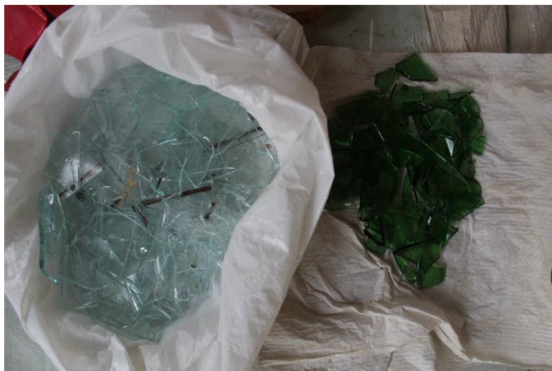
Slika 18 Komadići stakla

Noge sam napravila od debele željezne šipke koju sam pronašla doma, odrezala sa određenu dužinu sa kutnom brusilicom te sam ju izvijala da sam ju stavila u tijelo na taj način da je dio također u repu te drži ravnotežu, ide do pola tijela i spušta se u noge. Zatim sam se bacila u potragu za daskom koju sam pronašla u štali i bila je savršene dimenzije za postolje pauna te