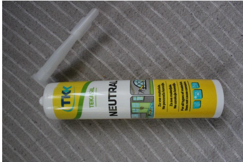
Slika 17 Silikon

Zatim sam koristila stara prozorska stakla te ih razbijala i koristila komadiće za tijelo, vrat, glavu, noge i rep. Također sam razbila pivske boce za dojam zelene boje koje sam dodala na tijelo i rep. Staklo sam ljepila na pletenu žicu sa silikonom.