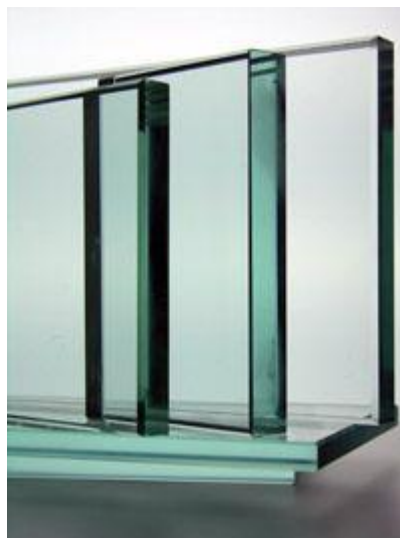
Slika 9 Ravno staklo

Ravno staklo se dobiva izvlačenjem ili valjanjem. Tehnikom izvlačenje se rade najviše prozorska stakla. Imamo 3 tehnike izvlačenja stakla Fourcaultov postupak, postupak Pittsburgh i postupak Libey-Owens. Fourcaultov postupak se izvodi tako što se izvlačenje dobiva kroz usku i dugačku mlaznicu koja pliva na talini. Pittsburghov postupak se izvodi uspravno sa površine taline iz komore iz koje se izvlači masa s mostom koji lebdi ili visi. Libey-Owensov postupak se izvodi također upravo kao i prošli postupak, sa površine taline koje na visini od 60 do 70 mora proći u horizontalno stanje.