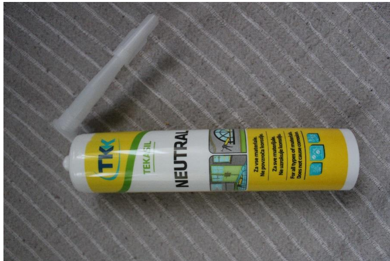
Slika 17 Silikon

Zatim sam koristila stara prozorska stakla te ih razbijala i koristila komadiće za tijelo, vrat, glavu, noge i rep. Također sam razbila pivske boce za dojam zelene boje koje sam dodala na tijelo i rep. Staklo sam ljepila na pletenu žicu sa silikonom.