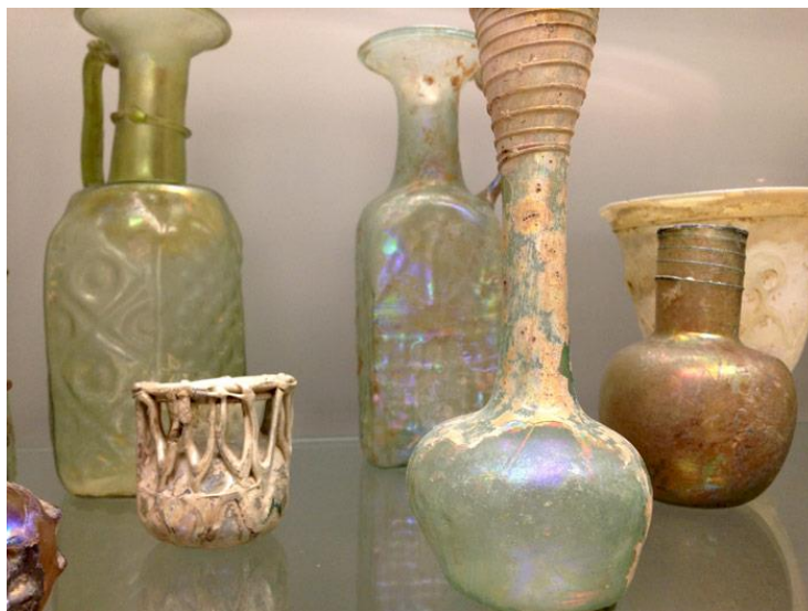
Slika 2 Prve tvorevine od stakla

Najpoznatije stvari koje se je tu to doba radila od stakla bile su staklene posude i posudice, amuleti, perle i skarabeji.