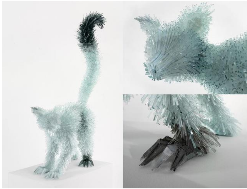
Slika 14 Skulptura od lomljenog stakla