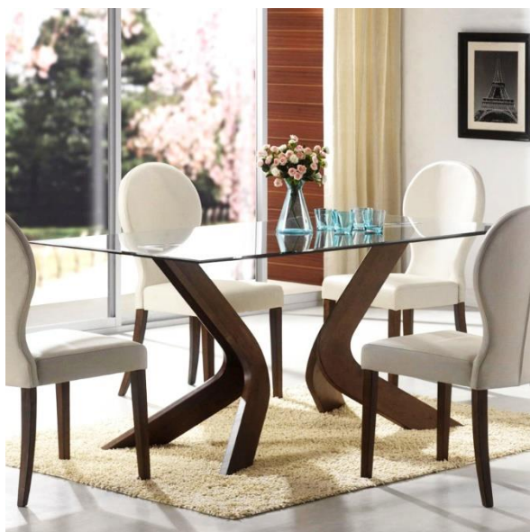
Slika 20 Staklo u našem domu

Staklo je postalo jako bina sastavnica današnjice te se koristi skoro u svakom drugom predmetu koje posjedujete kod kuće ili u skoro svakoj prostoji kada pogledate oko sebe i postanete svjesni njegove postojanosti i koliko smo zapravo okruženi sa njime. Od staklenih boca u trgovinama, stakla na autima i prozora na kući do staklenih čaša koje skoro svaka kuća ima. Ali jedini problem kod stakla je taj što je teško razgrađivo i prirodi je to najgori problem, ali priroda je sama našla jedan način kako da otpad od stakla pretvori u nešto magično nešto što oduzima dah i čini se natprirodno.