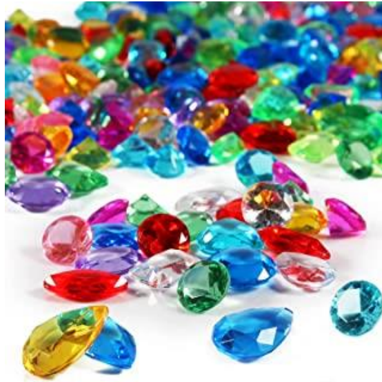
Slika 5 Staklo koje izgleda kao dragi kamen

Danas se staklo puno koristi u graditeljskoj struci, ljudi su kroz godine probali sve i svašta pogotovo kod gradnje, staklo se više ne koristi samo za prozore već se od njega grade cijele kuće, veliki stakleni zidovi koji omogućavaju više svjetla, svako prijevozno sredstvo na sebi ima minimalno 3 prozora. Staklo je postalo jako bitni dio naših života.