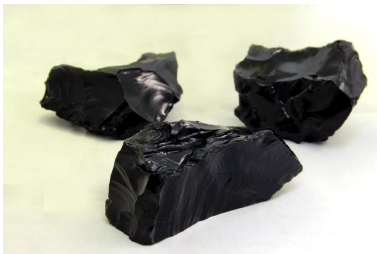
Slika 1 Opsidijan

Jedan od bitnih sastavnica početaka stakla je opsidijan, vulkansko staklo. Ljudi su ga mnogo koristili u izradi noževa, posuda, nakita, novaca uglavnom bitnih predmeta kojima je trebalo sjaja i čvrstine. Ali ljudi nisu stali na opsidijanu tražili su savršenstvo tražili su spoj koji bi im pružio ono više. Kao što svako dobro jelo ima recept tako i postoji i prvi recept kako napraviti staklo.