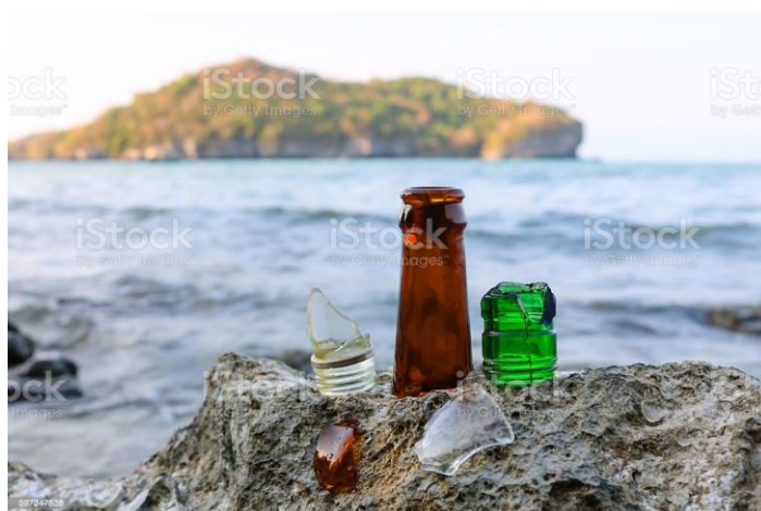
Slika 6 Staklo u oceanima

Kako se danas borimo za očuvanjem okoliša, globalnim zatopljenjem razno raznim problemima i poteškoćama jer u svijetu je sve više otpada koji ljudi bacaju i zagađuju okoliš. Staklo je jedan od materijala gdje bi ljude trebalo osvijestiti, “Što više recikliraj, ne bacaj”. Razlog tome je jer staklu u prirodi treba preko milijun godina da se razgradi, a u moru se uopće ne razgrađuje. Do sad je provjereno da se oko 60% stakla reciklira no i dalje to nije dovoljno jer 40% i dalje se baca u prirodu i mora. Najljepši fenomen koji se je dogodio bacanjem stakla u oceane je Staklena plaža koje ćemo se dotaknuti malo kasnije.