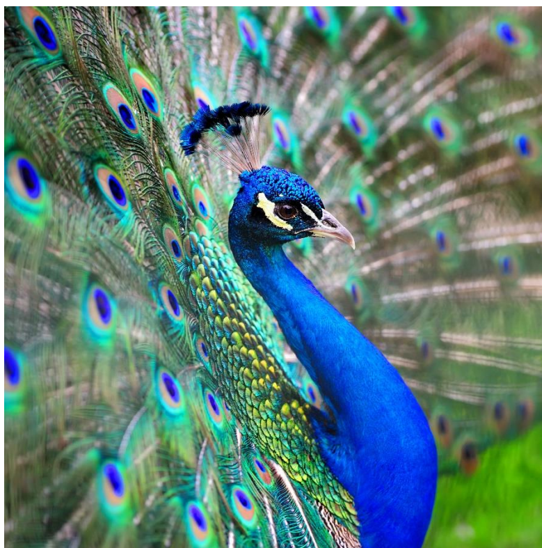
Slika 11 Paun

Paun dolazi iz porodice kokoši te se mužjak i ženka razlikuju po izgledu. Mužjak prekriven modrim i sjajnim perjem od tamno zelene do tamno plave, a perje na repu ima tamne pjege koje kada raširi svoj rep izgledaju kao oči. Paunovo perje kada raširi rep može doseći širinu do 1,5 metara. Tim načinom širenja repa i kratkim plesom mužjak zavodi ženku pauna. Ženka pauna je malo manja i najčešće je zelenkasto smeđe boje. Ženka liježe od 6 do 8 jaja i sjedi na njima do 28 dana. Što se tiče prehrane jedu komadiće voća i sitne kukce. Prirodno stanište im je najčešće šuma, a što se tiče mjesta u svijetu gdje ih najviše ima su Šri-Lanka, Pakistan i Indija. Ali je već udomaćen po cijelom svijetu.