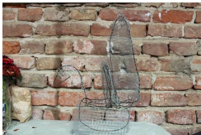
Slika 16 Drugi okvir pauna