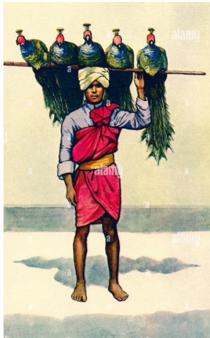
Slika 12 Paun u Indiji

Knjiga Povijest životinja koja je napisana 1812. Godine također se spominje kako su paunovi toliko lijepi da ih se ne smije dirati ili uznemiravati. “Još u Salomonovo vrijeme, ove su elegantne ptice bile uvezene u Palestinu. Kada je Aleksandar bio u Indiji, našao ih je u ogromnom broju na obalama rijeke Hyarotis i bio je toliko zadivljen njihovom ljepotom da je zabranio bilo kome da ih ubija ili uznemirava.” (12)