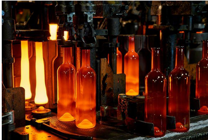
Slika 10 izrada staklenih boca