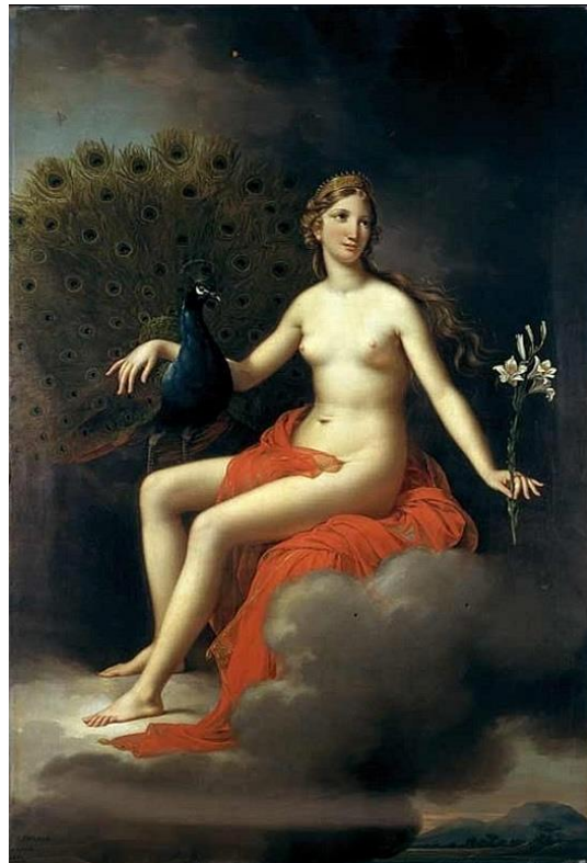
Slika 13 Slika Pauna iz 19. stoljeća

Pred kraj 19. Stoljeća polako su se praznile glave ljudi sa praznovjerjima i zabludama, paun je bio ukras mnogih pašnjaka i livada i zoološkog vrta za njega nisu trebale ograde ili nešto što bi ga držalo da ne pobjegne bio je mirna životinja koja je lagano šetala okolo i spavala po granama i šepurila se i čekala samo da joj se drugi ljudi dive bio je više kao ukras nego nešto korisno.