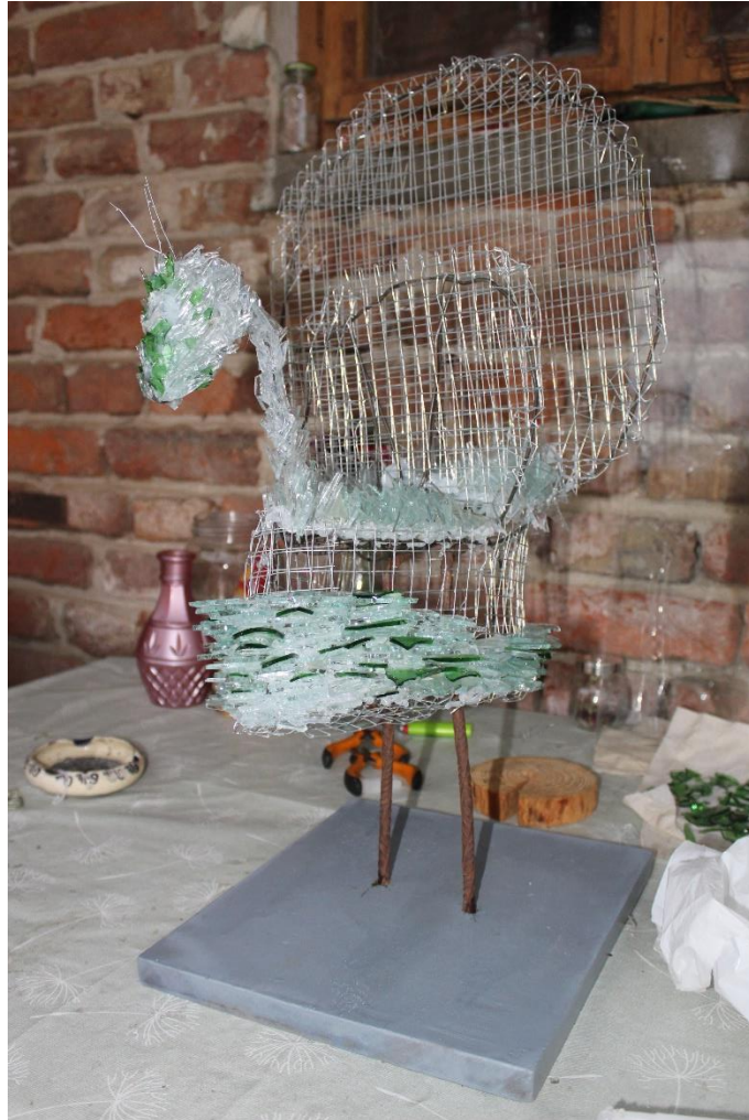
Slika 19 Paun u izradi

sam ju samo osvježila sa sprejom. Kada se je daska osušila izbušila sam rupe sa bušilicom te sam samo ubacila noge od pauna i sve je super stajalo.