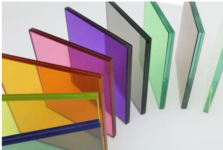
Slika 7 Staklo u boji

Prilikom rađanja stakla dodavanjem minerala mu mijenjamo boju na primjer ako u smjesu dodamo nikal oksid dobit ćemo ljubičasto staklo. Imamo razno razne kombinacije koje nam mogu oduzeti dah svojom ljepotom. Ako želimo zamutiti staklo samo mu dodamo naprimjer cirkoniju ili kalcijev sulfat.