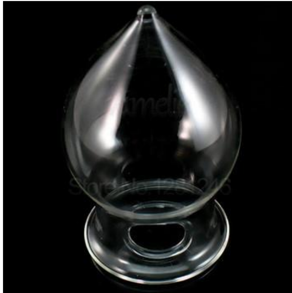
Slika 8 Šuplji stakleni analni čep

Ravno staklo se dobiva izvlačenjem ili valjanjem. Tehnikom izvlačenje se rade najviše prozorska stakla. Imamo 3 tehnike izvlačenja stakla Fourcaultov postupak, postupak Pittsburgh i postupak Libey-Owens. Fourcaultov postupak se izvodi tako što se izvlačenje dobiva kroz usku i dugačku mlaznicu koja pliva na talini. Pittsburghov postupak se izvodi uspravno sa površine taline iz komore iz koje se izvlači masa s mostom koji lebdi ili visi. Libey-Owensov postupak se izvodi također upravo kao i prošli postupak, sa površine taline koje na visini od 60 do 70 mora proći u horizontalno stanje.