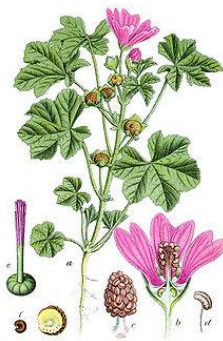
Slika 4 - crni sljez

https://www.gaudeamus.hr/gaudeamus/metvica-mentha-piperita/