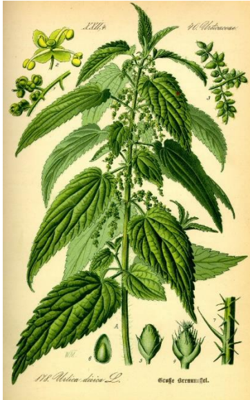
Slika 6 – kopriva