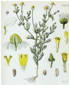
Slika 2 – kamilica

Naime, početni asortiman uključuje čaj od kamilice ( Matricaria piperita ), koprive ( Urtica dioica ), mente ( Mentha piperita ), crnog sljeza ( Malvae sivestris ), kadulje ( Salvia officinalis ) i matičnjaka ( Melissa officinalis ). Svaki od čajeva inspiriran je jednom prirodnom ili kulturnom znamenitošću Podravine te će ujedno i promovirati regiju kroz njene najpoznatije prirodne i kulturne znamenitosti. Pakiranje čaja od kamilice inspirirano je rijekom Dravom, pakiranje koprive glavnim središtem Podravine, Koprivnicom, pakiranje mente Ivanečkim vezom, pakiranje crnog sljeza Đurđevačkim peskima, pakiranje kadulje Podravskim poljima, a pakiranje matičnjaka naivom, odnosno naivom umjetnošću koje potječe iz malog podravskog sela Hlebine. Dakako, poduzeće želi da potrošači budu i najmlađi te je stoga osmišljena ambalaža za djecu sa nekima od simbola Podravine. Djeca će po ambalaži moći crtati i bojati. Ujedno se ovim putem poduzeće želi predstaviti na nacionalnom tržištu i potaknuti sve potrošače biljnih čajeva, ali i one koji će to tek postati, da posjete Podravinu.