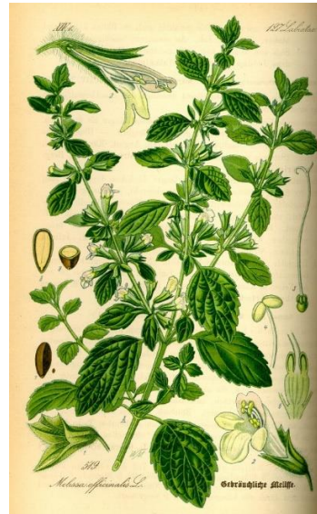
Slika 7 – matiĉnjak

https://bs.wikipedia.org/wiki/Kopriva#/media/Datoteka:Illustration_Urtica_dioica0.jpg