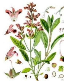
Slika 5 – kadulja