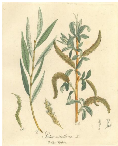
Slika 1 – bijela vrba

Odlučili smo se na ovu vrstu djelatnosti jer želimo blagodat prirode pružiti ljudima preko konzumacije ljekovitih čajeva, a tome u prilog govori i izreka: „Dok beremo cvjetove i listove, dok vadimo korijenje i gulimo koru s drveća, time ne siromašimo bogatstvo prirode koje nam je darovano, već prirodu samo malo prorjeđujemo“ (Willfort, 2002).