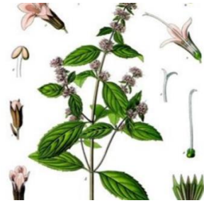
Slika 3 – menta

https://hr.wikipedia.org/wiki/Prava_kamilica