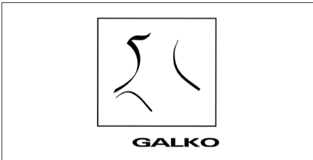
Slika 2. Logotip poduzeća Galko d.o.o., izvor: Galko d.o.o., https://galko.com/

Priča o poduzeću Galko d.o.o. započela je 1993. godine, kada je osnovan mali obiteljski obrt. Iza čina osnutka krije se strast prema izradi kožnih proizvoda i želja da se na tržište u RH plasiraju kvalitetni proizvodi. Otada pa do danas poduzeće je izraslo u vodećeg proizvođača kožnih torbi i modnih dodataka na tržištu RH, ali i šire, tj. na inozemnim tržištima. Logotip samoga poduzeća predložen je niže na Slici 2.