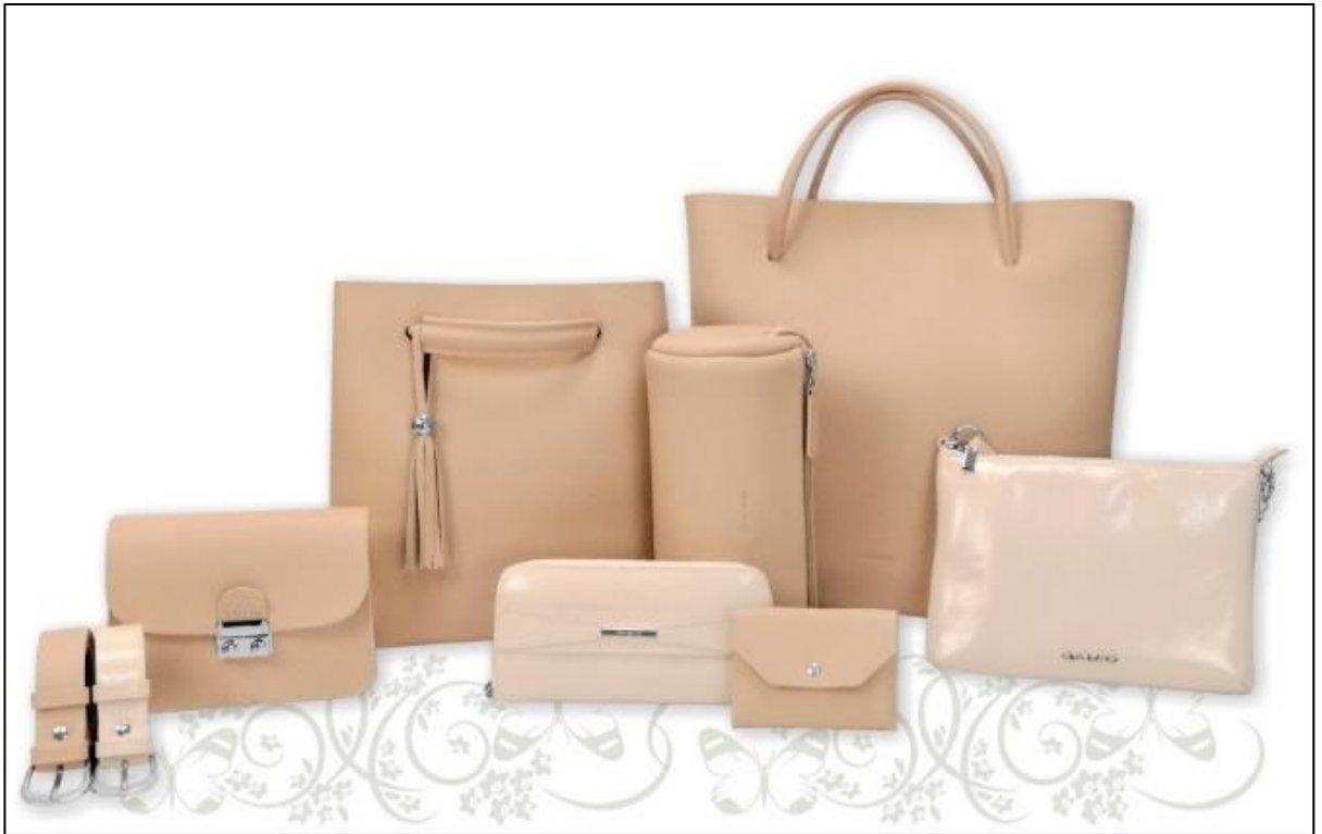
Slika 3. Dio asortimana kožnih proizvoda poduzeća Galko d.o.o.

Prva faza poslovnog ciklusa poduzeća Galko d.o.o. obuhvaća razvitak novih kolekcija, za što je zadužen kreativni tim koji kontinuirano priprema nove i moderne proizvode. U vidu toga se prate najnoviji (aktualni) trendovi na tržištu, gdje se pozornost posvećuje zadržavanju autentičnosti proizvoda i prepoznatljivosti brenda. Kompletan proizvodni proces, od planiranja, preko razvoja do proizvodnje finalnih proizvoda, obavlja se u vlastitom proizvodnom pogonu u RH. Zahvaljujući navedenom, sve službe su međusobno vrlo kvalitetno povezane i ispunjeni su svi mogući preduvjeti za stvaranje vrhunskih kožnih proizvoda. Dizajneri iz poduzeća Galko d.o.o. redovito posjećuju međunarodne sajmove na kojima izlažu vrhunske modele koji svojim dizajnom, originalnošću i kvalitetom stoje neposredno uz bok najpoznatijim i najrenomiranijim svjetskim (globalnim) brendovima.