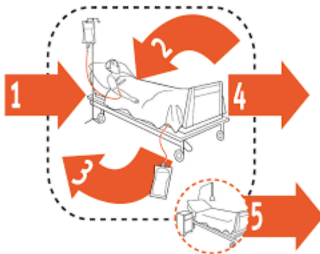
Slika 6. "Mojih 5 trenutaka za higijenu ruku"