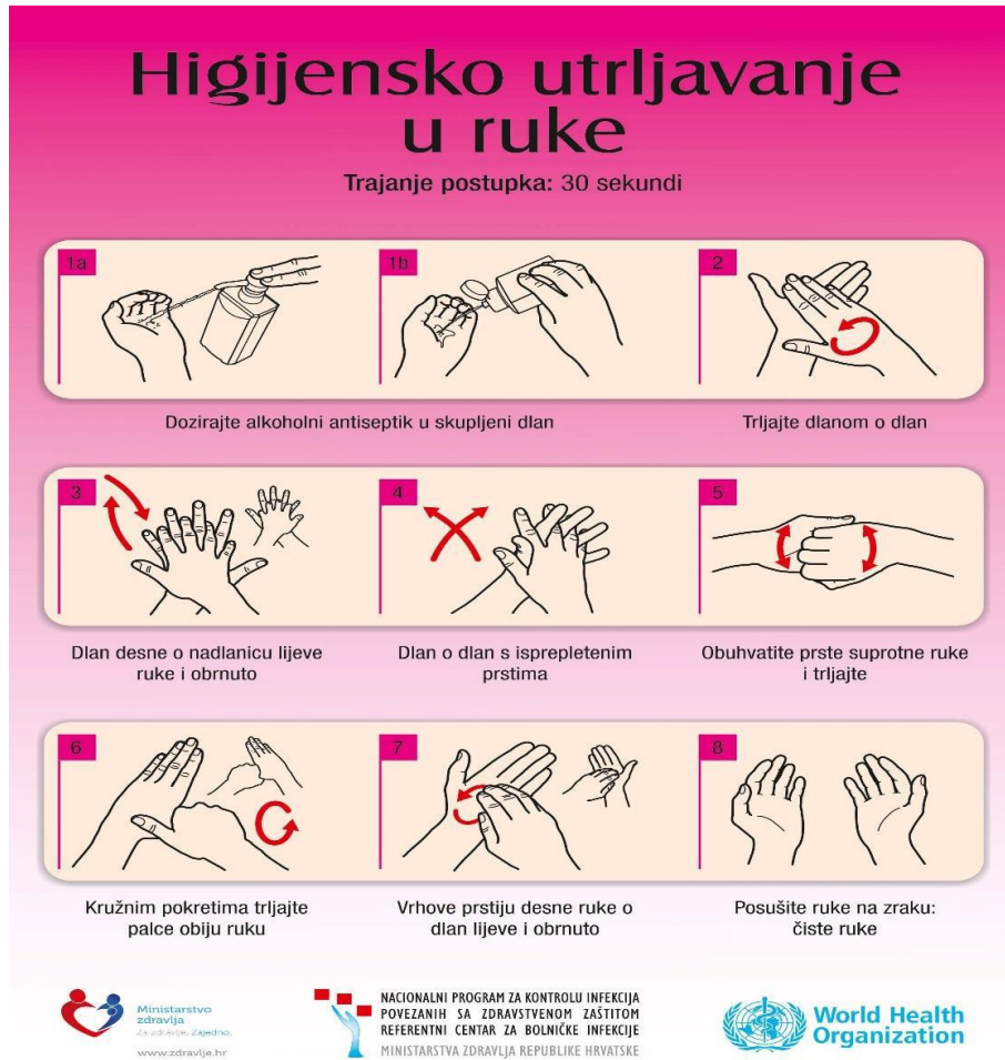
Slika 7. "Higijensko utrljavanje u ruke"

Slika 4. prikazuje postupak higijenskog utrljavanja ruku koji traje 30 sekundi. Postupak je na slici prikazan korak po korak, uz fotografiju i objašnjenje svakoga koraka [44].