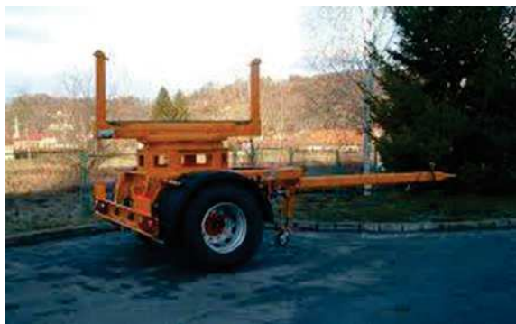
Slika 3. prikolica nosivosti 3500 kg do 10000 kg proizvođača Hidraulika Kurelja

Priključna vozila odnose se na 6 lakih prikolica najveće dopuštene nosivosti do 750 kg i, i 4 prikolice najveće dopuštene nosivosti od 3500kg do 10000 kg. Prikolice se koriste za prijevoz stupova i ostalih dugih tereta.