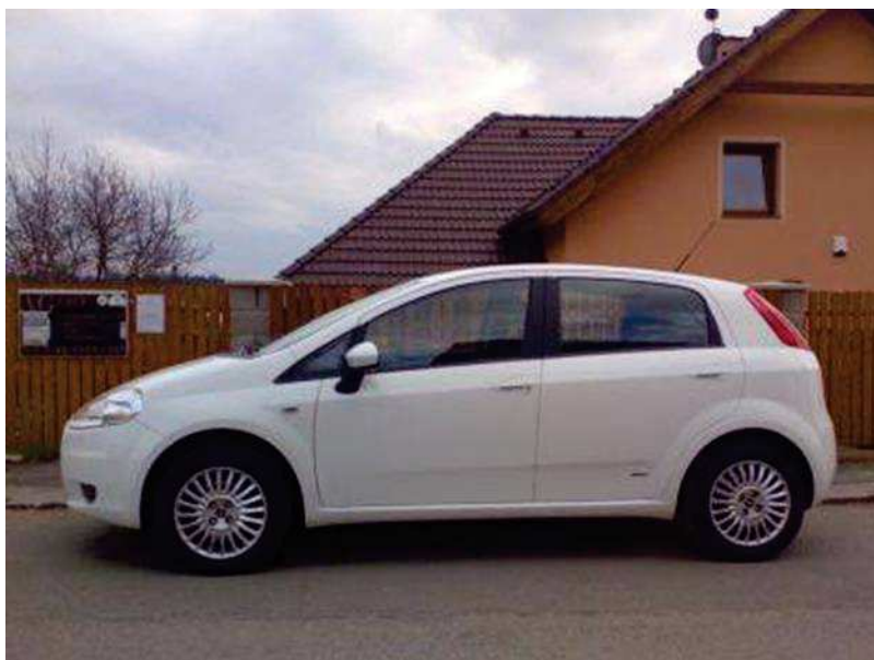
Slika 2. zatvoreno putničko vozila