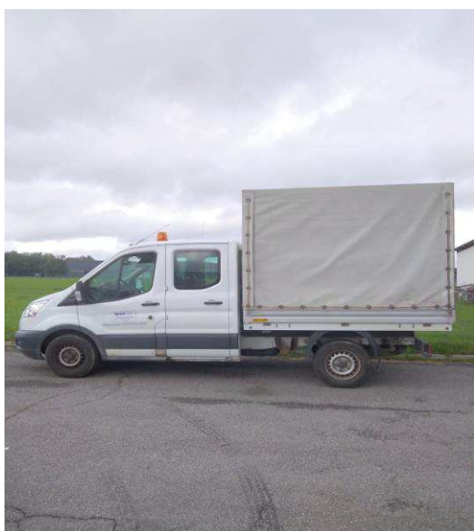
Slika 4. teretno vozilo nosivosti do 3500 kg

Struktura teretnih vozila je raznolika .U 45 vozila spadaju vozila najveće dopuštene nosivosti do 3500 kg , s tovarnim prostorom koja se nazivaju „brigadna vozila“ i služe za prijevoz ljudi i opreme na mjesto rada.