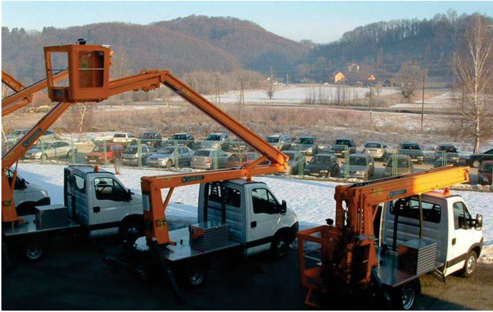
Slika 5. teretna vozila s radnom nadogradnjom Hidraulika Kurelja

Zatim su tu teretna vozila najveće dopuštene nosivosti s radnom hidrauličkom nadogradnjom, pod koja spadaju vozila nadograđena hidrauličkim dizalicama ili platformama.