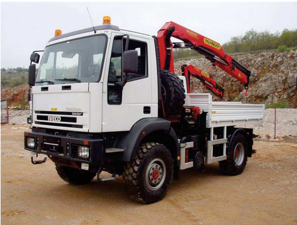
Slika 6. teretno vozilo s radnom nadogradnjom i tovarnim prostorom nosivosti do 12000 kg

Poduzeće posjeduje i velika teretna vozila s radnom nadogradnjom u obliku hidrauličke dizalice, s tovarnim prostorom najveće dopuštene nosivosti od 3500 kg do 18000 kg.