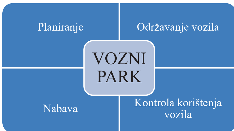
Slika 7. funkcije upravljanja voznim parkom

Upravljanje voznim parkom promatranog poduzeća može se razdijeliti kroz četiri funkcije ili procesa koji se međusobno nadovezuju, što se može vidjeti iz Slike 7. Svaki proces podrazumijeva određene poslove.