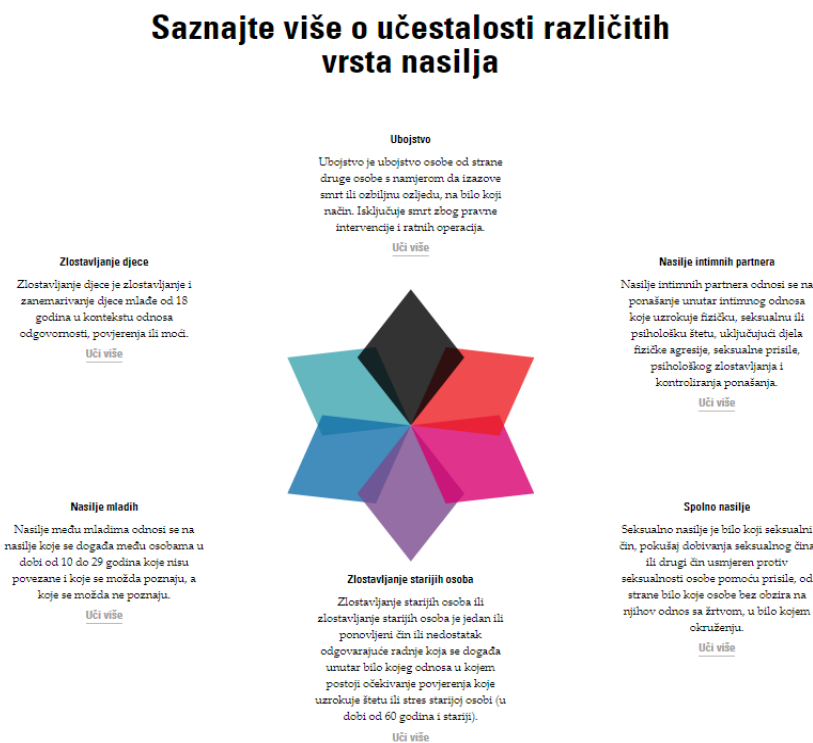
Slika br. 1. Vrste nasilja

Prema Svjetskoj zdravstvenoj organizaciji - WHO vrste nasilja su ubojstva, zlostavljanje djece, nasilje mladih, zlostavljanje starijih osoba, seksualno zlostavljanje i nasilje intimnih partnera prikazano u Slici 1. ( WHO Violence Info – A global knowledge platform for preventing violence (who.int) preuzeto: 22. 5.2023. godine)