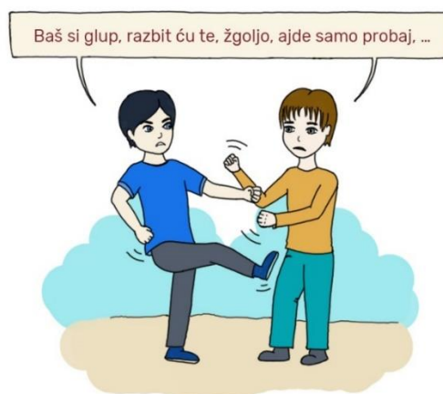
Slika br. 3. Ilustracija verbalnog i fizičkog vršnjačkog nasilja

Na Slici br. 3. prikazana je ilustracija fizičkog i verbalnog vršnjačkog nasilja koje pripada u klasične oblike nasilja.