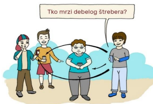
Slika br. 2. Ilustracija elektroničkog vršnjačkog nasilja

Ne potiči nasilje i ne sudjeluj u njemu. Pomozi žrtvi!