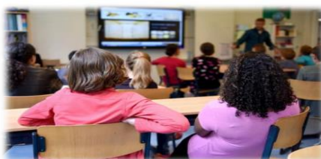
Slika br. 6. Kurikul OŠ Augusta Cesarca Zagreb