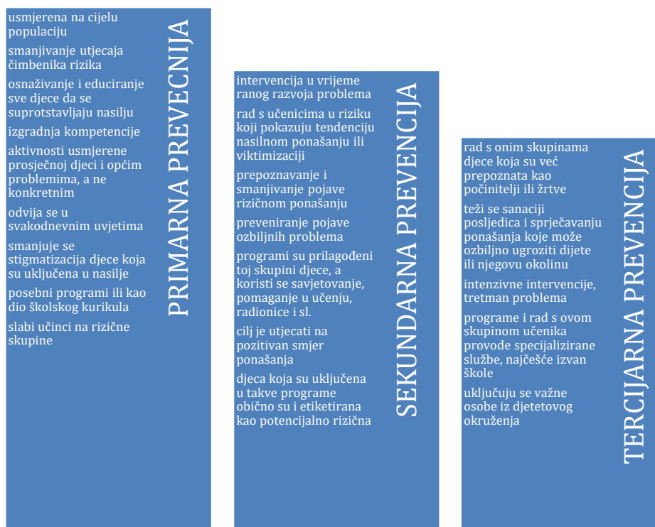
Grafikon br.2. Obilježja primarne, sekundarne i tercijarne prevencije vršnjačkog nasilja

Programi prevencije mogu se definirati kao „ napori usmjereni smanjivanju vršnjačkog nasilja i viktimizacije koji uključuju dobro osmišljene i organizirane mjere i aktivnosti kojima se nastoje ukloniti ili smanjiti uzroci problema. “ (Bilić prema Bašić, 2018:415)