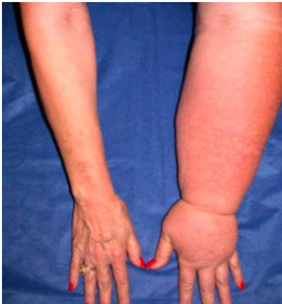
Slika: 6.6. Akutan limfni edem

Mnogo je razloga zatajivanja limfnog sustava, a oni se obično dijele u dvije skupine. Razlikujemo primarne koji nastaju uslijed aplazije, hipoplazije i valvularne insuficijencije [24] te sekundarne koji nastaju izazvani bolešću izvan limfnog sustava kao što je karcinom, terapija karcinoma i trauma [23]. Još uvijek nema jasnih razloga zašto se limfedem javlja u nekih bolesnica dok kod drugih ne. Pretpostavlja se mogućnost utjecaja etioloških čimbenika, zatim operacija, radioterapija ili progresija bolesti [25]. Postoje četiri tipa edema od kojih svaki obilježava svoje razdoblje poslije operacije i zračenja. Prvi je tip akutan, kratkotrajan, bolan, prolazan. Karakterizira ga blago povećanje ruke i pojavljivanje nekoliko dana nakon operacije, rezultat je presijecanja limfnih puteva. Drugi je tip također akutan i bolan, no pojavljuje se 4-6 tjedana nakon operacije. Javlja se kao rezultat akutnog limfagitisa ili flebitisa. Treći tip javlja se akutno, ali nakon ozljede kože, dok je četvrti tip obično podmukao i bezbolan. Nema kožnih promjena, a pojavljuje se 18-24 mjeseci nakon operacije [22].