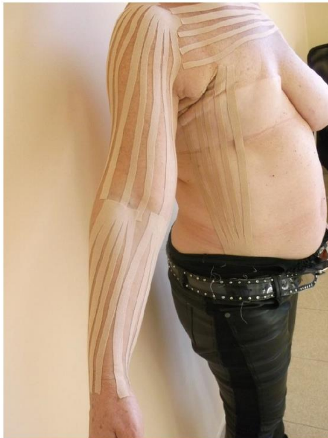
Slika 6.6.2. Primjer kinezio tapinga na pacijentici ( https://www.hindawi.com/journals/bmri/2013/767106/ )