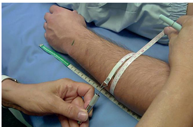
Slika 3.1.1. Primjer mjerenja voluminoznosti ruke

Od svih antropometrijskih mjera važne su mjere cirkularnosti kako bi se utvrdilo eventualno postojanje edema i sama opsežnost edema. Za procjenu i praćenje učinka terapije limfedema obavezno je napraviti mjerenje pri prvom posjetu pacijentice, te kod svakog sljedećeg posjeta izmjeriti opseg ekstremiteta centimetarnom trakom na točno određenim točkama. Obujam ramena mjeri se preko akromiona , tj. pazušne jame, opseg nadlaktice mjeri se 10 cm ispod akromiona ili 10 cm iznad olekranona. Opseg lakta mjeri se preko lakatne jame i olekranona centimetarnom vrpcom, dok se opseg podlaktice mjeri 10 cm ispod olekranona čije se mjerenje može vidjeti na slici 3.1.1. Zapešće se mjeri preko stiloidnih nastavaka radiusa i ulne, a šaka se mjeri preko glavica metakarpalnih kostiju. Potrebno je mjeriti na istim mjestima i na zdravom ekstremitetu kako bi se moglo usporediti. Iz dobivenih vrijednosti može se izračunati volumen ekstremiteta [8].