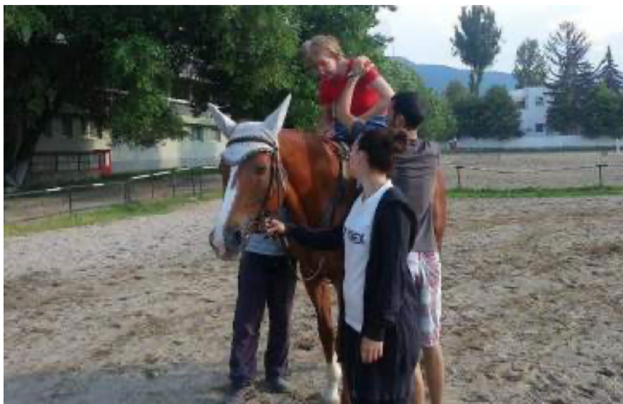
Slika 5.2. Korekcija sjedenja na konju u hipoterapiji