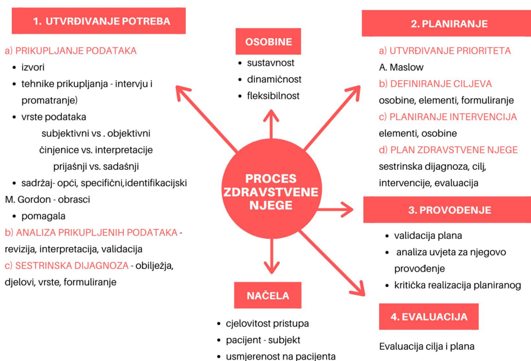
Slika 5.1. Proces zdravstvene njege

Proces zdravstvene njege je pristup pacijentu koji uključuje 4 segmenta zdravstvene njege, a to su: utvrđivanje potreba za zdravstvenom njegom, planiranje potrebnih intervencija, provođenje postupaka te evaluacija cjelokupnog provedenog postupka. Promatranjem stanja pacijenta, njegovih psihičkih i fizičkih sposobnosti medicinska sestra definira sestrinske dijagnoze prema kojima također planira, provodi i evaluira određeni cilj. Kao što slika 5.1. prikazuje, proces zdravstvene njege sastoji se od mnogo elemenata koje je potrebno uključiti u plan zbrinjavanja pacijenata.