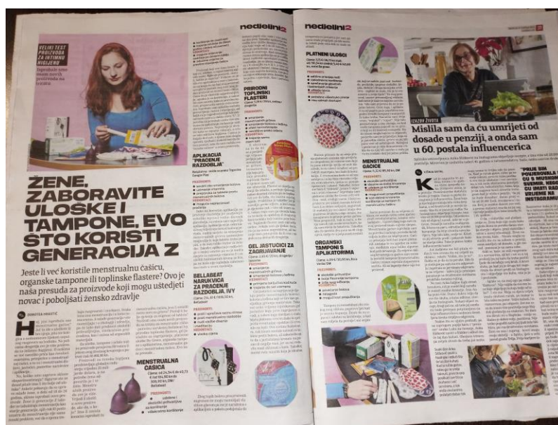
Slika 4.1.3.1. Primjer naslova u tiskanom izdanju N2