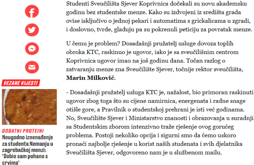
Slika 4.2.2. Primjer leada nakon ulaska u redakciju

Kako svaki od nadređenih urednika ima vlastiti stil, tako i novinari imaju svoj stil pisanja, međutim nikada nije dobro kada na jednom tekstu rade dva urednika, pregledavaju ga i puštaju u objavu, jer dolazi do nekoliko uredničkih intervencija u leadu zbog međusobnog neslaganja. Tako je primjer već naveden kod uredničke intervencije u naslovima, s refundacijom troškova HZZO-