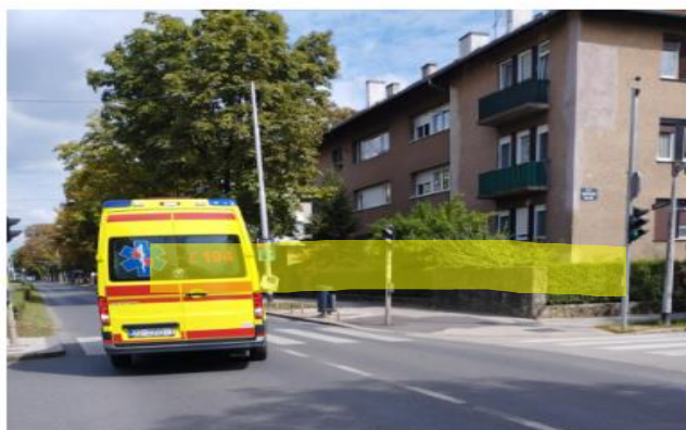
Slika 4.3.4. Tekst nakon uredničke intervencije

Promet se zaustavlja, a nakon nekoliko minuta deranjave i psovanja putnik baca svoja pomagala za hodanje na vozačicu ZET-a. Stiže i hitna pomoć i policija, a putnik je nakon toga pregledan i otpremljen u bolnicu.