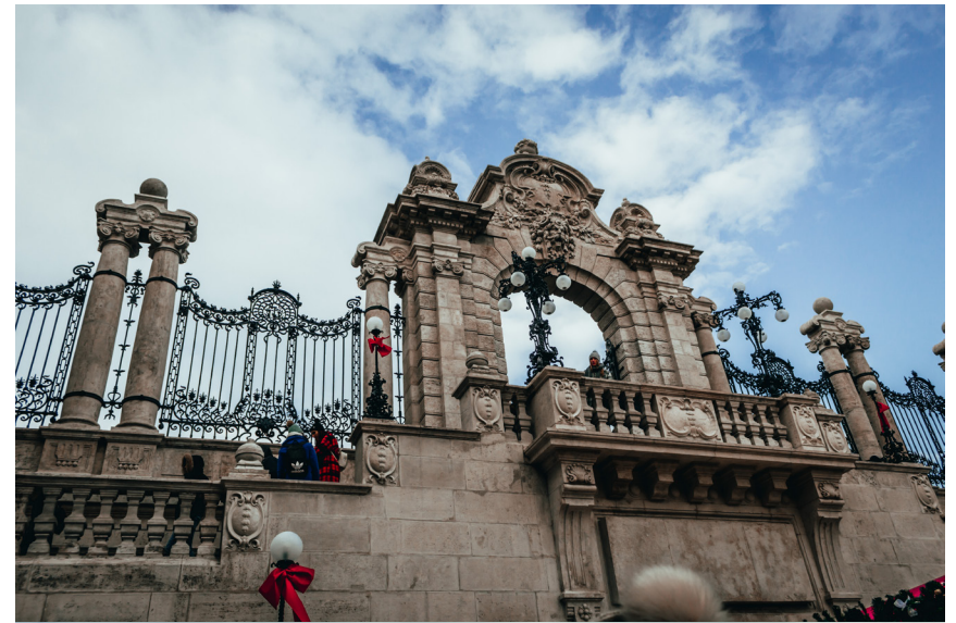
Vrata u drugi svijet