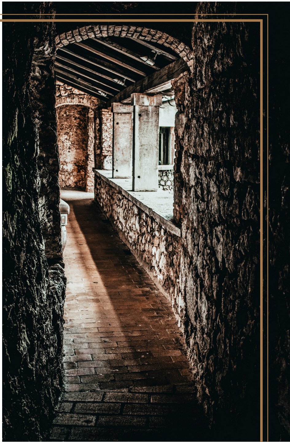
Put u nepoznato