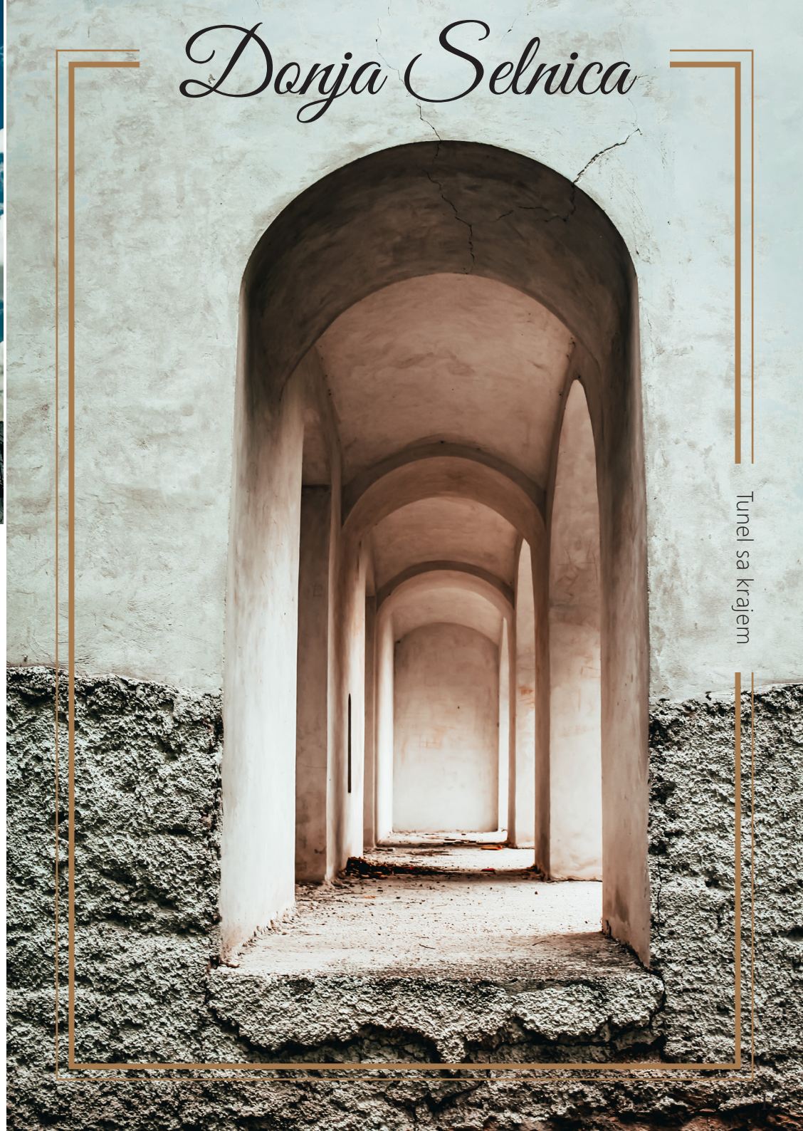
Tunel sa krajem