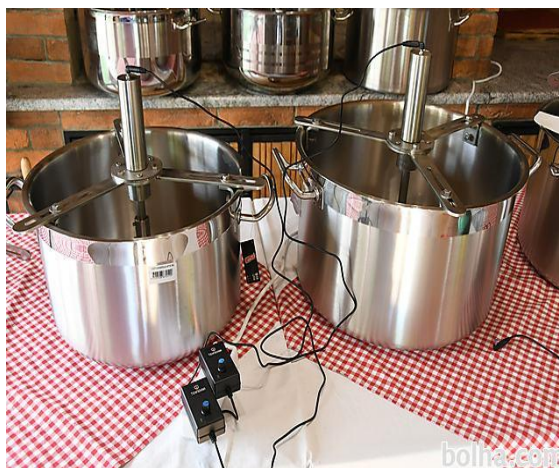
Slika 11. Ugradbene miješalice za ajvar

Miješalice su različite i mogu se montirati na lonce ili kotlove ili postoje posebni lonci sa već ugrađenim miješalicama. Primarna svrha miješalice je osigurati bolju mješavinu, smanjiti vrijeme potrebno za miješanje i smanjiti manualni rad [11].