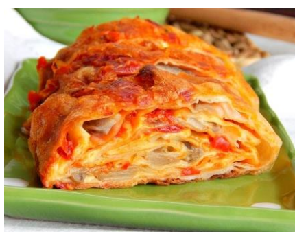
Pita s ajvarom

https://www.ajvar.com/hr/recept/zapeceni-grah-s-ajvarom/