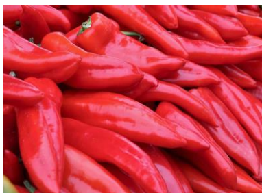
a) "Roga" paprike