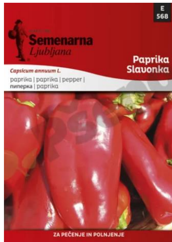
Slika 4. Vrećica sjemena paprike Podravke i Slavonke