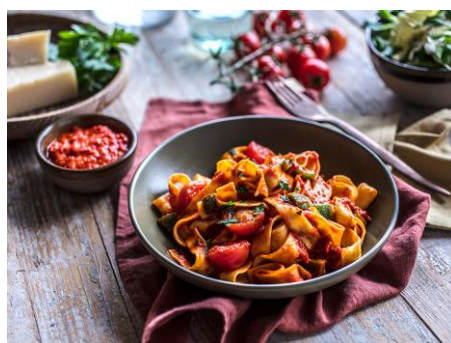
Tjestenina s ajvarom

https://www.najboljirecepti.com/wp-content/uploads/2020/02/6878b310054850ba71b46cd34.jpg