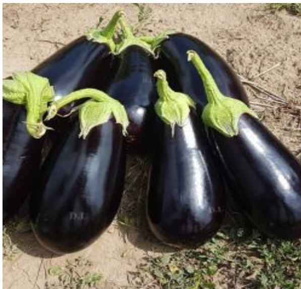
Slika 6. Plavi patlidžan

Patlidžan ( Solanum melongena ) (Slika 6), također pripada porodici pomoćnica ( Solanaceae ) kao i paprika te se uzgaja se zbog plodova.