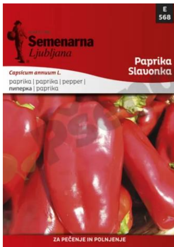
Slika 4. Vrećica sjemena paprike Podravke i Slavonke