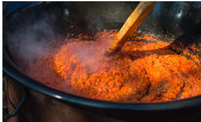
Slika 10. Kuhanje ajvara

Nakon što se dobije sirova masa sačinjena od usitnjene paprike, pristupa se kuhanju ajvara prilikom kojeg mu se dodaju začini: češnjak, ljute paprike, sol, ocat. Ako se kuha ajvar od pečениh paprika u ovom se koraku dodaje ocat, no ukoliko je to ajvar od barenih paprika nije ga potrebno dodatno zakiseljavati. Ajvar se kuha u biljnom ulju, u našim krajevima najčešće se koriti suncokretovo ulje u plićim, širokim loncima ili na otvorenom, u kotlovima.