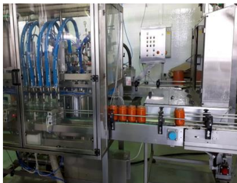
Slika 12. Punilica za ajvar, izvor: https://i.ytimg.com/vi/D61xAT7bZic/maxresdefault.jpg

uvjetima od trenutka kada paprika zajedno sa ostalim sastojcima krene u proces prerade pa do gotovog ajvara prođe oko dva sata. Nakon što je ajvar skuhan puni se u staklenke (Slika 12).