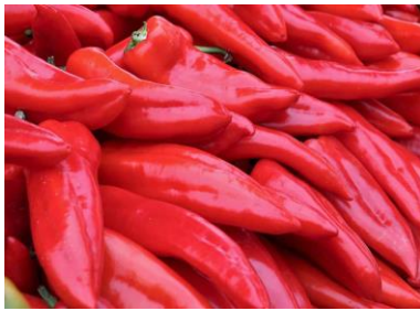
a) "Roga" paprike