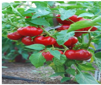
b) Paprika „paradajzerica“

https://agrosavjet.com/wp-content/uploads/2022/06/roge-paprike.jpg