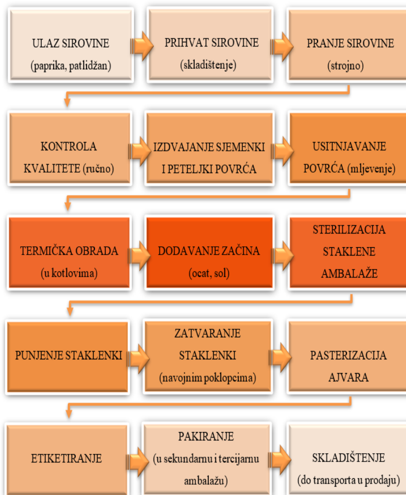
Slika 8. Procesna shema izrade ajvara

Proces sheme proizvodnje ajvara prikazan je na Slici 8.