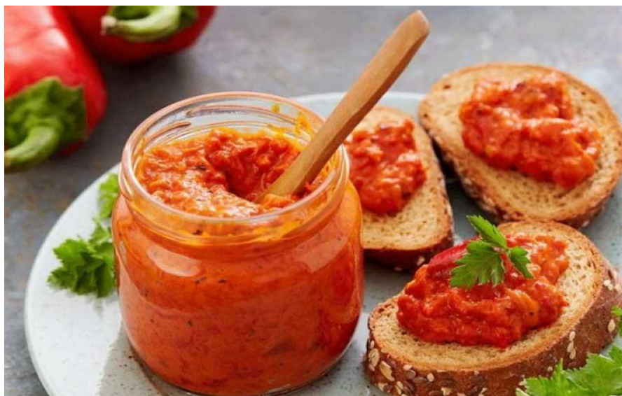
Slika 1. Ajvar

Ajvar (Slika 1.) je hladni namaz izrađen od barenih ili pečenih paprika, bez sjemenki, sa postotkom od 15-20% suhe tvari i dodatkom začina i drugog povrća, ovisno o recepturi [1]. Cijenjen je u našim krajevima kao gastronomski specijalitet specifičnog okusa i boje napravljen od najkvalitetnijih crvenih paprika. Najčešće se koristi kao namaz ili kao prilog, ali je to i aromatičan umak, može poslužiti i kao salata te dodatak različitim jelima [2].