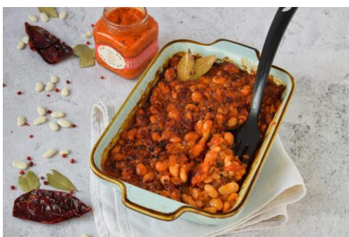
Zapečeni grah s ajvarom

https://www.coolinarika.com/recept/tjestenina-s-ajvarom-e40008b0-6182-11eb-a6f5-0242ac12001b