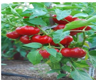
b) Paprika „paradajzerica“

https://agrosavjet.com/wp-content/uploads/2022/06/roge-paprike.jpg