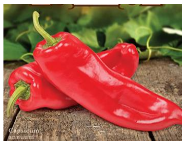
c) Sorta "Kurtovska Kapija"