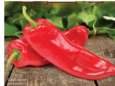
c) Sorta "Kurtovska Kapija"

https://planthouse.hr/wp-content/uploads/2019/02/14-131.jpg