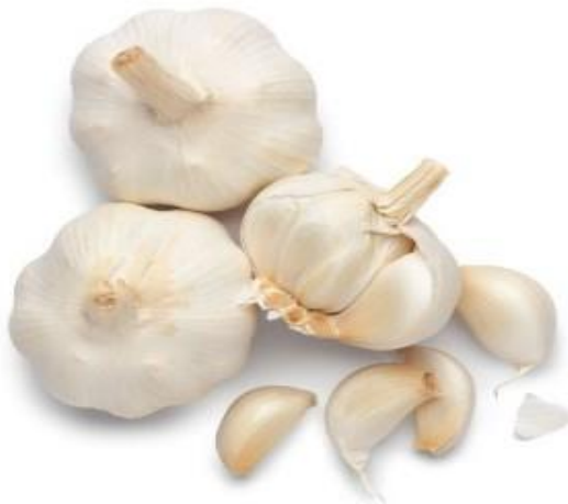
Slika 7. Češnjak, izvor: https://cdn.agroklub.com/upload/images/plant-specie/thumb/luk-cesnjak-300x300.jpg

Češnjak ( Allium sativum ) (Slika 7.) se dodaje kao začin. Češnjak može biti svjež, njegovi češnjevi se usitnjavaju i dodaju sirovoj masi za ajvar te se kuhaju zajedno s paprikom i patlidžanima iako ga se može dodati i u prahu, no okus je onda nešto drugačiji i dodaje se na kraju kuhanja.