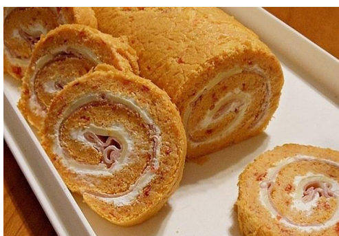
Rolada s ajvarom

Ajvar se u gastronomiji koristi na različite načine kao namaz, kao salata, kao začin varivima, kao prilog mesnim jelima ili veganski umak, kao aromu za aromatiziranje slanih pita, peciva, biskvitnih rolada, riže, omleta ili se može jesti kao samostalni obrok.