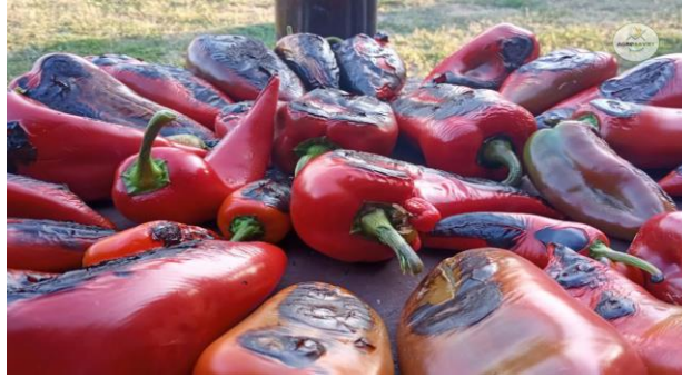
Slika 9. Pečene paprike

Nakon što se dobije sirova masa sačinjena od usitnjene paprike, pristupa se kuhanju ajvara prilikom kojeg mu se dodaju začini: češnjak, ljute paprike, sol, ocat. Ako se kuha ajvar od pečениh paprika u ovom se koraku dodaje ocat, no ukoliko je to ajvar od barenih paprika nije ga potrebno dodatno zakiseljavati. Ajvar se kuha u biljnom ulju, u našim krajevima najčešće se koriti suncokretovo ulje u plićim, širokim loncima ili na otvorenom, u kotlovima.