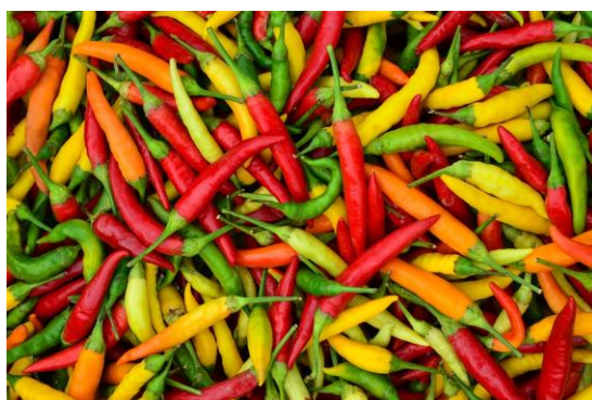
Slika 5. Feferon paprike

U proizvodnji ajvara mogu se koristiti i ljute sorte paprike takozvane feferon paprike (Slika 5) koje ajvaru daju pikantnost okusa i ljutinu. Dodaju se u malim količinama, prema okusu, a ovisno o količini mase pred kraj pripreme da se izgubi na okusu koji bi mogao ispariti kuhanjem. Može se dodati kao ljuta paprika u prahu, a njezin način uzgoja isti je kao i kod ostalih vrsta paprike.