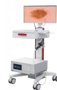
Slika 8.2.1. FotoFinder

Novi uređaj njemačke tvrtke FotoFinder predstavljen je kao zlatni standard za praćenje visokorizičnih pacijenata za nastanak melanoma. Uređaj se koristi umjetnom inteligencijom koja analizira svaku suspektanu promjenu na koži. Obzirom na njegovu inovativnost sustav koristi sofisticirane algoritme za nadzor kože i nevusa identifikacijom novih ili izmijenjenih promjena. Pregled FotoFinderom predstavlja izuzetan napredak u dermatologiji, obzirom da ima mogućnost prepoznavanja i vrlo rijetkih podtipova melanoma što uvelike daje prednost nad dermatološkim pregledom golim okom [37].