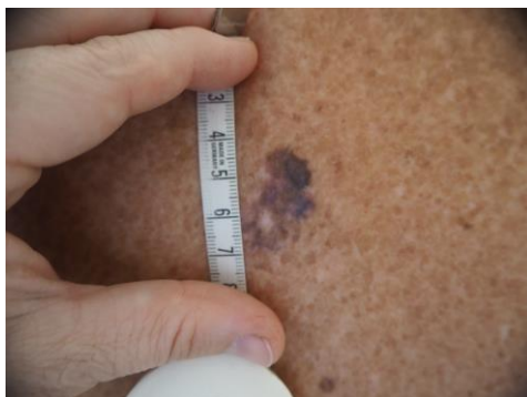
Slika 5.1.1. Površinskošireći melanom

malignih stanica u dermis. Najčešće je lokaliziran na leđima muškaraca i donjim ekstremitetima žena [25].