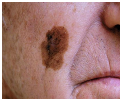
Slika 5.4.1. Lentigo maligna melanoma

Lentigo maligna melanoma je drugi najčešći podtip melanoma nastao iz prekanceroze lentigo maligna [28]. Javlja se u 4% do 10% svih slučajeva melanoma kao smeđa ili crna makula lokalizirana na licu osoba starije životne dobi. S progresijom, dolazi do nakupina atipičnih stanica u bazalnu membranu koje prelaze u dermis [25].