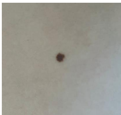
Slika 4.1. Melanocitni nevus

Nevusi (madeži) predstavljaju lezije na koži i sluznicama koje mogu biti prisutne prilikom rođenja ili u odrasloj dobi. Klinički, nevusi se manifestiraju kao tamnosmeđe, svijetlosmeđe, crne i plave makule ili papule sa ili bez dlaka. Prosječna odrasla osoba u svome životu ima otprilike 20 do 40 nevusa, uglavnom na koži trupa, lica i ekstremiteta. Nevusi predstavljaju jedno od najvažnijih područja dermatološke onkologije obzirom na teško razlikovanje benignog nevusa od malignog melanoma. Nevusi se prema vremenu nastanka dijele na kongenitalne i stečene. Na broj i razvoj nevusa utječu i faktori poput svijetle puti, svijetle boje očiju i kose. Iz tog razloga osobe sa svjetlijim fototipom kože imaju više nevusa u odnosu na osobe tamnijeg fototipa. Mnogi čimbenici mogu utjecati na izgled i veličinu nevusa koji se tijekom vremena mogu mijenjati. Različita fiziološka stanja, primjerice pubertet i trudnoća mogu uzrokovati morfološke promjene nevusa. S ciljem što ranije dijagnostike melanoma, nužno je poznavati kliničke karakteristike nevusa [15].