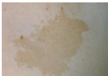
Slika 4.1.5.1. Pjega boje bijele kave

Benigna makula boje bijele kave lokalizirana najčešće na gornjem dijelu trupa i ekstremitetima. Nikada maligno ne alterira. Histološki dolazi do povećanja broja melanocita, a dijagnosticira se na temelju kliničke slike. Liječenje nije potrebno [2].