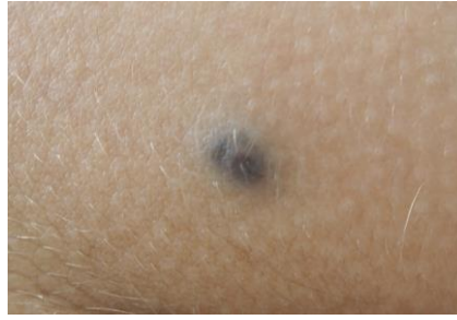
Slika 4.2.1.1. Plavi nevus