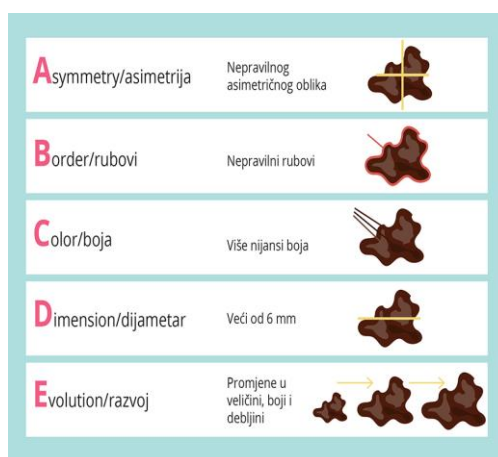
Slika 5.6.1. ABCDE pravilo