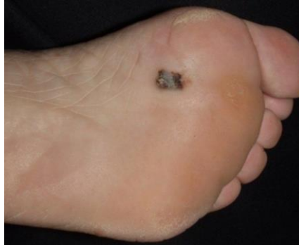
Slika 5.3.1. Akrolentiginozni melanom

melanoma na mjestima koja nisu fotoeksponirana. Očituje se makulom tamno smeđe ili crne boje koja s vremenom prelazi u papulu. Ovaj je tip melanoma specifičan po vertikalnom i horizontalnom rastu [27].