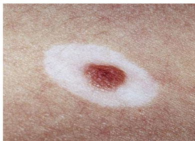
Slika 4.3.2.1. Halo nevus

Melanocitni nevus smeđe boje okružen jasno definiranom depigmentacijom okrugla oblika. Incidencija halo nevusa u općoj populaciji je oko 1%. Obično se javlja kod djece ili mlađih odraslih osoba oba spola, no može se javiti i u starijoj životnoj dobi. U većini slučajeva spontano nestaje zato liječenje nije neophodno [22].