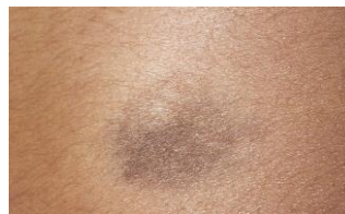
Slika 4.2.3.1. Naevus fuscocaeruleus deltoacromialis

Naevus fuscocaeruleus deltoacromialis je nevus velikog plosnatog oblika, lokaliziran na prsištu te se javlja samo u Japanaca. Dijagnosticira se fizikalnim pregledom, a obzirom na veličinu nevusa liječenje je gotovo nemoguće. Nevus često maligno alterira [16].