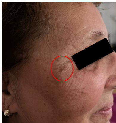
Slika 4.1.4.1. Lentigo solaris

Smeđe pigmentirane makule, nekoliko milimetara promjera. Promjene su lokalizirane na fotoekspoziranim mjestima, nakon četrdesete godine života. Dijagnoza se postavlja fizikalnim pregledom pacijenta. Liječenje nije potrebno [2].