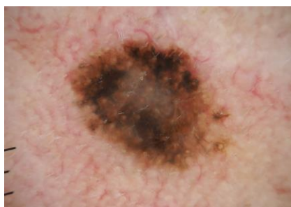
Slika 5.1. Dermatoskopski prikaz melanoma