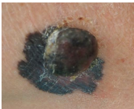
Slika 5.2.1. Nodularni melanom

Nodularni melanom je agresivan, okomito rastući melanom koji čini 15% do 30% slučajeva [25]. Nema radijalnu fazu rasta, stoga raste u dubinu brže nego u širinu i time potvrđuje izrazitu agresivnost. Iz tog razloga, osobi može trebati više vremena da posumnja na malignu leziju. Nodularni melanom obično se pojavljuje kao tamno pigmentirani pedunkulirani ili polipozni čvorić koji često krvari i egzulcerira [26].