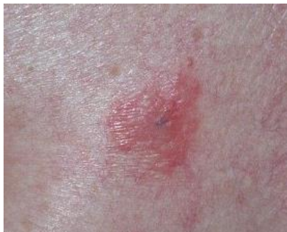
Slika 5.5.1. Amelanotični melanom

Amelanotični melanom je poseban nepigmentiran oblik melanoma, najčešće ružičaste boje. Klinički se pojavljuje kao čvorić ili plak. Biološki je značajno agresivan [26].