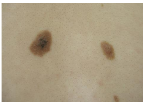
Slika 4.3.1. Nevocelularni nevus

Za razliku od kongenitalnih nevusa, stečeni nevocelularni nevusi nastaju u dječjoj ili mlađoj odrasloj dobi, klinički se očituju svijetlo do tamnosmeđim makulama simetričnog izgleda, jednolike pigmentacije i veličine do 6 mm. Histološki su prisutne nevusne stanice u području bazalnog sloja epidermisa [19].