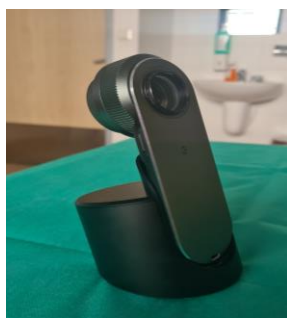
Slika 8.1.1. Dermatoskop

Najnovija generacija dermatoskopa uključuje ugrađene ukrštene polarizatore koji filtriraju raspršeno svjetlo s periferije, smanjuju odsjaj i dopuštaju vizualizaciju supstratnih struktura bez potrebe za povezivanjem tekućine. Neki dermatoskopi imaju ugrađeni sustav za fotografiranje s pratećim softverom za snimanje i pohranu slika. Napredni uređaji imaju sustave analize cijelog tijela za detaljno praćenje kožnih lezija tijekom vremena [36].