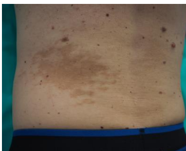
Slika 4.1.2.3. Beckerov nevus

Beckerov nevus opaža se unilateralno, najčešće na ramenima i prsima. Histološki se radi o epidermalnoj hiperpigmentaciji. Češće je aktivan tijekom puberteta, kod dječaka s hiperpigmentacijom nevusa. Boja nevusa u početku je svijetlosmeđa, ali u pubertetu, kao odgovor na otpuštanje i aktivnost androgena, postaje veći i tamniji s pojačanim rastom dlaka. Beckerov nevus dijagnosticira se na temelju kliničke slike i analize androgenih receptora. Liječenje nije potrebno. Kirurški se uklanja isključivo zbog estetskih razloga [15].