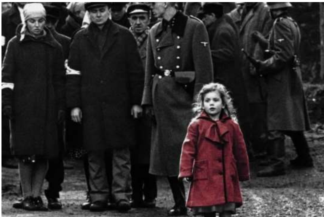
Slika 3: Djevojčica u crvenom kaputu, „Schindler's List“ (hrv. „Schindlerova lista“ (1993.)

Simbolizam u njegovim filmovima nam može pobliže objasniti pouku i poruku priče. Crveni kaput djevojčice u oštrom je kontrastu s crno-bijelom pozadinom u jednoj sceni, privlači pozornost na tu crvenu boja pa ne dodaje samo estetsku vrijednost, već i povećava emocionalni utjecaj filma naglašavajući kontrast između nevinosti i zla. [24] U nekim od njegovih filmova vidimo na koji je način želio prenijeti simboliku opasnosti, kao što možemo vidjeti na posteru filma „Jaws“ (hrv. „Ralje“), gdje vidimo da se morski pas skriva ispod površine vode, u smislu da očekujemo nešto neočekivano. Također kroz priče svakog od njegovih filmova, možemo vidjeti da se bavi teškim temama (kao što su ratne teme) ili teme komunikacije i bliskosti. Simbolika u njegovim filmovima uvijek nam može približiti nešto novog, a isto tako i potaknuti gledatelje na maštu i razmišljanje tijekom gledanja. Njegovi filmovi vas potiču na razmišljanje, traže od vas da ste angažirani tijekom filma i da vas priča dovoljno okupira kako biste bili i emocionalno povezani, uz to su poučni, imaju duboko značenje, a neki od njih vam pružaju dovoljno zabave da se možete opustiti.