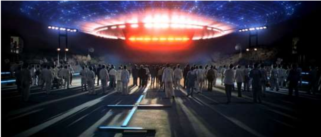
Slika 6: „Close Encounters of the Third Kind“ (hrv. „Bliski susreti treće vrste“, 1977. g.)

Upotrebom CGI-ja, kao što smo prije spomenuli, u poznatim filmovima Spielberga, zapravo je otvorilo put i postao sastavni dio buduće kinematografije. Na taj način pomaže oživjeti priče na ekranu, isto kao što smo mi imali priliku vidjeti kako su dinosauri oživjeli. Evolucija CGI-ja u filmu bila je izvanredno putovanje koje je promijenilo način na koji se filmovi stvaraju i doživljavaju. Napredak u računalno generiranim slikama preveo je industriju od upotrebe animatronike do glatkih prijelaza. U ranim danima snimanja filmova animatronika je bila glavna tehnika za stvaranje specijalnih efekata. To je uključivalo upotrebu mehaničkih lutaka i modela kojima se ručno upravljalo da oponašaju pokrete i radnje. Trenutno, CGI omogućava stvaranje realističnih i fantastičnih vizuala koji nisu bili ograničeni ograničenjima fizičkih modela. [19]