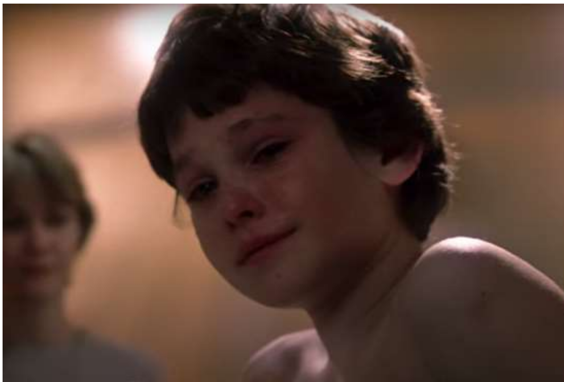
Slika 1: Elliot, film „E.T.“ (1982.)

Jedno od obilježja Spielbergova vizualnog pripovijedanja je to što se kamerom usredotočuje na emocije svojih likova, umjesto da samo uhvati radnju na ekranu. Smatra se da je njegov način korištenja kamere i posebnih kutova ključno za emocionalan učinak njegovih filmova gdje emocije hvata na pravi i intiman način. [16] Stevenova posvećenost detaljima, emocionalna dubina i sposobnost prenošenja složenih emocija čine njegove likove srodnima i duboko ljudskima, a sposobnost stvaranja dijaloga između likova zapravo daje publici bitan faktor kod promatranja scena na ekranu i sveukupne emocionalne povezanosti s likovima, te tako dobivamo i samu vezu između publike i likova na ekranu. Ova veza omogućuje gledateljima da emocionalno urone u priču, čineći kinematografsko iskustvo još impresivnijim. Prikazivanje emocija na ekranu je uvijek bio jedan od najboljih elemenata u Spielbergovim filmovima, bilo da se radi o radosti ili tuzi, strahu ili uzbuđenju, ljubavi ili mržnji.