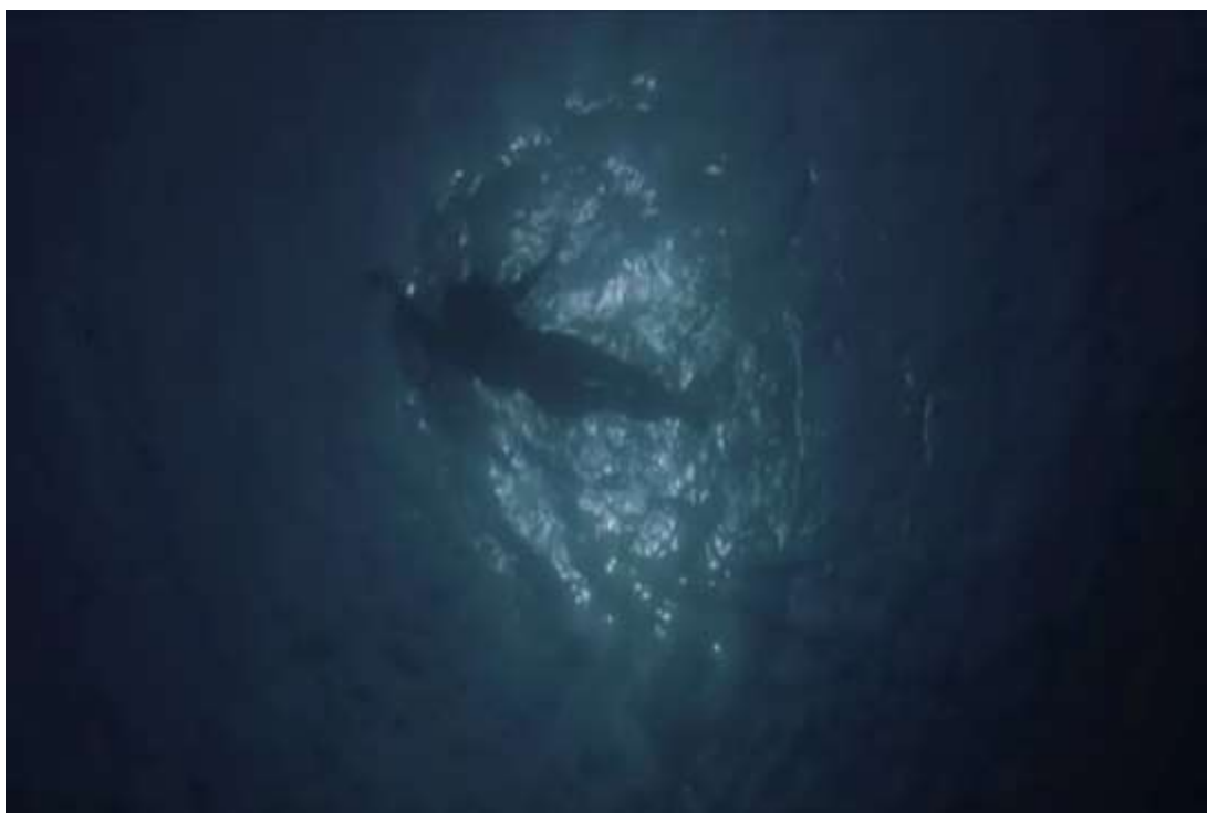
Slika 2: „Jaws“ (hrv. „Ralje“) (1975.)

kadriranje igraju važnu ulogu u napetosti i neizvjesnosti u njegovim filmovima. Maleni detalji kojima on pridaje važnost zapravo omogućuju nama kao publici vidjeti stvari njegovim očima. U čemu zapravo možemo primijetiti kako je pridavao pažnju svemu, posebice publici koja će to gledati na ekranima. Tako možemo vidjeti da je u filmu „Jaws“ (hrv. „Ralje“) koristio snimke iz žablje perspektive kako bi naglasio napetost i neposrednu blizinu morskog psa i tako povećao i napetost i strah kod gledatelja. [16] Ovakva perspektiva u duetu s njegovom pričom zapravo daje dobar efekt i pokazuje nam sposobnost Spielbergovog pričanja i prijenosa priče na nas ostale.