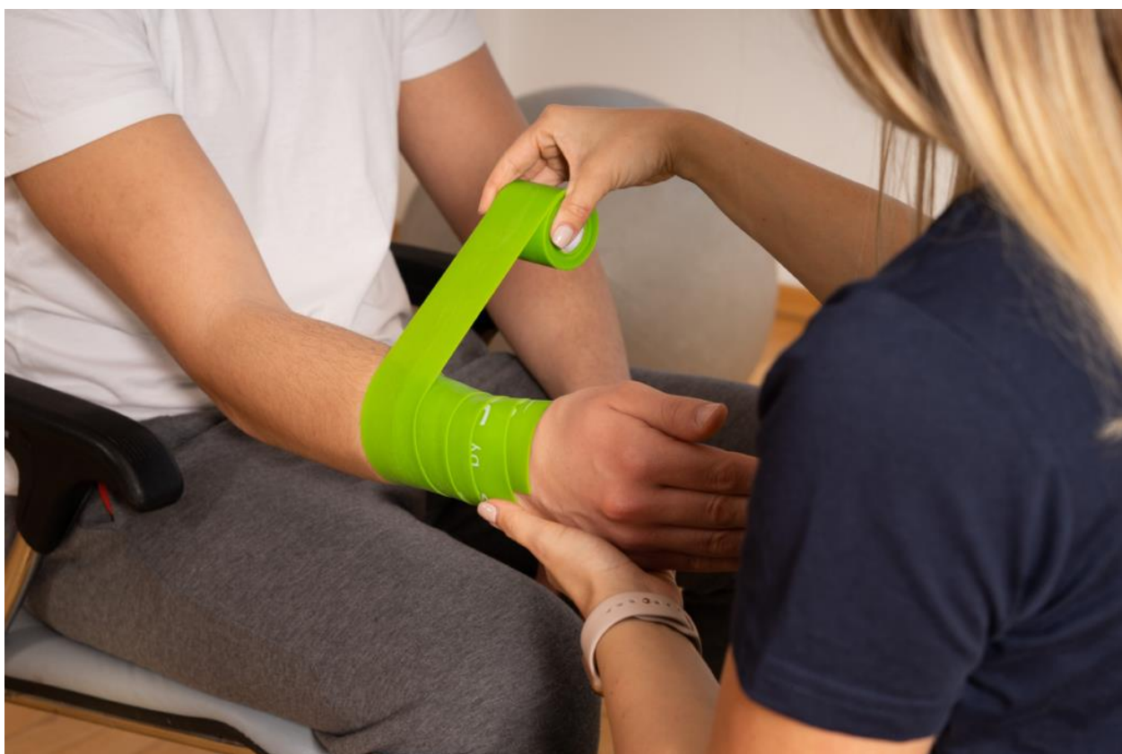
Slika 2.3.2. Prikaz flossinga

Flossing (slika 2.3.2.) je metoda koja uz pomoć lateks gume djeluje na površinu kože visokom kohezijskom silom i ima dva glavna cilja koja su smanjenje boli i povećanje opsega pokreta. Lateks guma djeluje na zglobove, fasciju, mišiće. Sportaši, fizioterapeuti, oni koji prakticiraju ovu metodu, najviše traže benefite u vidu smanjenje boli, povećanog opsega pokreta, služi i kao prevencija ozljede, regeneracija mišića te povećanje trofike mišića. Vremenski se tehnika provodi ne duže od 2 minute, te se guma postavlja prema proksimalnom segmentu uz nateg od 50 – 60% oko cijelog tretiranog ekstremiteta, područja te se nakon 2 minute otpušta. Kod otpuštanja trake bitno je brzim kružnim pokretima naglo otpustiti tretirani dio. Radi povećanja rizika od ozljede ili radi pretjerane kompresije, mora se paziti kako nateg gume ne bi bio veći od preporučenog [13].