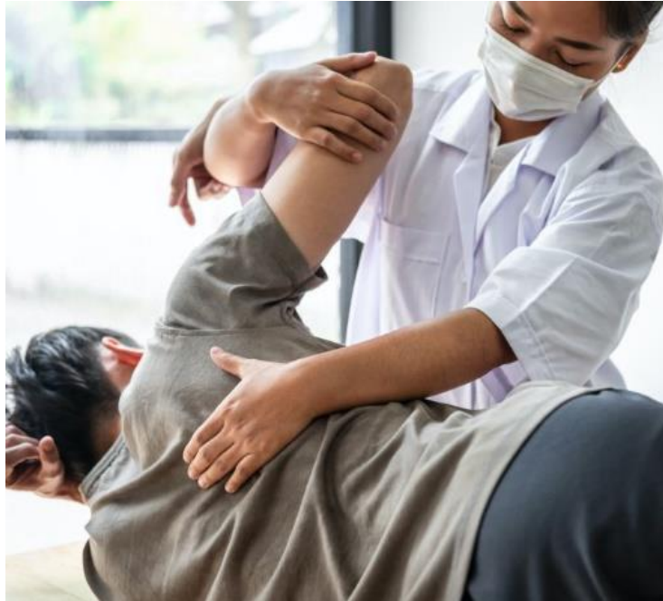
Slika 2.1.1. Interakcija fizioterapeuta i pacijenta tijekom tretmana

Za vrijeme oporavka i liječenja, pacijent postaje sudionik u tom procesu oporavka, te na temelju kvalitetne komunikacije između zdravstvenog djelatnika i pacijenta i informacija koje nam pacijent daje, možemo zaključiti u kojem će smjeru ići liječenje. Fizioterapeut treba znati dobro i pravilno komunicirati s pacijentom kako bi njemu i njegovoj obitelji znao reći sve što se događa i kakva je situacija.