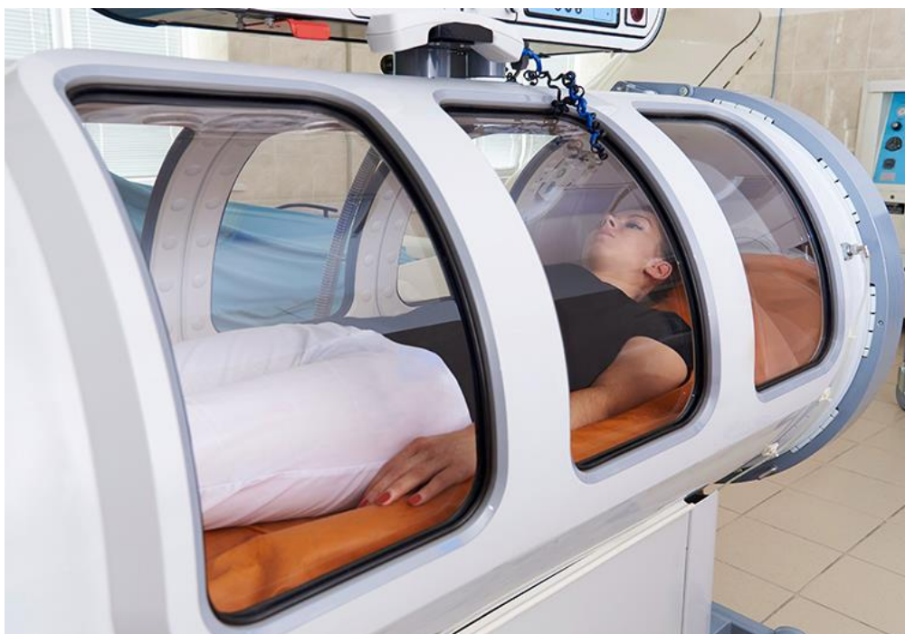
Slika 4.1. Upotreba hiperbarične komore

Fizikalna terapija je jedan od tretmana liječenja i oporavka koje se primjenjuju u profesionalnom sportu i na amaterskoj razini. Fizikalna terapija je dio medicine koji je zaslužan za puni oporavak od ozljeda i pronalaženju uzroka za određeno stanje. Cilj je terapije rehabilitacija, povećanje funkcionalnosti, smanjenje boli i pružanje edukacije sportašu ili obitelji i prijateljima ozljeđenog.