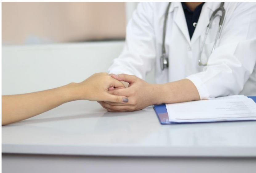
Slika 2.1. Emocionalno razumijevanje pacijenta

Emocionalna inteligencija odnosi se na sposobnost prepoznavanja vlastitih osjećaja i osjećaja drugih ljudi, motiviranje sebe i dobrog upravljanja emocijama u sebi i svojim odnosima s drugima. Ona označava sposobnosti koje se razlikuju od akademske inteligencije, kognitivne sposobnosti koja se mjeri kvocijentom inteligencije, ali joj je komplementarna. Primjerice, kod određenih osoba može se uočiti visoka akademska kompetencija, što podrazumijeva značajnu intelektualnu sposobnost i obrazovanje, no to ne znači nužno ujedno i prisutnost visoke emocionalne inteligencije. Tako akademska inteligencija može biti korisna u mnogim situacijama, no nedostatak emocionalne inteligencije može ograničiti uspjeh u profesionalnom i osobnom životu. Ljudi s nižom akademskom inteligencijom, ali visokom emocionalnom inteligencijom, mogu tako imati prednost u mnogim situacijama jer su bolji u međuljudskim odnosima, upravljanju konfliktima i komunikaciji s drugim ljudima. Stoga intelektualna i emocionalna inteligencija predstavljaju dvije različite vrste inteligencije koje se manifestiraju kroz aktivnost različitih dijelova mozga (4).