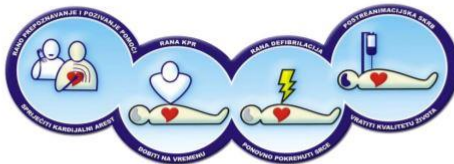
Slika 1.1. Dva prikaza "lanca preživljavanja", slijed radnji koje, kada su potpune i dobro povezane, optimiziraju šanse za preživljavanje nakon srčanog zastoja

Izvor: https://www.ncbi.nlm.nih.gov/pmc/articles/PMC1767705/