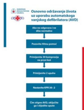
Slika 2.2.1. Algoritam za laike za osnovno održavanje života odraslih u skladu s međunarodno dogovorenim smjericama

U najboljem slučaju, osnovno održavanje života kod odraslih osigurava 30% normalnog minutnog volumena srca, no to je ipak dovoljno za zaštitu mozga i produljenje vremenskog okvira za učinkovitu defibrilaciju. Protok krvi prema naprijed postiže se kao rezultat izravne kompresije srca ("srčana pumpa") i opće kompresije prsnog koša ("torakalna pumpa"). Dostupne su dvije verzije, jedna za spašavatelje bez priručne opreme (slika 2), i jedan za zdravstvenog djelatnika koji može imati lak pristup dodacima dišnih putova i defibrilatoru (slika 3) (18). Na slici 2, provjere reakcije, dišnih putova i disanja slijede u nedostatku spontane ventilacije davanjem dva učinkovita udaha. Osim pomoći u ispravljanju hipoksije, oni će pružiti dodatni test pacijentove reakcije.