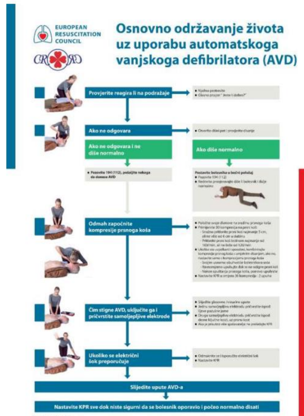
Slika 2.2.2. Algoritam za zdravstvene djelatnike za osnovno održavanje života odraslih (BLS) prema međunarodno dogovorenim smjernicama