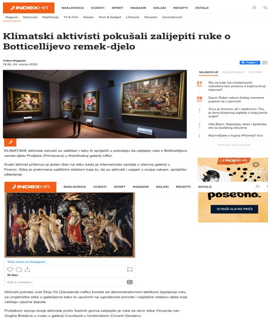
Slika 2: Primjer objave neutralnog teksta kratke forme kao i slike bez izvora na portalu Index.hr, izvor: https://www.index.hr/magazin/clanak/klimatski-aktivisti-pokusali-zalijepiti-ruke-o-botticellijevo-remekdjelo/2382349.aspx

Pod potkategorijom „Oprema priloga“ kod objava vezanih za klimatski aktivizam mladih povezanost teksta i naslova većinom proizlazi iz teksta dok kod samo četiri teksta djelomično odgovara. Objave vezane za klimatski aktivizam mladih koji je usmjeren na uništavanje svjetske umjetničke baštine se ne razlikuju pretežito u povezanosti teksta i naslova, kod tri objave oni proizlaze iz teksta dok je samo jedan tekst koji djelomično odgovara. Također nema puno razlike ni kod grafičke opreme. Kod objava vezanih za klimatski aktivizam mladih prisutno je sveukupno 32 fotografije i tri videa koji su većinom povezani sa tekstom dok samo jedan slikovni prilog nije. Kod objava vezanih za klimatski aktivizam mladih usmjerenog na uništavanje svjetske umjetničke baštine prisutno je sveukupno sedam fotografija i samo jedan video te su svi povezani sa tekstom. Nadalje slikovni prilog u objavama vezanih uz klimatski aktivizam mladih imaju 31 izvor dok četiri nemaju. Kod objava vezanih za klimatski aktivizam mladih usmjerenog na oštećenje svjetske umjetničke baštine prisutno je četiri slikovna priloga koji imaju izvor i četiri koji nemaju.