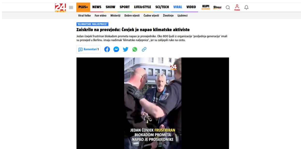
Slika 3: Primjer objave forme vijesti na portalu 24 Sata

U prvoj potkategoriji „Veličina“ kod tekstova vezanih za klimatski aktivizam mladih prisutno je 24 kratke forme, 16 vijesti te osam članaka dok je kod tekstova vezanih za klimatski aktivizam mladih usmjerenog na uništavanje svjetske umjetničke baštine prisutno pet vijesti i dvije kratke forme. Iz ovoga možemo vidjeti kako su u većini, tekstovi vezani za klimatski aktivizam mladih koji je usmjeren na uništavanje svjetske umjetničke baštine najviše pisani u obliku vijesti, dok je najviše prisutna kratka forma kod tekstova vezanih za klimatski aktivizam mladih. Većinom je u obje kategorije više tekstova objavljeno od strane novinske agencije no nije tolika velika razlika kao kod portala Index.hr . Kod objava vezanih za klimatski aktivizam mladih objavljeno je 37 tekstova od strane novinske agencije dok je 11 objavljeno od strane novinara a kod tekstova vezanih za klimatski aktivizam mladih usmjerenog na uništavanje svjetske umjetničke baštine objavljeno je četiri teksta od strane novinske agencije i tri teksta od strane novinara. Stavljena je slika koja predstavlja primjer izgleda forme vijesti na portalu 24 Sata.