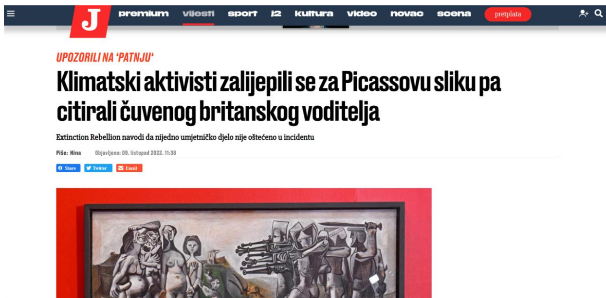
Slika 6: Primjer neutralne obojenosti naslova u Jutarnjem listu

Obojenost naslova kod tekstova vezanih za klimatski aktivizam mladih imala je najviše neutralnost čak 30 njih, 18 je imalo negativnu a šest pozitivnu obojenost. Kod tekstova vezanih za klimatski aktivizam mladih usmjerenog na uništavanje svjetske umjetničke baštine prisutno je pet negativnih obojenosti naslova i četiri neutralnih obojenosti naslova. S toga prikazujem primjer neutralne obojenosti naslov.