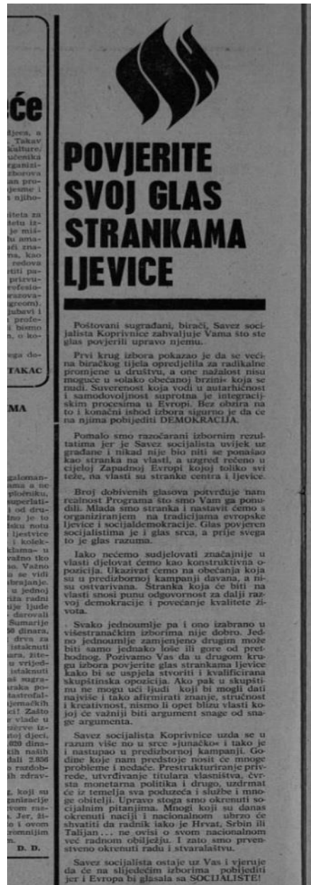
Slika 6. Savez socijalista Koprivnice poziva na glasanje, 4.5.1990.

sljedeće: „ne mogu prežali što na mom listiću na izborima nema kandidata stranke „Jugoplastike“, za čije bih radne i ljudske kvalitete zasigurno glasao.“ 58 Time se zapravo može vidjeti još uvijek privrženost komunizmu i partiji. Zanimljivo je svakako kako ljevica poziva na izbore i da ljudi glasaju za njih. (Slika 6.)