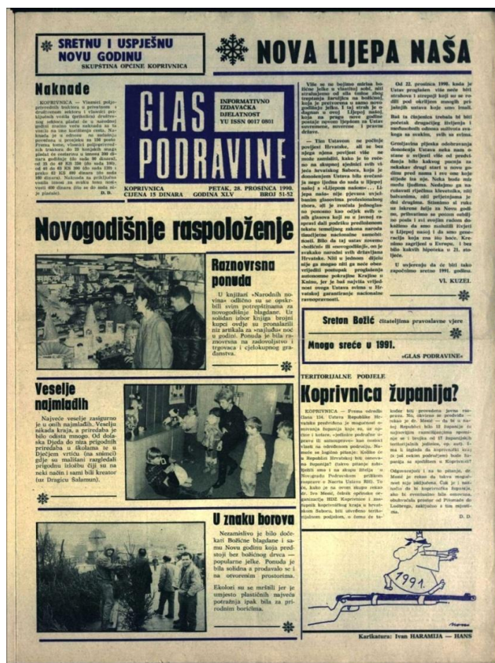
Slika 8. Naslovnica Glasa Podravine, 28.12.1990.g. (izvor: