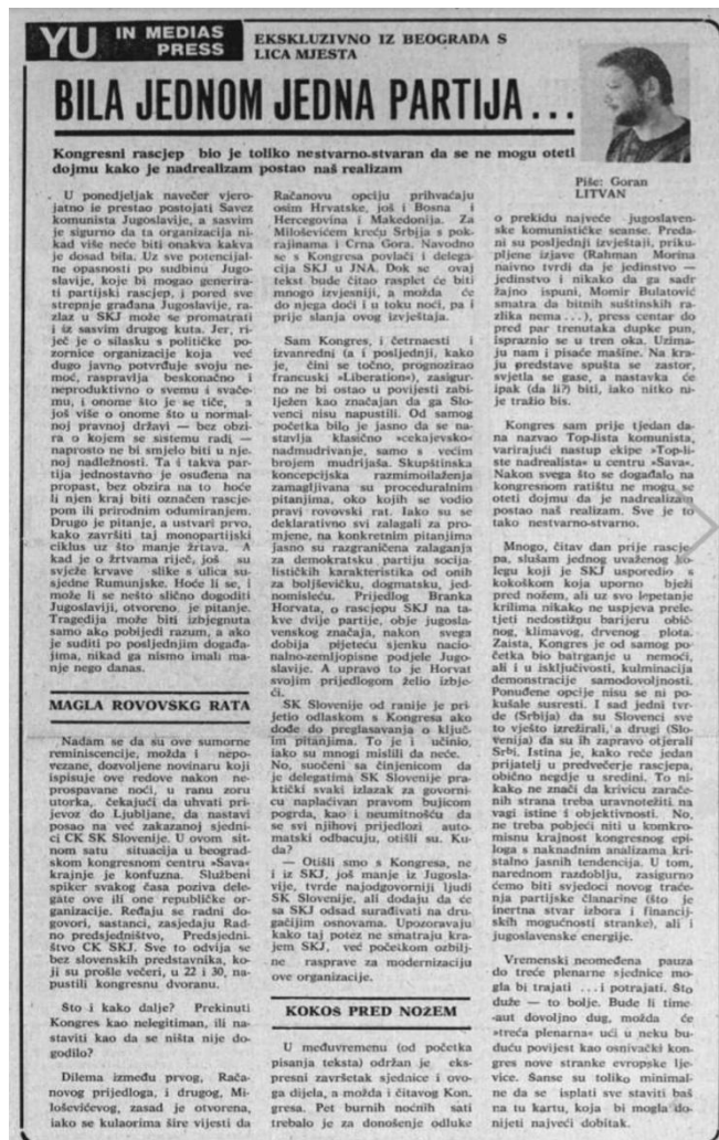
Slika 3. Glas Podravine, 26.1.1990.g. (izvor:

Također, početkom 1990. održana je skupština Saveza novinara Jugoslavije (SNJ) na kojoj je delegacija Udruženja novinara BiH dala inicijativu za preobrazbu SNJ, što je tada i prihvaćeno. Napisano je kako novinari traže „ozakonjenje prava i slobodu novinarske profesije“ i kako ne žele monopol SSRN ili partije. Uz to dodaju kako bi „novinarska organizacija prema toj inicijativi trebala biti udruženje novinara koji poštuju profesionalna pravila i etičke norme bez obzira na njihova politička uvjerenja.“ 43