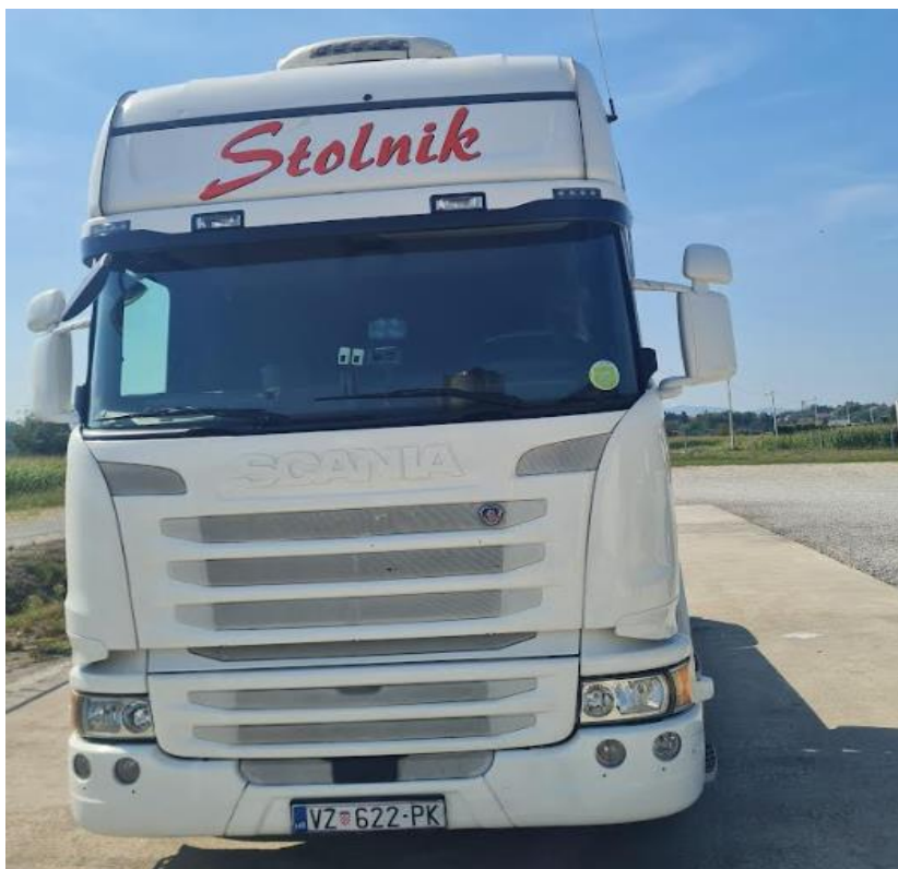
Slika 1 Prikaz kamiona poduzeća Stolnik

Kako bi se stvorili uvjeti za ocjenu i analizu rada vozila u voznom parku, potrebno je da ih svaki autoprijevoznik podijeli u skupine vozila koja imaju iste tehničko-eksploatacijske karakteristike i čije je tehničko stanje približno jednako.