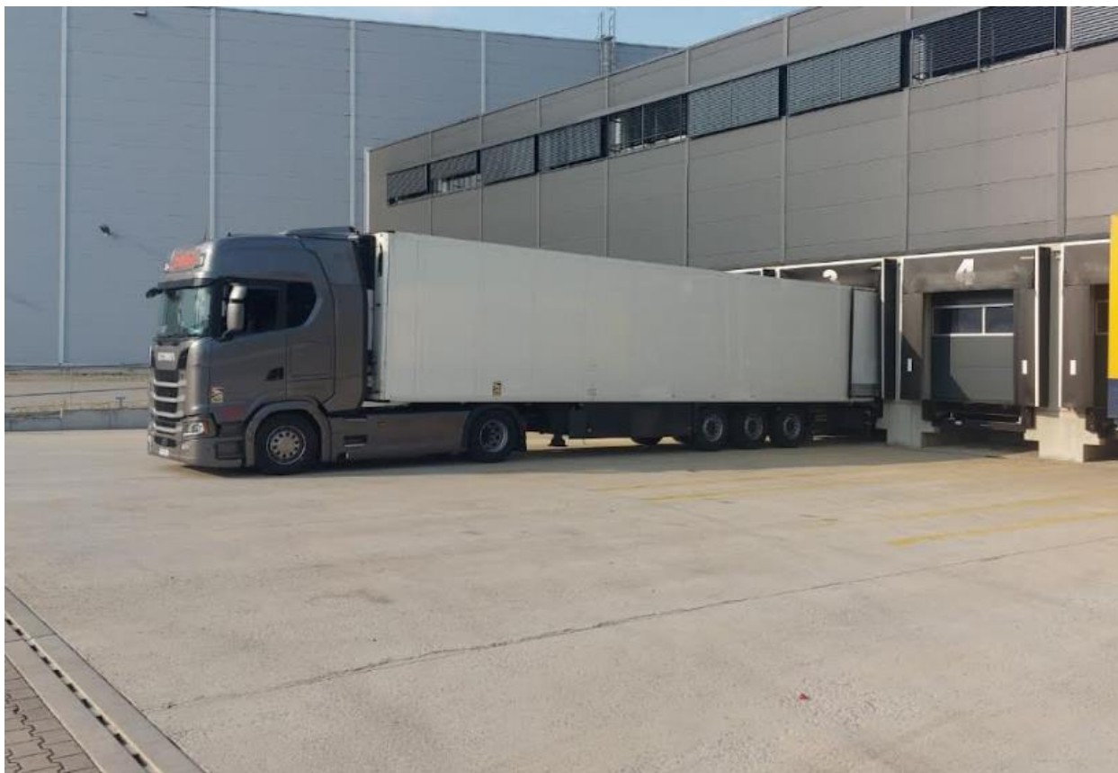
Slika 4 Prikaz prihvata robe