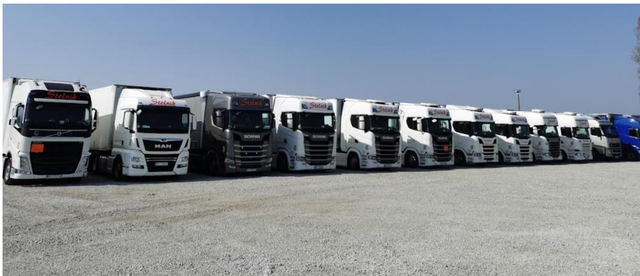
Slika 2 Prikaz voznog parka poduzeća Stolnik d.o.o

Na slici 2 su prikazana vozila kojom raspolaže poduzeće Stolnik d.o.o.