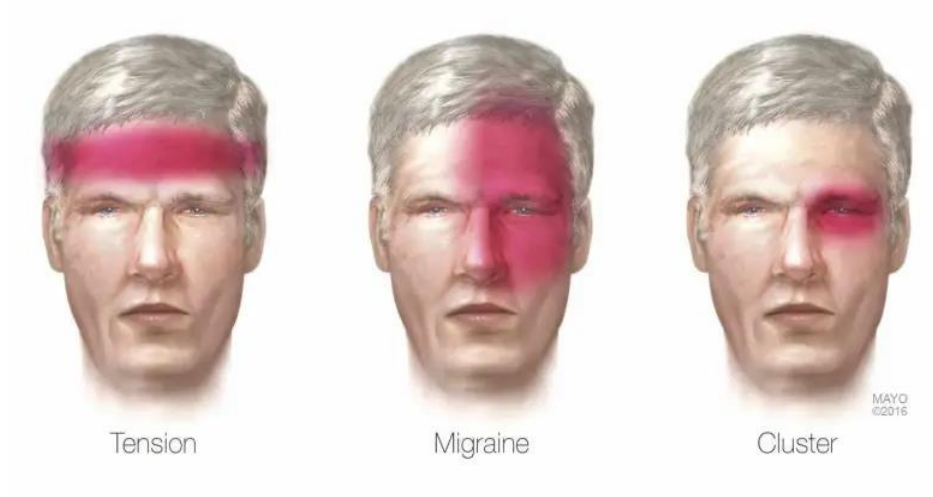
Slika 5.3.1. Prikaz zahvaćenosti dijela glave kod glavobolja