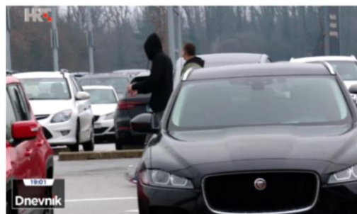
Foto: snimka zaslona