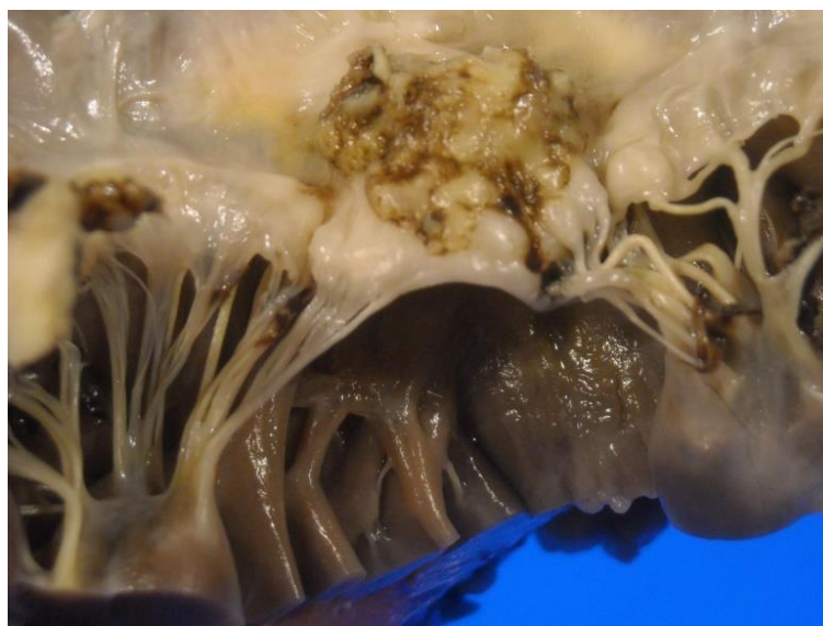
Slika 2.1. Prikaz vegetacije mitralnog zaliska kod infekcijskog endokarditisa,

Etiologija infektivnog endokarditisa je kompleksno područje radi svoje raznolikosti, a koje uključuje infekciju srčanog endokarda i srčanih zalistaka mikroorganizmima. Najčešći uzročnici endokarditisa su bakterije, pri čemu se najčešće spominju bakterije iz roda Staphylococcus , Streptococcus i Enterococcus . Ostali uzročnici endokarditisa uključuju gljive, viruse i ostale mikroorganizme kao što su klamidije i rikecije (6). Endokarditis se obično javlja kada mikroorganizmi dospiju iz krvotoka putem infekcije iz drugih dijelova tijela, najčešće zuba, kože ili dišnog sustava kojima prethodi lokalna upala. Ti mikroorganizmi mogu se naseliti na srčanom endokardu gdje potom dolazi do infektivnih naslaga odnosno vegetacije mikroorganizma. Takve vegetacije mogu oštetiti srčane zaliske, uzrokovati srčane mane ili dovesti do komplikacija poput srčanog zatajenja ili embolija.