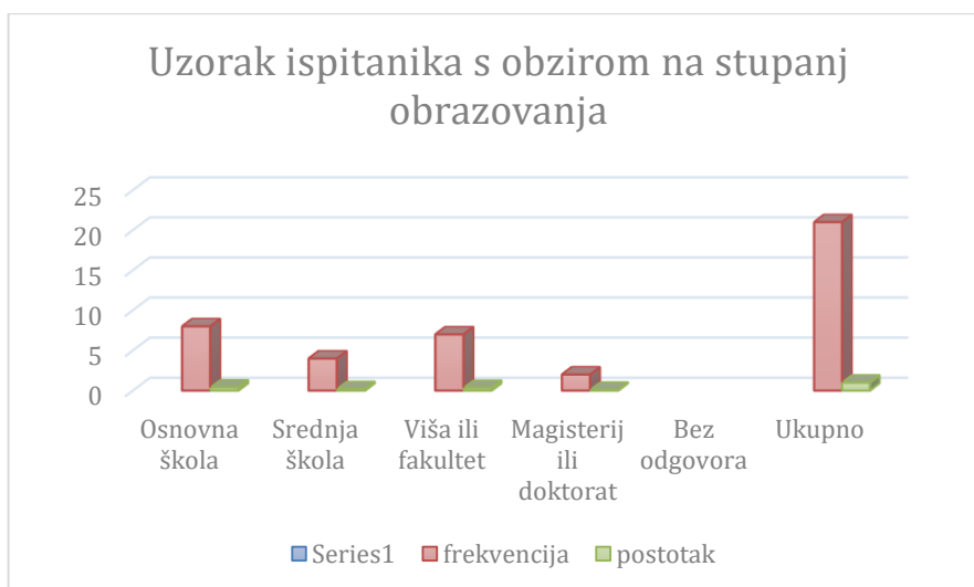
Grafikon 3. Uzorak ispitanika s obzirom na stupanj obrazovanja

U Tablici 3 vidljivo je da je osam sudionika još u osnovnoj školi (38,10%), dok je stupanj obrazovanja osoba starije životne dobi (65 plus) varirao od srednje škole koju je završilo 4 sudionika (19,05%), zatim više ili visoke škole koju je završilo sedam ispitanika (33,33%), dok su magisterij ili doktorat stekli dvoje ispitanika (9,52%).