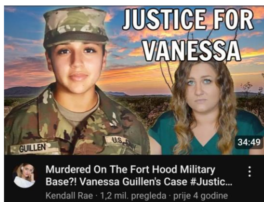
Slika 6.4.2. Primjer naslovne slike videozapisa Kendall Rae 21

priča o nestalim osobama i povremenih komentara o širim društvenim temama. Ono što se izdvaja jest njezina usredotočenost na podizanje svijesti o manje poznatim slučajevima i korištenje platforme za isticanje problema koji možda neće dobiti toliku pozornost važnijih novinarskih kanala ili portala. Svoju karijeru započela je 2.8.2012. godine kada je objavila videozapise s uputama kako se našminkati i slično, no nikad nije pomiješala različite teme. Kasnije je objavljivala videozapise na temu teorija zavjere i misterija. Godine 2017. počela je objavljivati videozapise o nestalim osobama. Među prvima je bio video o nestaloj djevojčici (Ashe Degree), koji sada „stoji“ na gotovo 1.5 milijuna pregleda. U prvih 30 sekundi videa Kendall spominje organizaciju „Thorn“, koja svojom inovativnom tehnologijom pokušava spasiti nestalu i iskorištavanu djecu. U videu koji traje 16 minuta uspije upoznati nove gledatelje s organizacijom koja pomaže ugroženoj djeci, pokušava dobiti donacije za spomenutu organizaciju i ukazati na tada ne tako poznat slučaj. U mnogim videima prikazuje članove obitelji žrtava kako bi im pružala platformu da govore o svojim voljenima, o procesu ili nekim problemima u istrazi. Neprestano se bori za pravdu i ne boji se ukazati na propuste koje su možda učinili policija, pravosudni sustav ili zakon. Njezini videozapisi ne samo da podižu svijest, već služe za edukaciju zajednice. Smatram stoga kako je jedan od podcijenjenih kanala s 3.82 milijuna pretplatnika.