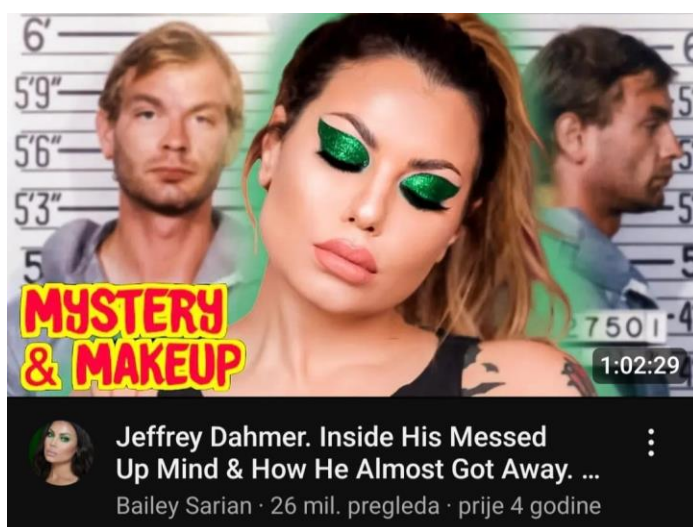
Slika6.4.1. Primjer naslovne slike videozapisa BaileySarian 20

objavila je 15.1. 2019. godine na kojemu je prikupila više od 11.5 milijuna pregleda. Od onda je dosegla nevjerovatnu popularnost i tokom godina je stekla više od 7.4 milijuna pretplatnika. Ovakvu vrstu videozapisa objavljuje i danas, a kasnije u analizi bit će utvrđeno da objavljuje više videozapisa kroz tjedan. Osim toga što je neprofesionalno šminkati se dok govorite o dekapitaciji ljudskog tijela i ostalim temama tog sadržaja, isto tako je neprimjereno šaliti se kroz video;po čemu je Bailey i poznata. Usto, u gotovo svakom videu ima veliki smiješak te se ponekad čini da o dotičnim temama (ubojstvo, silovanja, otmice...) priča bezbrižno. Svaki videozapis na YouTubeu mora imati naslovnicu koja treba biti uočljiva kako bi gledatelj htio kliknuti na video, no smatram kako se to može napraviti s ukusom.