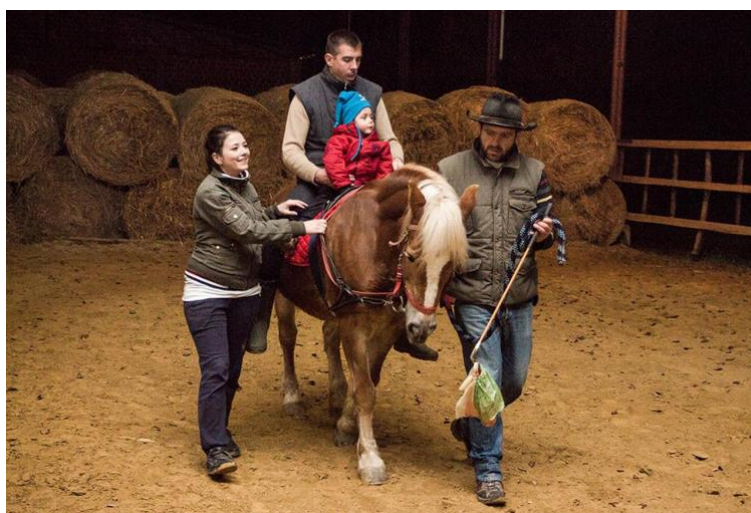
Slika 3.9.1 Prikaz sujahanja

Uloga sujahanja je pomoći u održavanju pravilnog položaja sjedišta i obratiti pažnju na položaj zdjelice. Ako je zdjelica nagnuta previše unatrag, sukorisnik primjenjuje nježan pritisak palcem na zdjelicu korisnika kako bi ju potaknuo da se pomakne prema naprijed. Ako je suprotno, sukorisnik koristi svoje ruke da povuče zdjelicu unatrag. Isto tako, jedan od ciljeva sujahanja je osigurati oslonac za glavu i trup korisnika te bi korisnika trebalo postupno poticati na samostalno održavanje ravnoteže. Slika 3.9.1 prikazuje sujahanje [24].