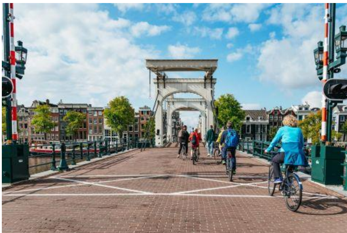
Slika 2. – Most za bicikle u Amsterdamu

"Korištenje bicikla kao sredstva prijevoza ne samo da smanjuje emisiju CO 2 , nego također pridonosi očuvanju okoliša. Osim toga, mnoge tvrtke isplaćuju dodatak na plaću svim svojim zaposlenicima koji na posao dolaze biciklom jer smatraju da vožnja na dva kotača doprinosi i boljem zdravlju. " [3]